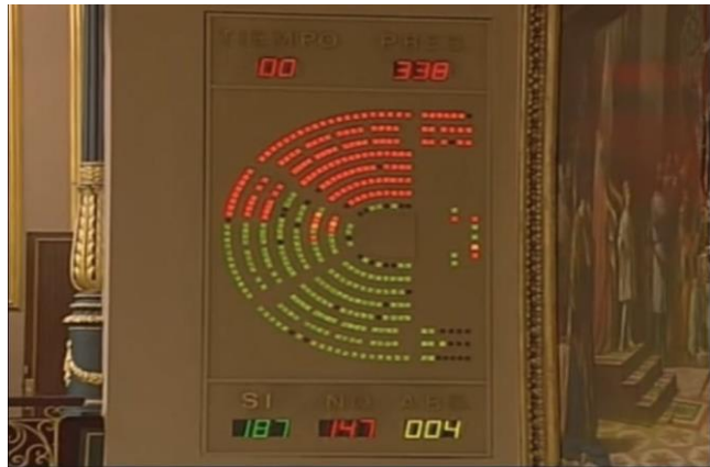
Ilustración 1. Votación de la ley 13/2005, para la legalización del matrimonio de personas del mismo sexo, de 30 de junio de 2005