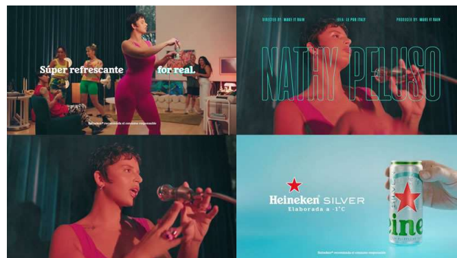
Imagen 10: Campaña Heineken

Fue elegida para realizar esta campaña por su gran talento musical y la gran repercusión que tiene sobre el público joven, en esta ocasión la cantante versiona la canción Fresh del grupo Kool y The Gang.