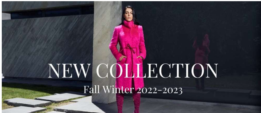
Imagen 7: Campaña Genny

La modelo y además pareja del futbolista Cristiano Ronaldo fue seleccionada para llevar a cabo la campaña de otoño invierno de Genny, una marca de ropa de origen italiano. La marca se decantó por Georgina debido a su feminidad y gran naturalidad que le caracteriza y que es capaz de inspirar a otras mujeres.