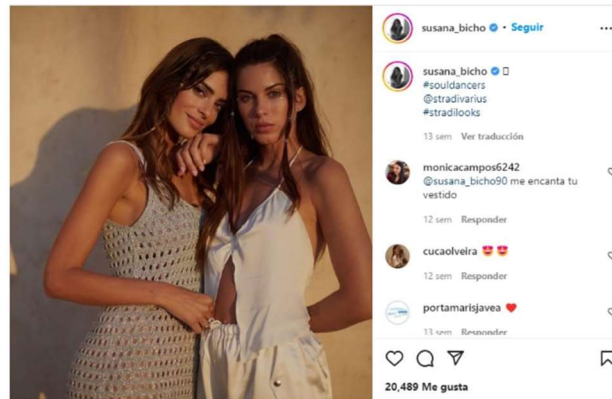
Imagen 1: Campaña Stradivarius