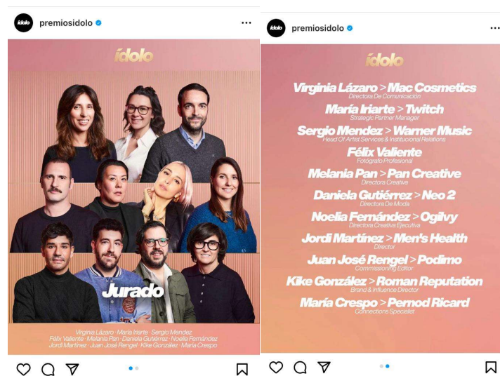
Imagen 17:: Jurado de los Ídolo, publicación Instagram