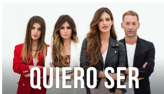
Imagen 11: Programa "Quiero ser"