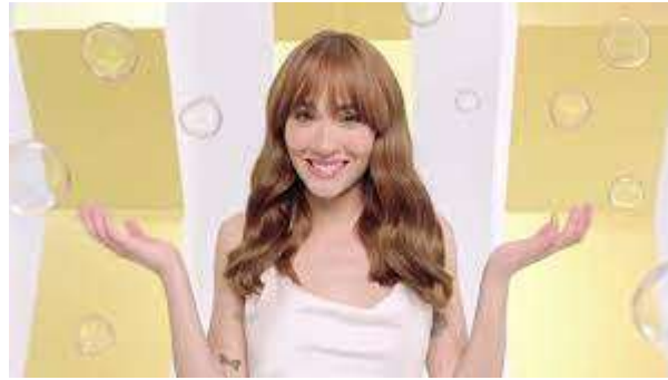
Imagen 5: Campaña Pantene

La cantante debutó como embajadora de la marca e introdujo su nuevo cambio de look. Tanto la marca de champús como la cantante salieron muy favorecidos ya que además en esta promoción se incluyó una nueva canción de la artista, tras el éxito de esta campaña Pantene volvió a contar con la imagen de Aitana para más campañas.