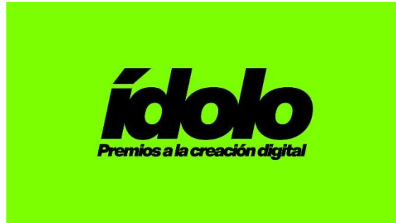
Imagen 15: Logotipo de los premios