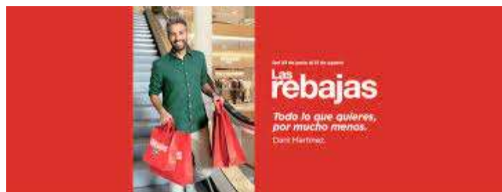
Imagen 8: Campaña Corte Inglés

Una simple campaña comercial que tuvo un gran éxito gracias al presentador y actor Dani Martínez. Los objetivos del anuncio eran transmitir al público buen ambiente y diversión. En esta ocasión se utilizó el jingle 11 compuesto por Los Rodríguez titulada “Mucho mejor”.