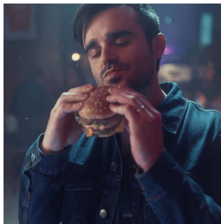
Imagen 6: Campaña McDonald's

El TikTok y humorista que cuenta con 10,3 millones de seguidores en TikTok y 3 millones en Instagram, ha protagonizado una campaña de la cadena alimenticia de comida rápida la cual ha resultado muy exitosa.