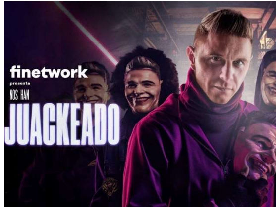
Imagen 9: Campaña Finetwork

En esta ocasión se apostó por el futbolista del Betis Joaquín, caracterizado por su gran humor e ingenio, el slogan del anuncio fue “Nos han Juackeado” algo que caló muy bien en el público. La campaña tuvo un extenso plan de medios en TV, redes sociales y radio.