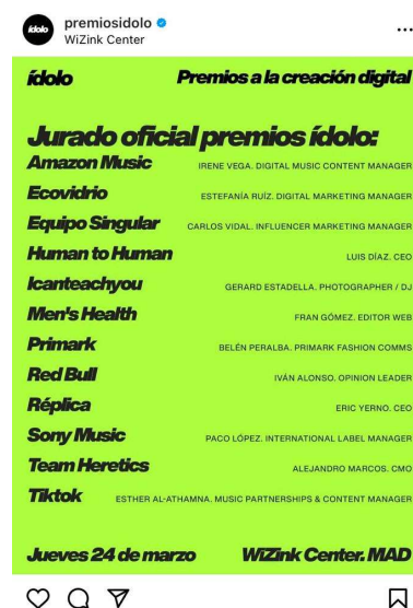
Imagen 16: Jurado de los Ídolo, publicación Instagram