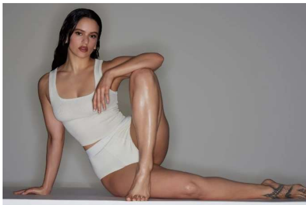
Imagen 4: Campaña Skims

La marca de ropa interior de Kim Kardashian y Jens Grede ha elegido a Rosalía como embajadora de la campaña de “Cotton collection”, una colección formada íntegramente por productos hechos a base de algodón. Se seleccionó la imagen de Rosalía para romper con los estándares y por ser un nuevo icono para las nuevas generaciones.