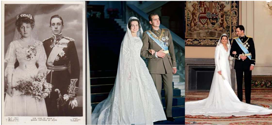
Imagen 2. Comparación de la indumentaria de los contrayentes de los casos analizados