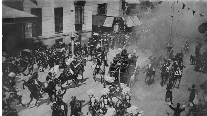
Imagen 4. Instantánea del momento de la explosión en la calle Mayor

respectivamente. Además, fue durante este recorrido cuando un ciudadano lanzó un ramo con explosivos al carruaje de SS.MM. el rey Alfonso XIII y la reina Victoria Eugenia dejando centenares de heridos y veintiocho fallecidos.