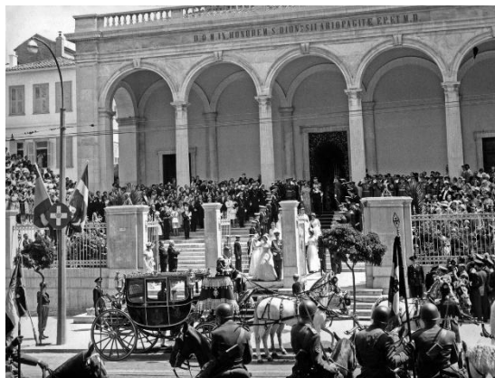
Imagen 3. D. Juan Carlos y Dña. Sofía el día de su boda en Atenas

Las tradiciones también se mantienen en lo que respecta al cortejo nupcial. Esta parte es fundamental a nivel comunicacional, ya que es la forma en la que los recién casados se presentan ante los ciudadanos. Este se realizó en el caso de S.M. el Rey Alfonso XIII y S.M. el Rey Juan Carlos I en carroza, debido al simbolismo histórico muy particular, mientras que S.M. el Rey Felipe VI, lo realizó en un Rolls-Royce. Únicamente en el primer caso el transporte estaba decorado con la bandera de los países natales de los cónyuges (bandera española y británica), lo que significa la pérdida de peso que estos elementos tienen ya a nivel simbólico. Algo a destacar es cómo desde Casa Real se decidió que D. Felipe y D. a Letizia realizaran el trayecto con un coche descapotable para dar una imagen más cercana al público que se agolpaba en las calles, aunque debido a inclemencias meteorológicas se decidió realizarlo con un coche cubierto.