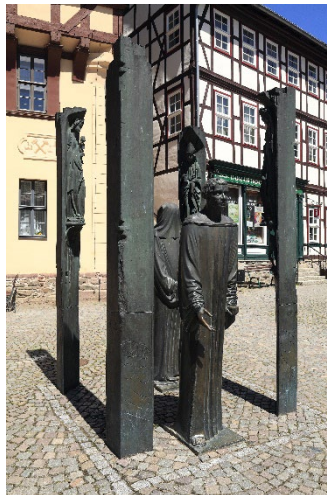
Figura 9, Müller, (s.f.) [Monumento a Thomas Müntzer en Stolberg]

Entre sus atracciones turísticas pueden encontrarse sus mercados, sus casas de entramado popular o Fachwerkhäuser , la Iglesia de San Martini o la ruta de la Moneda Antigua. (Stadt-stolberg.de, s.f.)