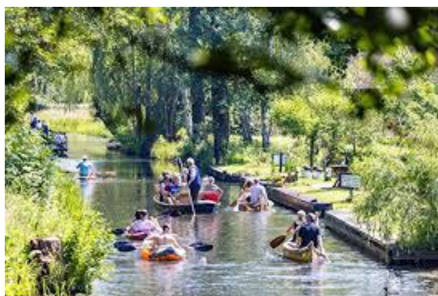
Figura 19, (s.f.), Berlin Tourismus & Hotels [deportes acuáticos en Spreewald]