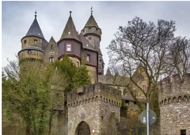
Figura 13, Díaz, 2020 [Fotografía a lateral del Castillo de Braunfels]

Aunque ha sufrido una clara transformación y ahora es un amplio complejo arquitectónico, Braunfels en el siglo XIII sólo constaba de una residencia y dos altas torres, amurallado circularmente. (Castillos y Palacios Web, s.f.)