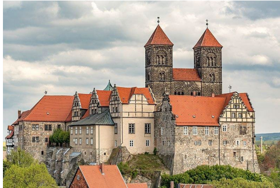
Figura 10, Candal, 2023 [Fotografía de la Colegiata, Castillo de Quedinburg]

Quedlinburg cuenta con la Galería Lyonel Feininger que, con modernidad, muestra la gran colección gráfica artística del germano-estadounidense del mismo nombre. (DW Akademie, s.f.)