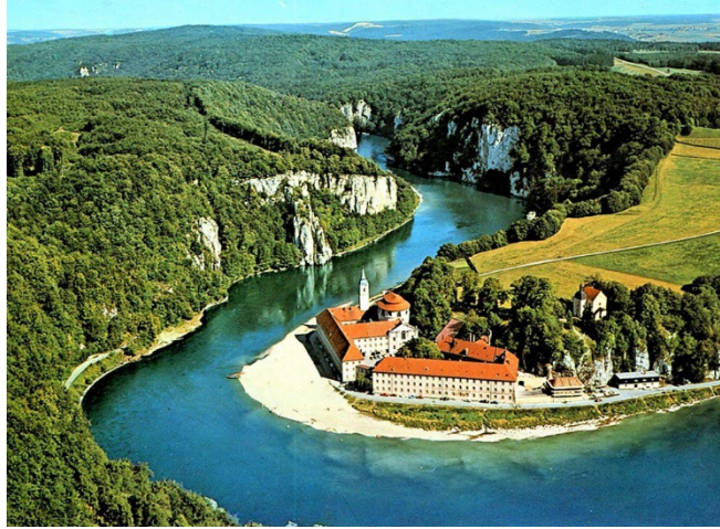
Figura 11, Vinos y Caminos, Gulín, 2017 [Abadía de Welteburg sobre el río Danubio]