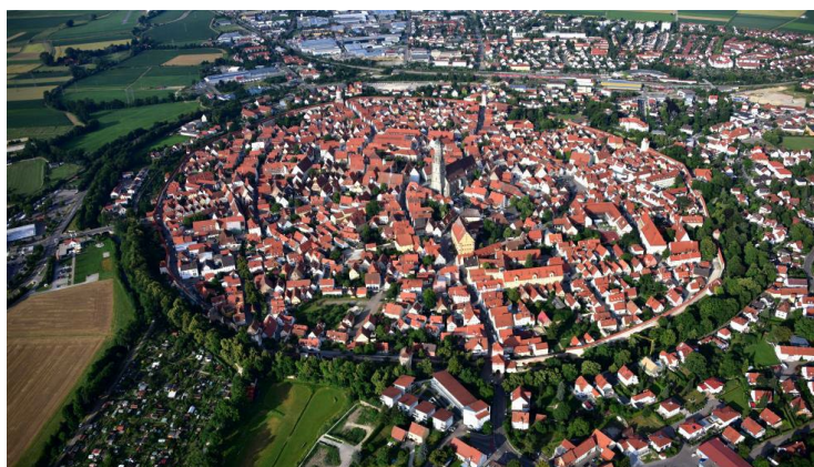
Figura 8, Revista 20 minutos , 2021 [Fotografía de la disposición estructural de Nördlingen]

También dispone de un precioso paisaje urbano, con edificaciones autóctonas, museos y obras de arte de gran valor. Destaca por su característica realmente peculiar, que es considerar que se ubica dentro de un cráter. (Nördlingen Tourism, 2023)