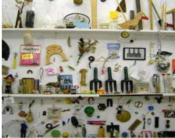
Figura 5, Museum der Unerhörten Dinge, (s.f.) [Fotografía de los objetos aleatorios que se encuentran en el lugar]