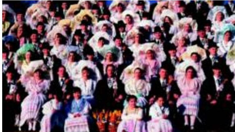
Figura 20, (s.f.), El Periódico [Sorabos con la ropa típica de su tribu]

Conocer la cultura sorbia o soraba, con su idioma actualmente en peligro de extinción, pero que forma parte de aquellos dialectos alemanes, resulta realmente de gran interés para cualquier visitante, dado que esta tribu de origen eslavo cada vez trata de integrarse más en la sociedad alemana, viajando para estudiar en la capital berlinesa por su cercanía, existiendo la posibilidad de su desaparición con el paso de los años. (Álvarez, 2008).