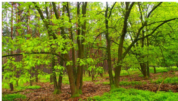
Figura 21, 2014, Vagamundos [bosque de hayas]

Declarado Patrimonio Mundial por la UNESCO en el año 2011, este bosque se sitúa en un enclave muy potente desde el punto de vista turístico. Su ubicación pertenece al estado de Brandeburgo, y es uno de los mayores hayedos, en cuanto a extensión y belleza, del país. “Es parte de la Reserva Natural del Bosque de Grumsiner, e integrado en la reserva de la biosfera de Schorfheide-Chorin, que con 1300 km 2 es una de las más grandes de Alemania” (Olmo, 2014)