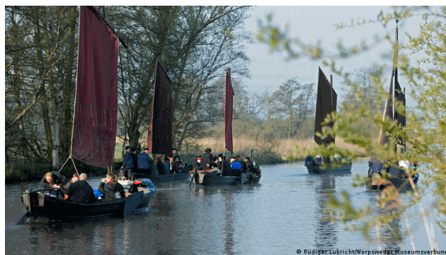
Figura 3, DW Akademie, 2014. [actividad de retiro artístico en Worpswede]

Además, Worpswede goza de una situación inmersa en la naturaleza, lo que sirve inspiración a los artistas, y se constituye como un destino maravilloso para cualquier turista.