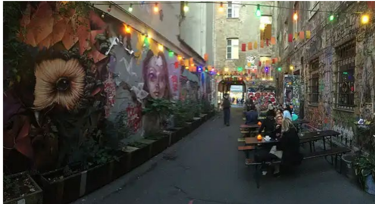
Figura 15, Pacheco, (s.f.) [Callejón Dead Chicken]

y hoy en día es un punto de encuentro para berlineses que se reúnen en sus bares y restaurantes. (Blanco, 2019).