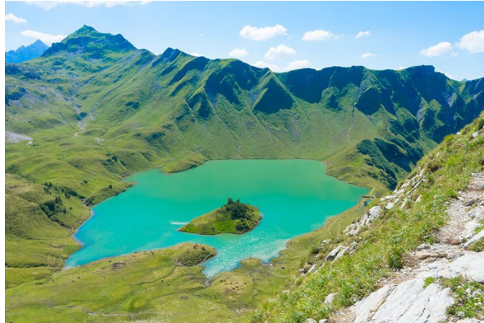
Figura 18, 2018, The Globetrotting Detective [Vista del lago Schrecksee, Alemania]

Además, está considerada por especialistas de este tipo de turismo como “el lago de montaña más impresionante que he visto en Alemania. No sólo es uno de los lagos más hermosos del sur de Alemania, sino también uno de los lagos más hermosos del planeta [...]” (Leska, 2020).