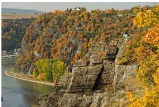
Figura 17, (s.f.) [paisaje en las montañas contiguas al río Rin].

Ubicado en la unión entre Bonn, Koblenz y Wiesbaden, lo constituyen varios senderos unidos conformando una ruta de 320 kilómetros, en la margen derecha del río Rin alemán. Esta ruta está dividida en varias etapas, facilitando la inclusión de alguna de ellas en un itinerario de viaje. Rheinsteig está dotada de bosques, paisajes y viñedos, unas vistas muy especiales que son el gran desconocido para el turismo tanto nacional como internacional en el país. (Sitio Oficial de Turismo de Rheinsteig, 2023)