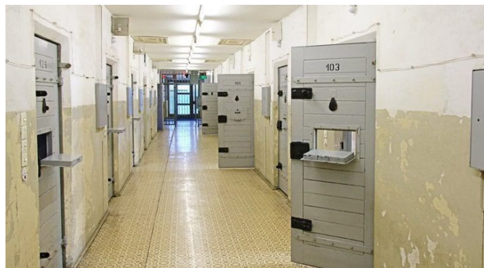
Figura 16, Escenarios de guerra. Calvo, 2017. [Pasillo de celdas de la prisión]

Otro dato curioso es que, si se solicita una visita guiada en alemán, puede que el guía que la explique sea uno de los antiguos prisioneros de la Stasi. (Martín, 2017).