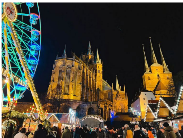
Figura 6, Campos, 2023 [Fotografía de los mercados navideños de Erfurt]

Todos los veranos la ciudad de Erfurt celebra un festival ambientado en la Edad Media. Su nombre es Festival de la Ciudad Vieja, y los viajeros pueden encontrar en él puestos artesanos, los cánticos dedicados a la mina, lugar de trabajo de muchos de sus habitantes a lo largo de sus vidas y diversos comerciantes ambulantes. (Sitio Web Oficial de Turismo de Erfurt, s.f.)