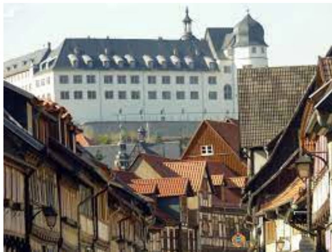
Figura 12, Ladage, s.f. [Fotografía de la vista exterior del castillo]

En el año 2003, la Fundación Alemana para la Conservación de Monumentos lo restauró y renovó para dejarlo como ahora se encuentra, en un estado casi óptimo. (Guadix, s.f.)