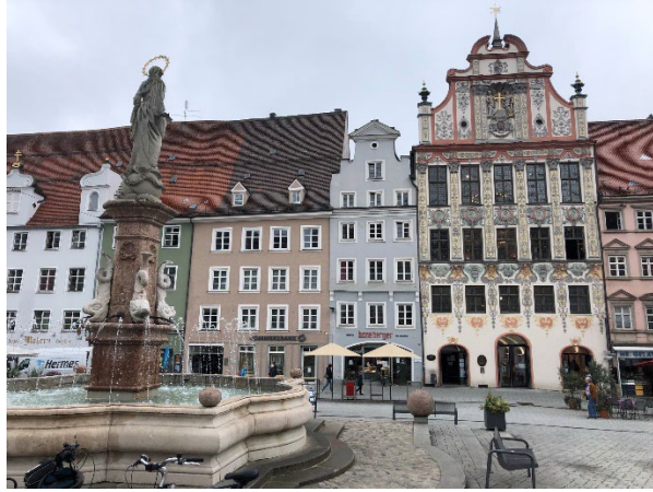
Figura 2, 2021, Ser Viajero [Hauptplatz, complejo arquitectónico en Landsberg am Lech]