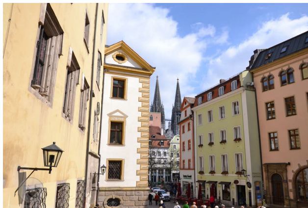
Figura 7, Mittermeier (s.f.) [centro histórico de la ciudad de Ratisbona]

Es sin duda una representación firme de la riqueza cultural de Alemania que no se encuentra en el número uno ciudades más visitadas en el país. (Mittermeier, 2019).