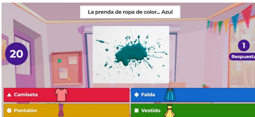
Anexo 18. Ejemplo actividad Kahoot de los colores. Elaboración propia.