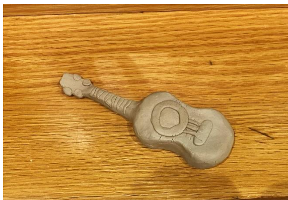
Anexo 28. Tabla aspectos actividad 16.

Anexo 27. Ejemplo de figura representativa del país de acogida. Elaboración propia.