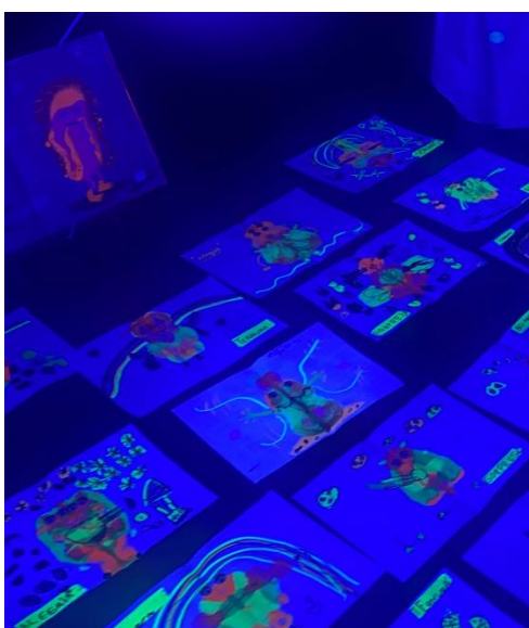
Anexo 17. Tabla aspectos actividad 9.