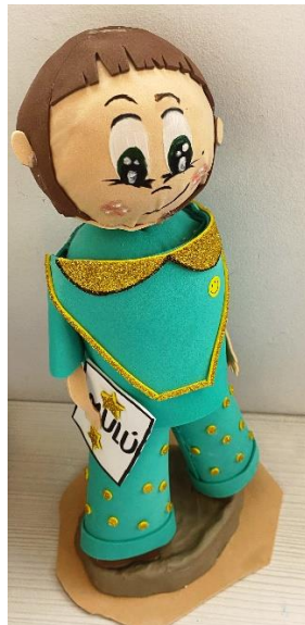
Anexo 11. Tabla aspectos actividad 5.