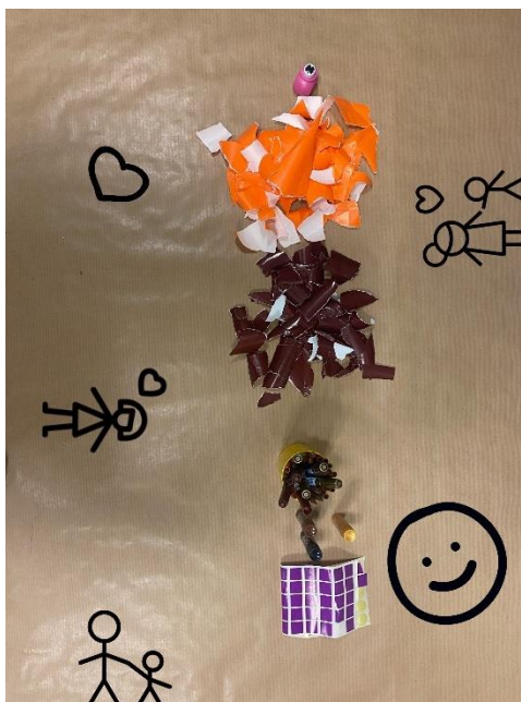
Anexo 33. Tabla aspectos actividad 19.