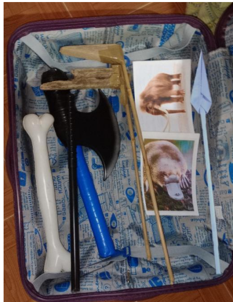
Figura 3: Actividad 2