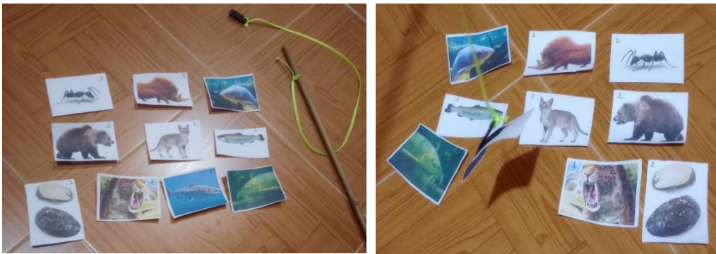
Figura 5: Actividad 10