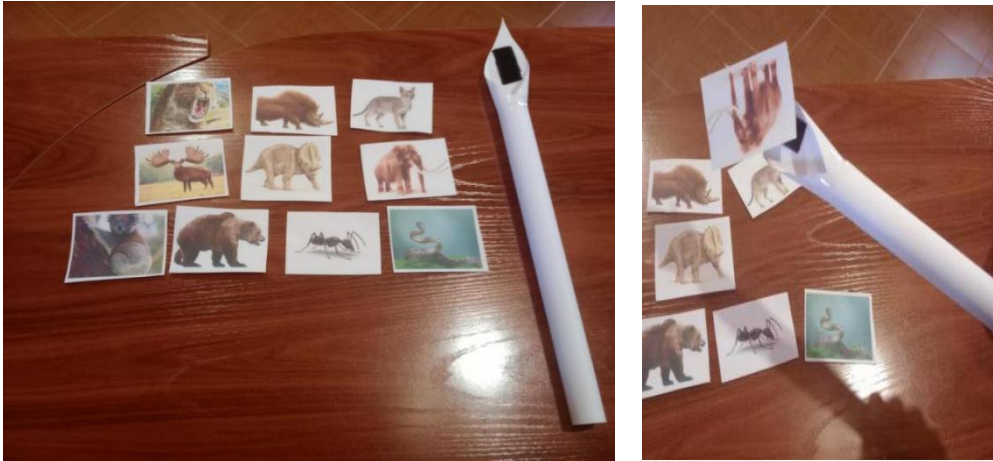
Figura 4: Actividad 9