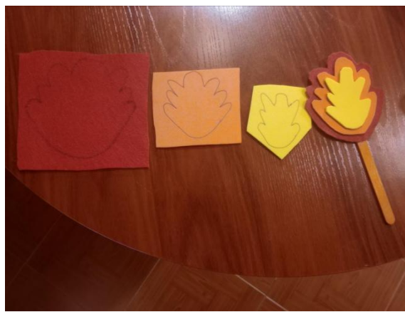
Figura 8: Actividad 15