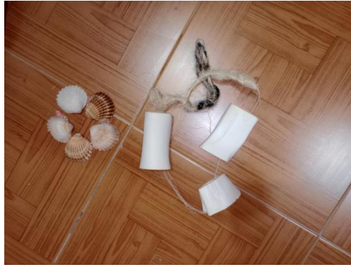
Figura 7: Actividad 14