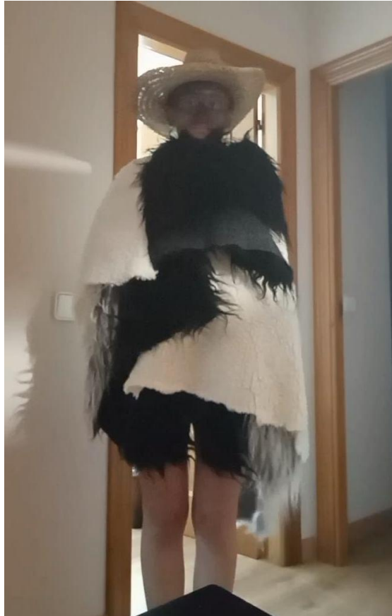
Figura 2: Actividad 1