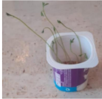
Figura 10: Actividad 20