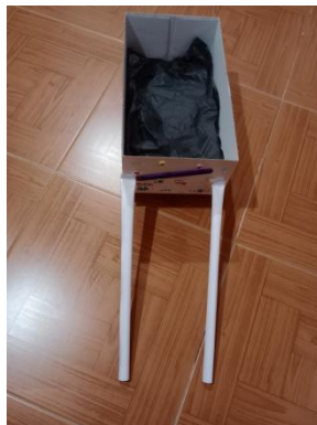
Figura 9: Actividad 19