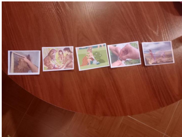
Figura 6: Actividad 13