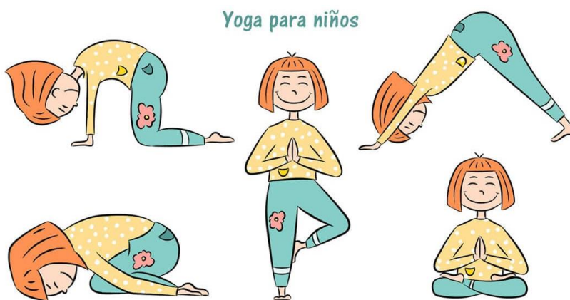
Figura 3. Posturas de yoga infantiles

Además, la maestra les enseñará otra serie de posturas y técnicas a mayores, para que puedan usar en cualquier momento. Algún ejemplo de estas es: