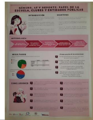
Figura 3. Póster de exposición de uno de los proyectos de aprendizaje tutorizado