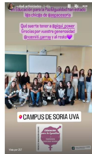
Figura 8. Difusión de una de las actividades de transferencia desde la sociedad a la universidad en Instagram