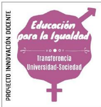
Figura 1. Logo del PID