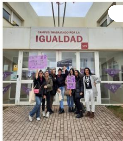
Figura 5. Alumnas con las pancartas en el Campus