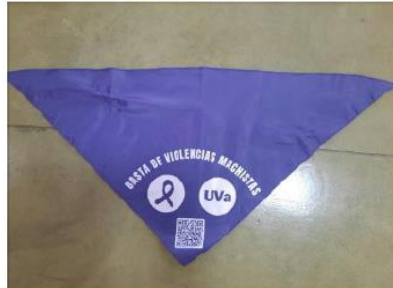
Figura 2. Pañuelos para el 25N