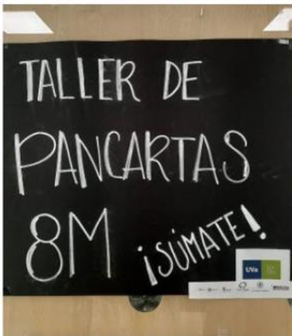
Figura 4. Cartel del taller de pancartas