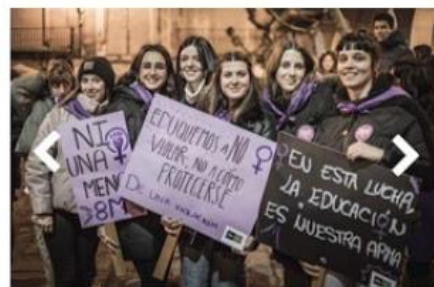
Figura 7. Alumnas con las pancartas en la manifestación del 8M