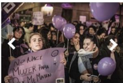
Figura 6. Alumnas con las pancartas en la manifestación del 8M