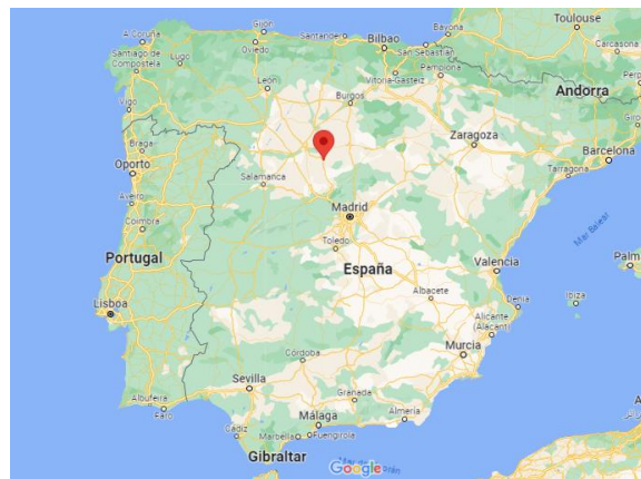
Figura 1. Ubicación de Cuéllar.

Cuéllar es una villa y municipio de la provincia de Segovia situado a 60 Km de esta y a 50 Km de Valladolid. Se encuentra a medio camino por la Autovía A-601 entre estas dos ciudades (Google, s.f.), lo cual le supone una ventaja comercial debido a la fácil comunicación mediante carretera. Pertenece a la comarca natural de Tierra de pinares que se comparte entre la provincia de Valladolid y de Segovia.