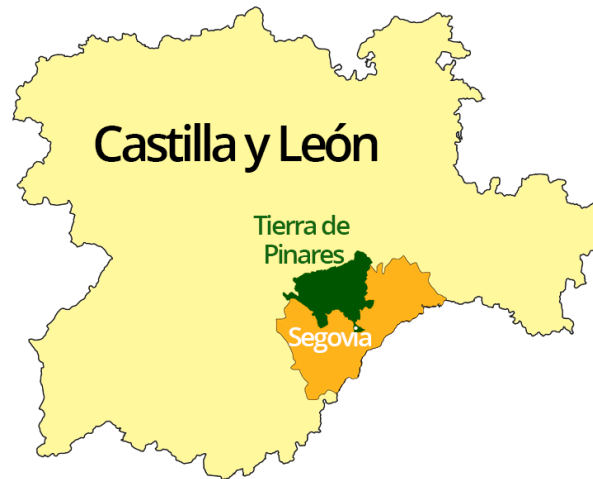
Figure 3. Tierra de pinares segoviana.