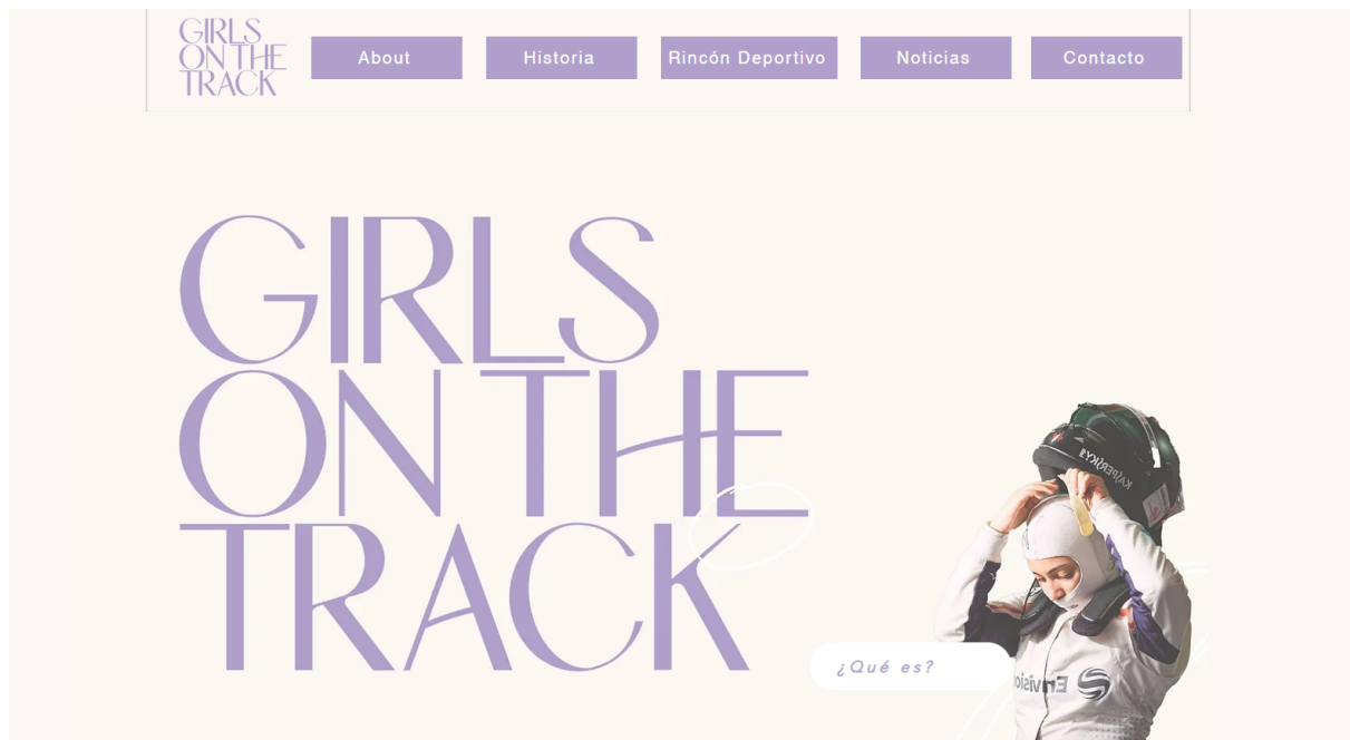
Imagen 6.2.1 Inicio de la página web.