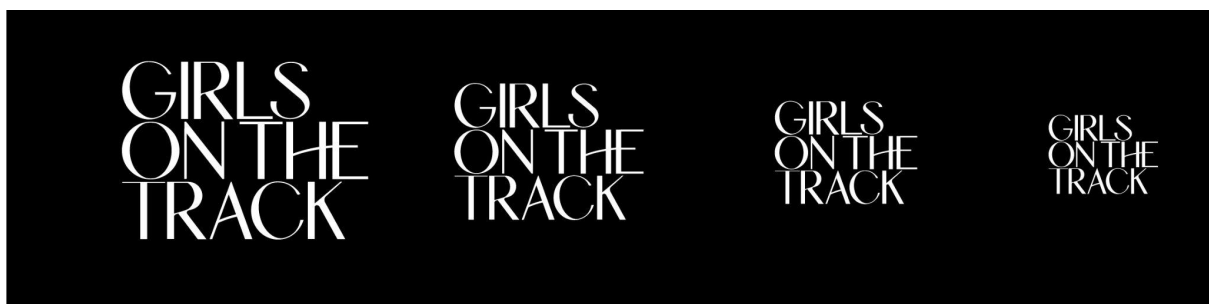
Imagen 3.2.3 Tamaños de logo en negativo.