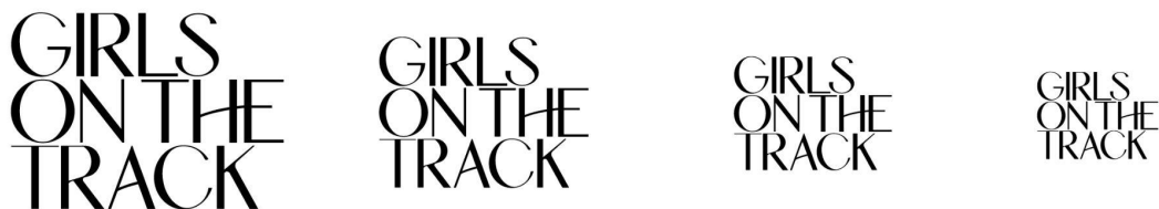
Imagen 3.2.2 Tamaños de logo en positivo.

En estas imágenes en negativo se puede observar la legibilidad del logo en distintas escalas y sobre colores claros y oscuros.