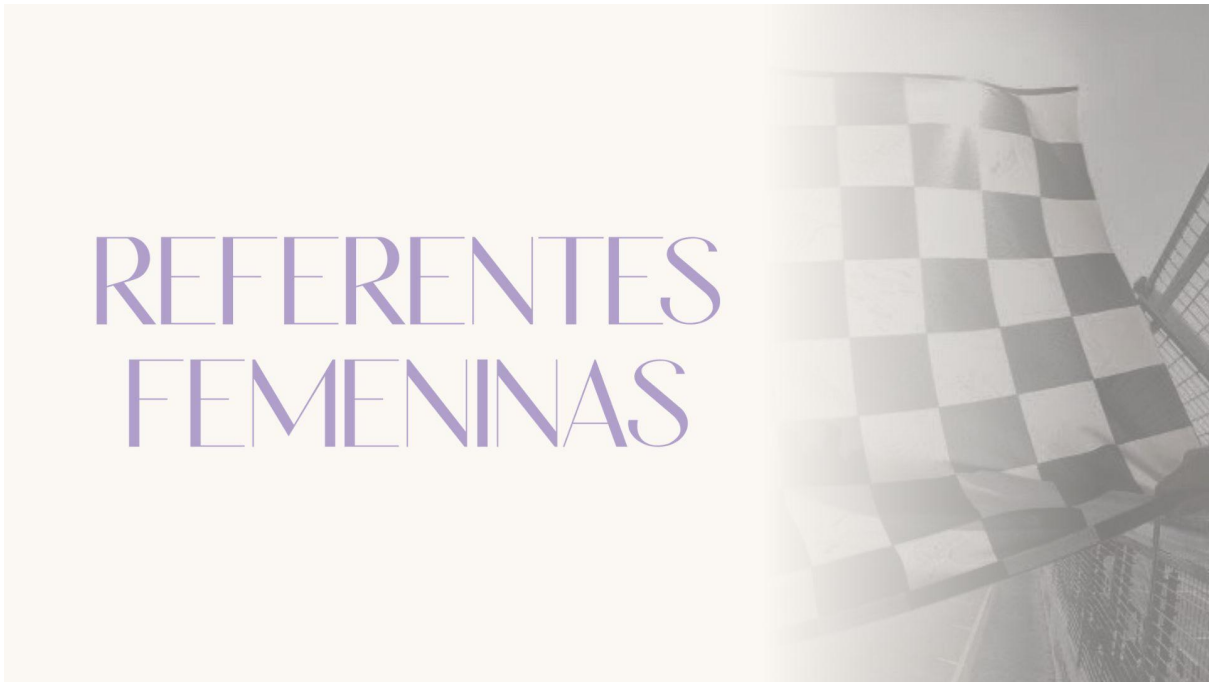
Imagen 6.2.3 Portada para la sección referentes femeninas de la web.