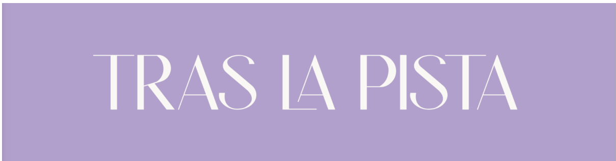
Imagen 6.2.4 Portada para la subsección tras la pista de la web.