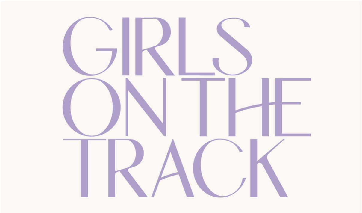
Imagen 3.2.5. Logo final sobre fondo beige utilizado en el diseño de la página web.

Algunas de las claves del éxito de un buen logo es que tenga una idea detrás o sea coherente con la marca. En mi caso todo esto se puede ver en la tipografía que expresa fuerza y empoderamiento, como el color.