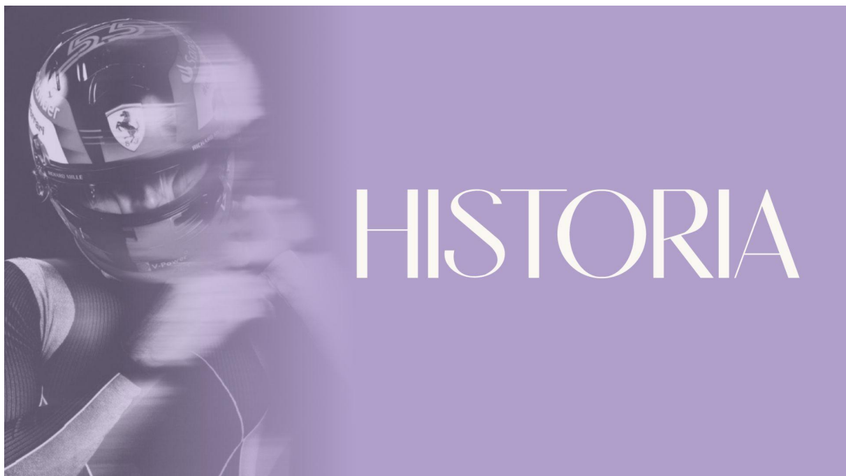
Imagen 6.2.2 Portada para la sección historia .