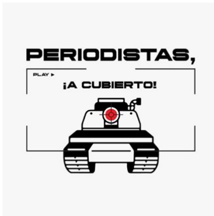
Logotipo de Periodistas, ¡A cubierto!

El logotipo del podcast se elaboró con Illustrator. En la elaboración de la identidad visual del podcast, una de las prioridades era representar en una imagen el mensaje principal del proyecto: la poca preocupación social y mediática que existe actualmente hacia la figura del periodista de guerra. La imagen muestra un tanque y aviones militares, símbolos propios de la guerra, que se dirigen hacia la cámara representada con el play , propio del formato televisivo. El logo pretende transmitir la importancia que brindan los