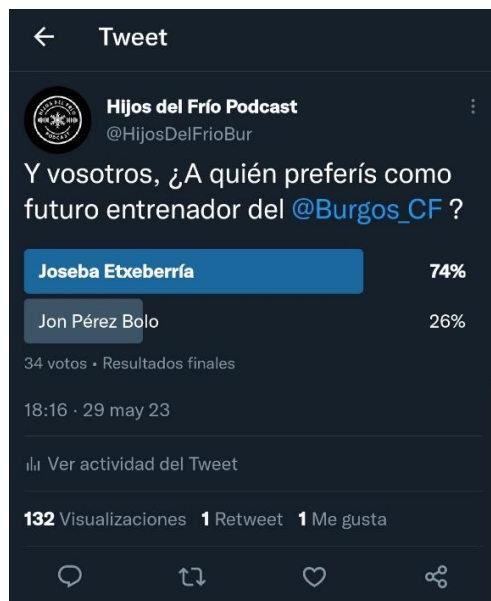
IMAGEN 2. ENCUESTA DE TWITTER / FUENTE: ELABORACIÓN PROPIA

Para ello, la red social que primero recibió contenido fue Twitter por la brevedad del formato y la facilidad de crear contenido en forma de tuits. A través de la cuenta de Twitter, se publicaron diferentes tuits en referencia a la actualidad del Burgos C.F. con el objetivo de posicionar la marca del proyecto como una referencia dentro de la información sobre la actualidad del Burgos C.F. entre los aficionados que utilizan esta plataforma para enterarse de las noticias más importantes. Otras funciones que motivaron el uso de Twitter inicialmente fueron la promoción del podcast a través de las redes sociales, interactuar con el público objetivo, por ejemplo, a través de encuestas y realizar hilos informativos en referencia a los hechos de actualidad que involucran al Burgos C.F.