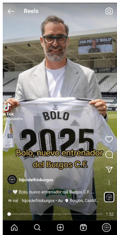
IMAGEN 6. REEL DE INSTAGRAM