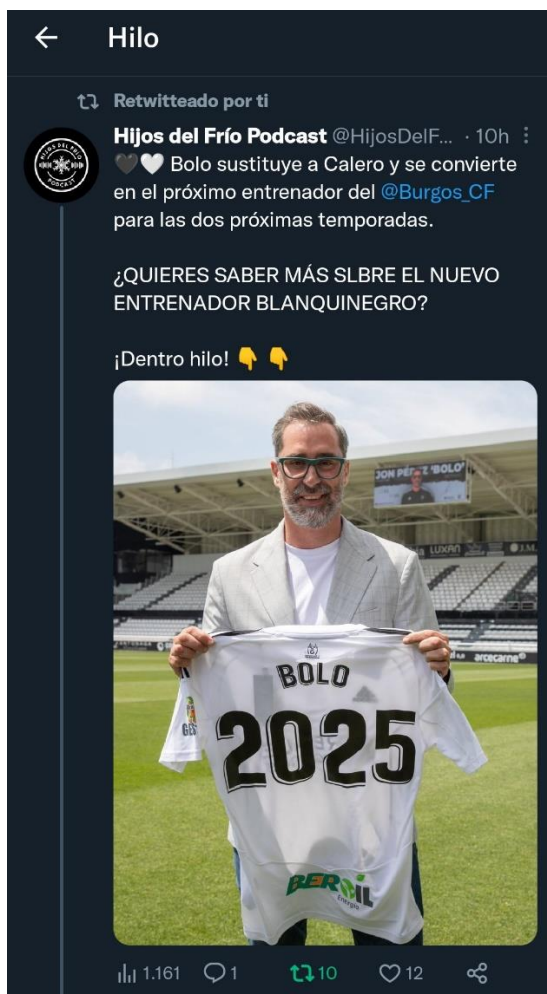
IMAGEN 4. HILO DE TWITTER