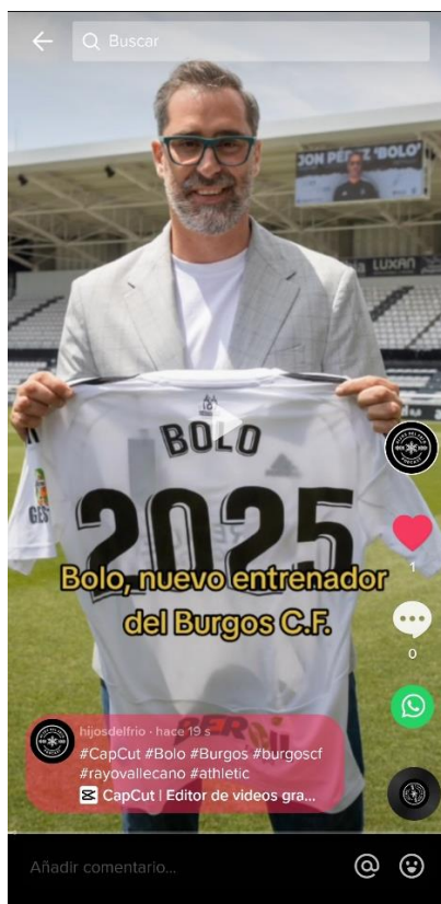
IMAGEN 5. CONTENIDO DE TIK TOK

Las otras dos redes sociales que forman parte del proyecto, Instagram y Tik Tok, se percibieron desde un primer momento como canales de publicación de contenido audiovisual, por lo que tuvieron un bautizo posterior a Twitter. En estos dos casos, se elaboró y se publicó un contenido compatible con ambas plataformas que, como se ha explicado anteriormente en esta memoria, consiste en vídeos informativos, breves (menos de tres minutos), en formato vertical y dinámicos. A este formato de vídeo se le denomina ‘ story telling ’ o narrativa audiovisual. Es decir, contar una historia breve a través de la imagen. El ‘ story telling ’ tiene una gran similitud a los hilos de Twitter, pero cambiando el formato escrito por el audiovisual que, a priori, es más atractivo.