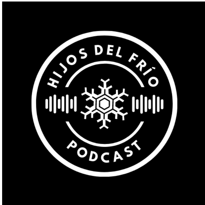
IMAGEN 1. LOGOTIPO HIJOS DEL FRÍO PODCAST

Una vez creadas las cuentas, para asegurar un nombre similar en todas las plataformas, se procedió a la creación del logo o imagen corporativa del proyecto. Para su elaboración se utilizó la aplicación web Canva, que permite la creación de logos, y se escogió un diseño acorde al nombre del proyecto. Éste fue el resultado: