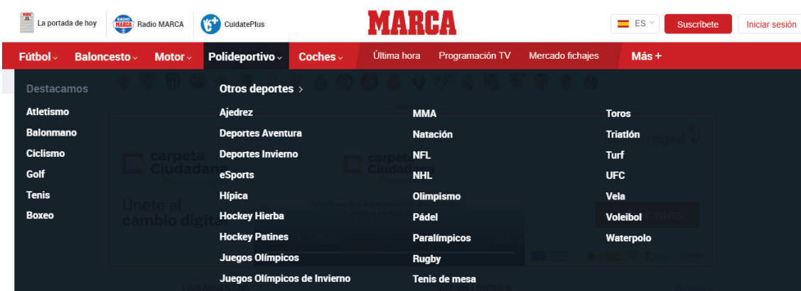
Imagen 1. Captura de pantalla del sumario de contenidos de MARCA