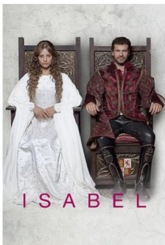
Imagen 12. Serie de televisión Isabel.