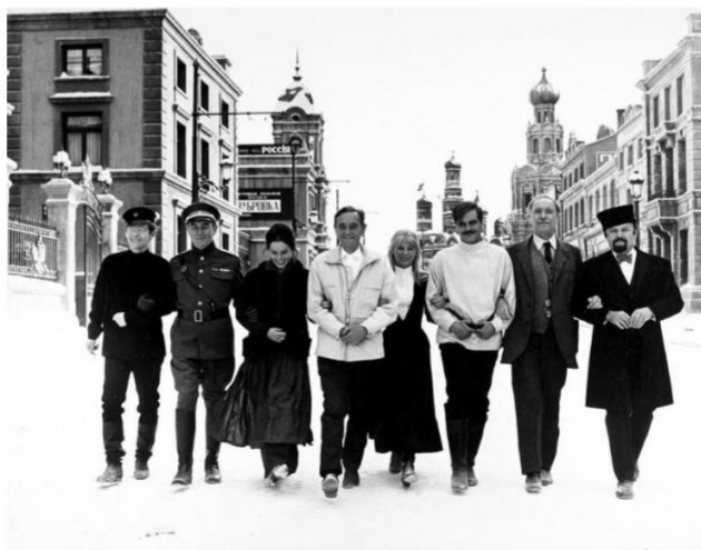
Imagen 23. Rodaje de Doctor Zhivago en Canillas, Madrid.

Dirigida por David Lean en 1965, esta producción de Hollywood fue rodada en España, y utilizó varias localizaciones de la ciudad y la provincia de Soria durante su rodaje, debido a que las autoridades rusas no permitieron rodarla en su país. La película está ambientada en Rusia y trata la historia de amor del protagonista: Yuri Zhivago. Los cineastas eligieron Madrid y Soria para sus rodajes. Como Soria no ofreció ninguna de sus espectaculares nevadas de la época, tuvieron que utilizar diversos productos para simularla. Algunas de las localizaciones sorianas utilizadas en el rodaje fueron La Estación de Cañuelo de Soria, Candilichera, Ólvega de Moncayo, Villar del Campo y el Pantano de la Cuerda del Pozo