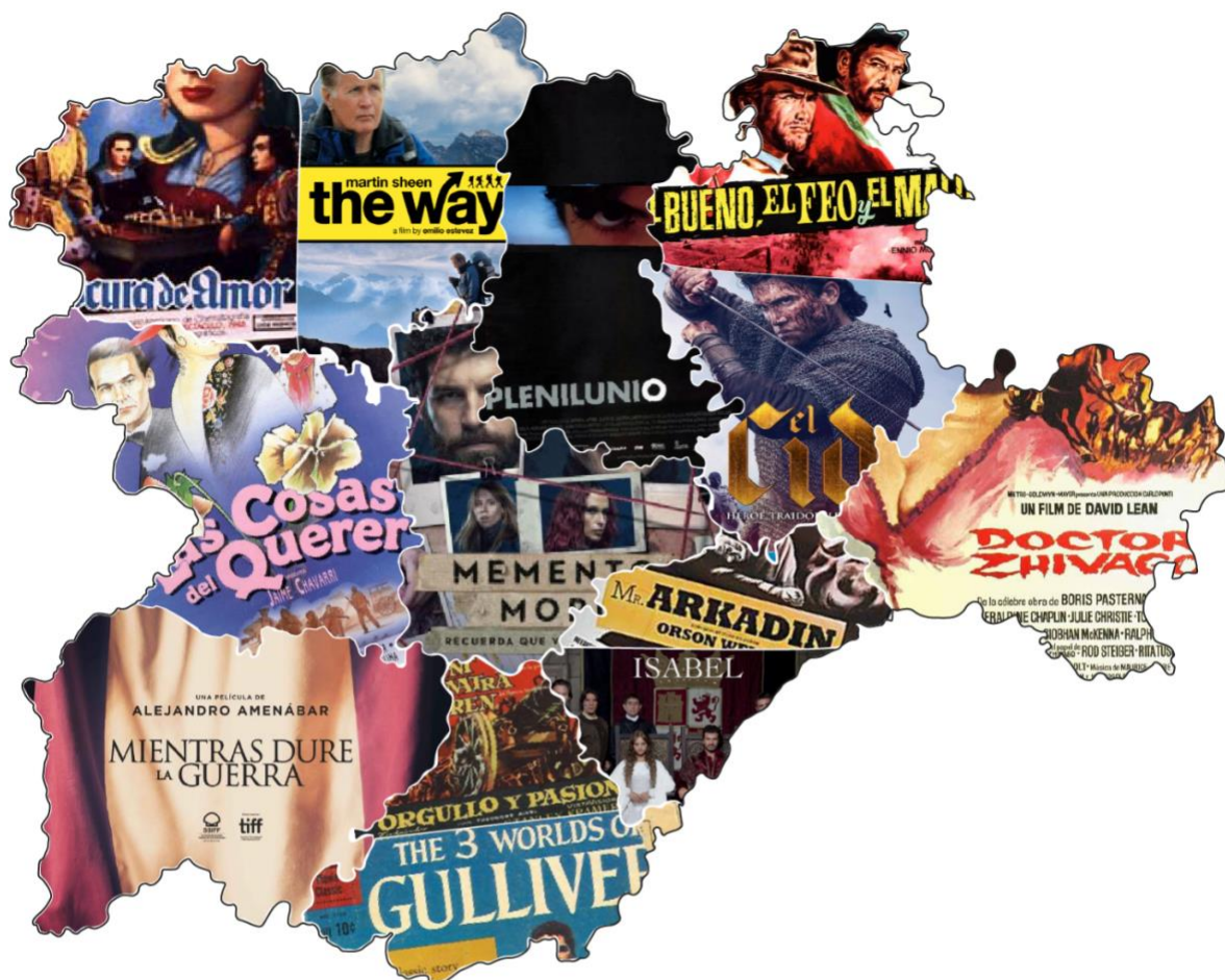
Imagen 11. Mapa de películas y series rodadas en Castilla y León.