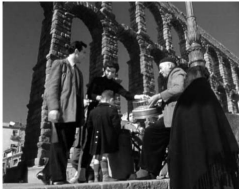
Imagen 15. Rodaje de Mister Arkadin en Segovia.