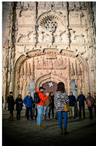
Imagen 21. Fotografía de ruta teatralizada de Memento Mori.

En esta serie aparecen numerosas localizaciones conocidas de la ciudad, entre ellas la Plaza de Fuente Dorada, el Puente Mayor, la Plaza San Pablo o la Plaza España, entre otras.