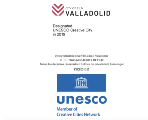
Imagen 5: .

De la Film Commission que más información podemos encontrar es de la de Valladolid, prácticamente la más activa de todas. Fue creada a finales de 2014, dentro del plan de acción para la promoción del turismo internacional de la Sociedad Mixta de Turismo. Entre sus objetivos se encuentra “promocionar Valladolid y su provincia como localización de cualesquiera proyectos audiovisuales locales, nacionales o internacionales, con la finalidad inmediata de generar actividad industrial local, y paralelamente promover un nuevo nicho de actividad turística” (valladolidcityoffilm.com). Además, trabaja en colaboración con otras asociaciones como la Plataforma del Audiovisual de Castilla y León o la Semana Internacional de Cine de Valladolid (SEMINCI). Desde el año 2017 se han creado una serie de pequeñas ayudas directas a la producción local. Esto nos deja constancia de la voluntad por parte de esta entidad de mejorar la calidad y el número de rodajes producidos en Valladolid, y en general, en nuestra comunidad. Tanto es así que en octubre del año 2019 la ciudad de Valladolid fue designada por la Unesco “ Creative City of Film ” (Ciudad Creativa del Cine/ Audiovisual). Desde ese momento, el Ayuntamiento de la ciudad ha trabajado en numerosas iniciativas para promover la creación de proyectos locales. En estas iniciativas se ha trabajado con Polonia, Japón o la India (Valladolid.es).