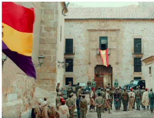
Imagen 30. Escena de la película Mientras dure la guerra .

Este rodaje se llevó a cabo en la ciudad de Salamanca, y entre sus localizaciones encontramos La Universidad de Salamanca, la Iglesia de San Martín, la Plaza de San Benito, la catedral, la Plaza Mayor o la Universidad Pontificia.