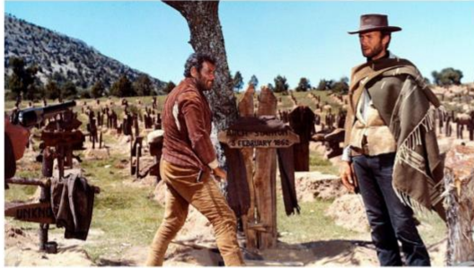
Imagen 24. Escena de El bueno, el feo y el malo, rodada en la provincia burgalesa.

El bueno, el feo y el malo es una película de Sergio Leone estrenada en 1966. Protagonizada por el gran Clint Eastwood, cuenta la historia de tres hombres que buscan un tesoro, y que solo pueden conseguir con la colaboración y participación de los tres. En esta película podemos encontrar los municipios burgaleses del Monasterio de San Pedro de Arlanza en Hortigüela, el campo de concentración de Betterville en Carazo, el río Arlanza y el Cementerio de Sad Hill en el Valle de Mirandilla (Santo Domingo de Silos).