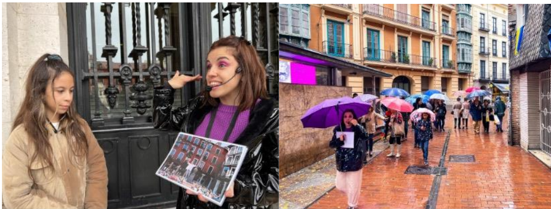
Imágenes 3 y 4: Ruta “Voy a pasármelo bien”.

La película fue rodada en la ciudad de Valladolid, y visto el éxito conseguido en los cines con la producción de este filme, la ciudad aprovechó la oportunidad para crear la ruta “Voy a pasármelo bien”. Este proyecto fue llevado a cabo entre el Ayuntamiento de Valladolid y la Sociedad Mixta de Turismo (Valladolid Film Commission). En esta ruta teatralizada, los visitantes serán partícipes de una supuesta audición para una segunda parte de la historia y, acompañados por una directora de casting , recorrerán algunos de los lugares en los que se ha rodado la película, acompañados de la música de Hombres G durante el recorrido. Esta actividad se ha creado con el objetivo de que los asistentes se diviertan a la vez que conocen diferentes enclaves de la ciudad, cada vez más comprometida con el cine. Durante las semanas que estuvo disponible esta actividad, más de 500 personas fueron partícipes de ella, tanto locales como turistas de otras zonas del país, datos ofrecidos por la Valladolid Film Commission.