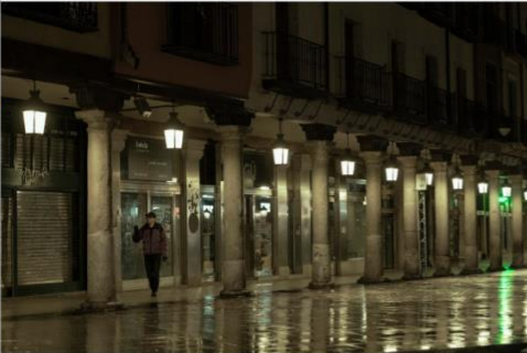
Imagen 19. Imagen de la serie Memento Mori en Valladolid.