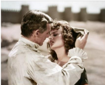
Imagen 16. Imágenes de Orgullo y Pasión (1957). . Fuente: muralladeavila.com