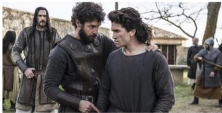
Imagen 25. Imagen de la serie El Cid (2020).