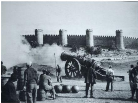
Imagen 17. Escena bélica en Orgullo y Pasión . .

Orgullo y Pasión fue dirigida por Stanley Kramer y estrenada en 1957. Los papeles protagonistas los interpretan los destacados Cary Grant, Frank Sinatra y Sophia Loren. Esta producción estadounidense, rodada en Ávila, trata sobre la Guerra de la Independencia entre 1808 y 1814. En una de las escenas se representa un bombardeo acontecido durante el conflicto. Como el rodaje se producía frente a la muralla de Ávila, y ante todo prevalecía el interés por mantener intacto el monumento, se construyó una muralla idéntica para rodar las escenas que más peligro pudieran ocasionar. A raíz de este hecho, surgió un bulo entre los habitantes que decía que la muralla iba a ser destruida.