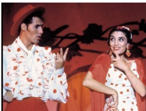
Imagen 28. Escena de la película Las cosas del querer.

En 1989 se rodó en la provincia de Zamora la película Las cosas del querer , dirigida por Jaime Chávarri. Entre sus actores principales se encontraban los conocidos Ángela Molina, Manuel Bandera, Amparo Baró o Santiago Ramos. La película es un musical que narra la historia de dos cantantes que buscan la fama en el sector musical. Aunque la película está ambientada entre Madrid y Barcelona, algunas de sus escenas fueron rodadas en la provincia zamorana, en concreto en el municipio de Toro.