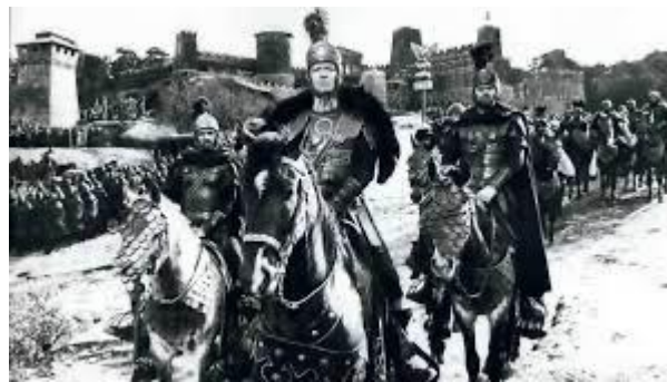
Imagen 2: La Caída del imperio romano.

En la actualidad, a pesar de que Castilla y León no se encuentre en el podio de las comunidades autónomas con más producción de cine, sí que es cierto que está intentando crear un cambio en la comunidad en los últimos años. En el Boletín Oficial de Castilla y León (Bocyl) de 2023 se han publicado las subvenciones destinadas a la producción y distribución de documentales y, estas han ascendido a 250.000 euros en el caso de los largometrajes y a 125.000 euros para los cortometrajes, lo que supone un incremento del 25% respecto al presupuesto de 2022 (sorianoticias.com, 2023). Este es un factor a tener en cuenta ya que, según un estudio realizado por Hernández Prieto, de la Peña Pérez y López Gil (2019) sobre los agentes productores de contenidos audiovisuales de Castilla y León, la mayor parte de las empresas de nuestra comunidad son de ámbito privado, habiendo apenas existencia de empresas públicas que garanticen el éxito de este sector. Según sus resultados, Valladolid y León son las provincias que más empresas de este sector acumulan, con un 25% cada una de