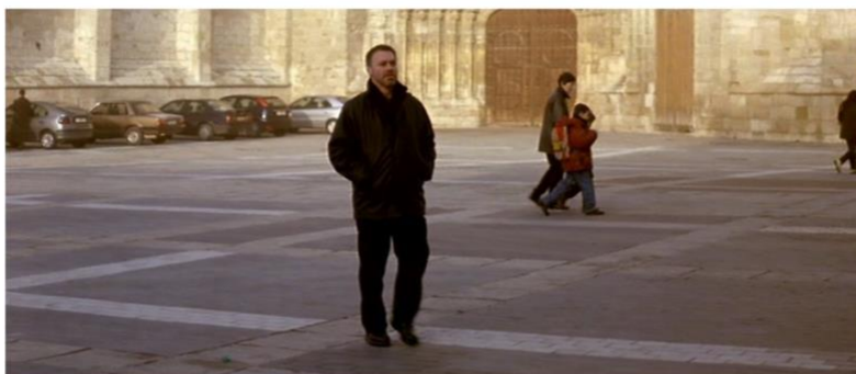
Imagen 27. Escena de la película Plenilunio.

Esta película dirigida por Imanol Uribe se estrenó en el año 2000, y fue rodada en la provincia de Palencia. Está protagonizada por Miguel Ángel Solá y Adriana Ozores, y trata sobre un inspector de policía destinado a una pequeña ciudad para investigar un asesinato. Entre sus localizaciones encontramos la catedral, el hospital San Luis, la Iglesia de San Miguel o la Calle Mayor.