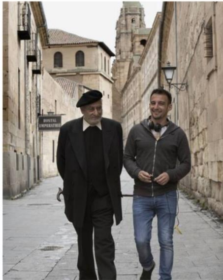
Imagen 29. Fotografía tras el rodaje de Mientras dure la guerra .

Mientras dure la guerra es una producción de Alejandro Amenábar del año 2019. Entre sus protagonistas, encontramos a los actores Karra Elejalde o Inma Cuevas, que reviven la historia del escritor Miguel de Unamuno. La película se sitúa en el año 1936, cuando Unamuno decide apoyar públicamente al bando de los sublevados. En ese momento, el bando republicano lo destituye como rector de la Universidad de Salamanca. Posteriormente ocurren una serie de hechos que hacen al protagonista replantearse su ideología.