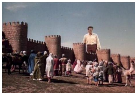
Imagen 18. Película Los viajes de Gulliver.