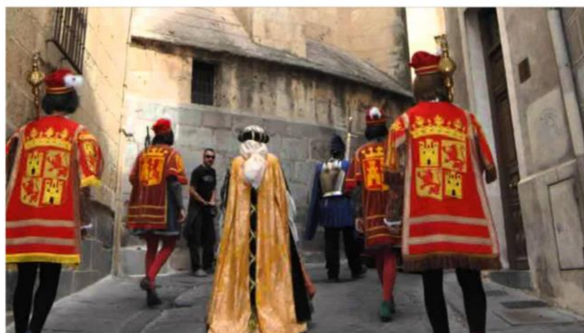
Imagen 13. Ruta turística "Isabel en Segovia".

Es cierto que en la serie podemos apreciar localizaciones de otras comunidades autónomas como Castilla-La Mancha, Extremadura o Andalucía, protagonistas también en la vida de la Reina Isabel, pero Castilla y León ha sido la que más ha aprovechado la oportunidad que le brindaba la producción televisiva para explotar su oferta turística. Además, podemos observar en esta serie localizaciones de las provincias de Ávila, Segovia y Valladolid. Son numerosas las rutas creadas en Castilla y León acordes a la monarca, entre ellas la ruta "Isabel en Segovia", "Ávila Isabelina", "Caminos de una reina" en Medina del Campo, "Ruta de Isabel La Católica" en Valladolid, y, por último, "Ruta de Isabel en Castilla y León" organizada por la Junta de Castilla y León.