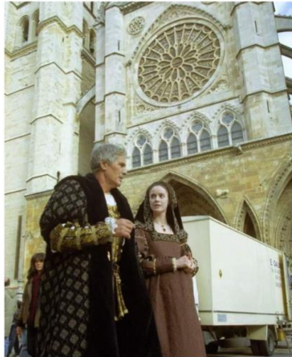
Imagen 31. Escena de Juana la loca en la Catedral de León.

Película dirigida por Vicente Aranda en el año 2001. Tiene entre sus protagonistas a Pilar López de Ayala y a Daniele Liotti. Esta historia, rodada en la Catedral de León y sus alrededores del casco histórico, cuenta la vida de Juana, hija de los Reyes Católicos, y su matrimonio con Felipe el Hermoso.