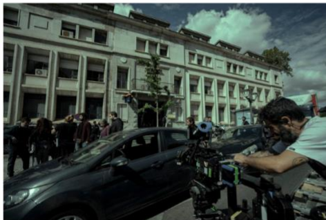
Imagen 20. Imágenes del rodaje de Memento Mori.

Hace cinco años comenzó a realizarse una visita teatralizada por la ciudad con la temática de la novela policíaca. Con el estreno de la serie de televisión, se ha reavivado esta actividad por la ciudad de parte de la Valladolid Film Commission y el Ayto. de Valladolid. Las visitas se realizan cada semana y tienen una capacidad máxima de 35 personas. Prácticamente tiene un aforo completo hasta su finalización que, en principio, está prevista hasta después de Semana Santa.