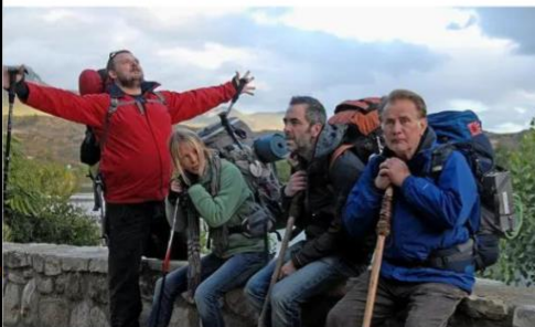
Imagen 32. Escena de la película The Way.

Película protagonizada por Martin Sheen y Deborah Kara Unger. Se estrenó en el año 2010 de la mano del director Emilio Estévez. Cuenta la historia de Tom, un padre que perdió la relación con su hijo muchos años atrás y que, un día, recibe una llamada en la que le comunican que su hijo ha fallecido en los Pirineos. Tom viaja a Francia y allí descubre que su hijo estaba realizando el Camino De Santiago, así que el protagonista decide terminarlo en su honor. En esta producción se recorren municipios de las provincias de Burgos, Palencia y León. De esta última, aparecen la ciudad de León, El Ganso, Cruz de Ferro, Manjarín y Albergue de Molinaseca.