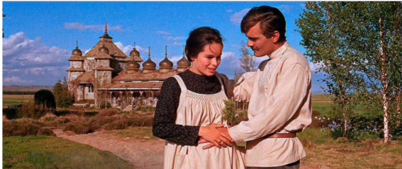
Imagen 22. Escena de Doctor Zhivago rodada en Soria.

Dirigida por David Lean en 1965, esta producción de Hollywood fue rodada en España, y utilizó varias localizaciones de la ciudad y la provincia de Soria durante su rodaje, debido a que las autoridades rusas no permitieron rodarla en su país. La película está ambientada en Rusia y trata la historia de amor del protagonista: Yuri Zhivago. Los cineastas eligieron Madrid y Soria para sus rodajes. Como Soria no ofreció ninguna de sus espectaculares nevadas de la época, tuvieron que utilizar diversos productos para simularla. Algunas de las localizaciones sorianas utilizadas en el rodaje fueron La Estación de Cañuelo de Soria, Candilichera, Ólvega de Moncayo, Villar del Campo y el Pantano de la Cuerda del Pozo