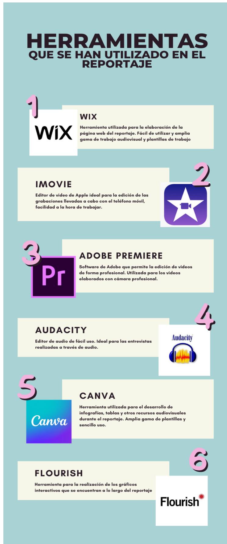
Gráfico 2. Herramientas utilizadas en la realización del Reportaje Multimedia: Las consecuencias de la desaparición de la minería en la provincia de Palencia.