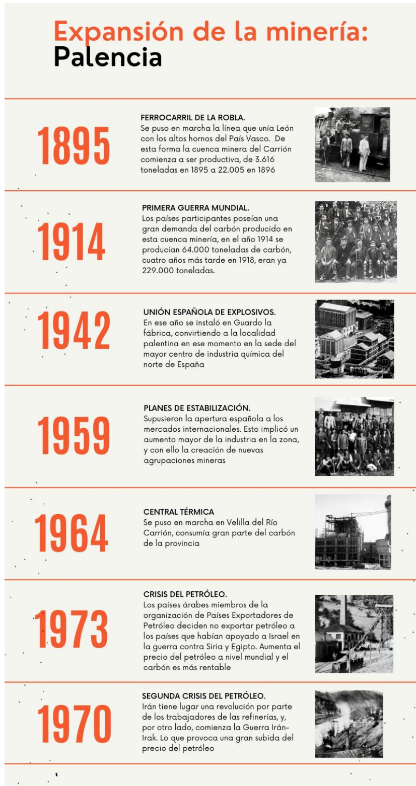
Figura 1. Infografía de la evolución cronológica del desarrollo de la minería en la cuenca del Carrión.