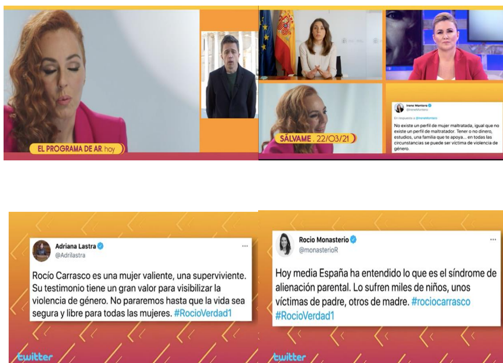
Imagen 12. Personalidades famosas y de la política que han mostrado su apoyo al testimonio de Rocío Carrasco emitido el 22-03-2021.