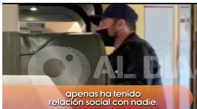
Imagen 2. Imagen de recurso de Antonio D. Flores emitida 22-03-2021