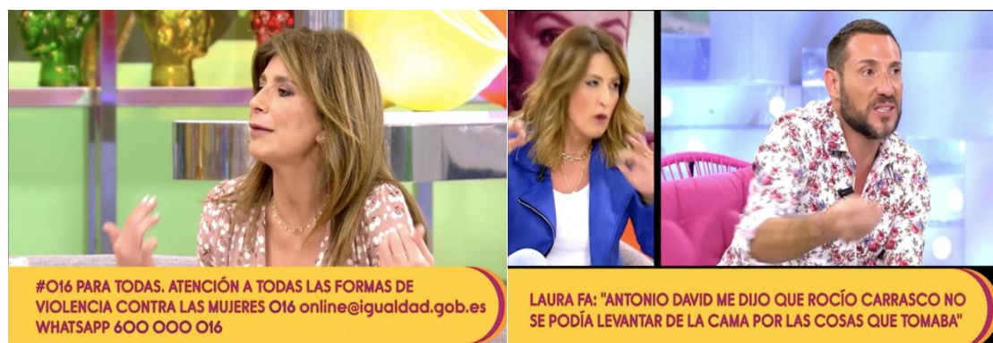
Imagen 9. Ejemplo de rótulo informativo emitido el 22-03-2021