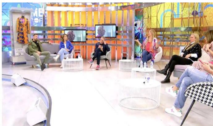
Imagen 1. Plató de Sálvame. Imagen emitida el 22/03/2021