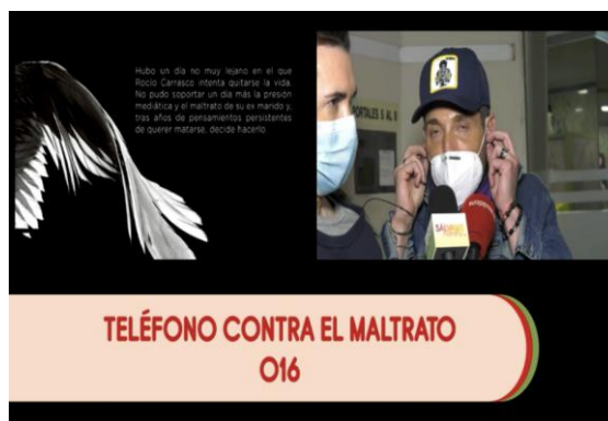
Imagen 10. Declaraciones de Antonio David Flores junto a un rótulo sobre el teléfono contra el maltrato emitido el 17-03-2021.