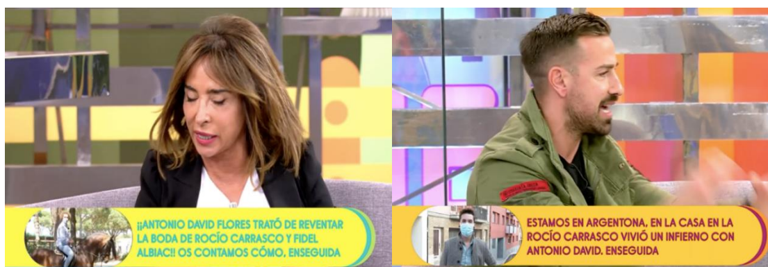
Imagen 8. Ejemplos de rótulos que incitan a seguir viendo el programa emitido el 4-05-2021.

Con respecto a los rótulos (Tabla 5), la mayoría tienen el propósito de cebar el programa y que la audiencia continúe viendo el programa (Imagen 8), pero también hay algunos que informan sobre, por ejemplo, a qué teléfono pueden llamar las mujeres que sufran violencia de género (Imagen 9), y otros recogen declaraciones (Imagen 10), bien de fuentes, de los colaboradores o de la propia Rocío Carrasco en el documental. Los rótulos contribuyen a generar ese juicio paralelo y a vulnerar la presunción de inocencia de Antonio David. En ocasiones el rótulo no solo se refiere a las declaraciones o los hechos, sino que también los califica: “brutal episodio”.