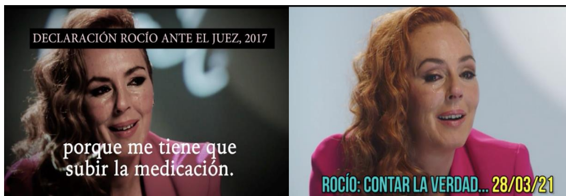
Imagen 7. Recursos audiovisuales de Rocío Carrasco emitidos el 13-04-2021 y 29-03-2021