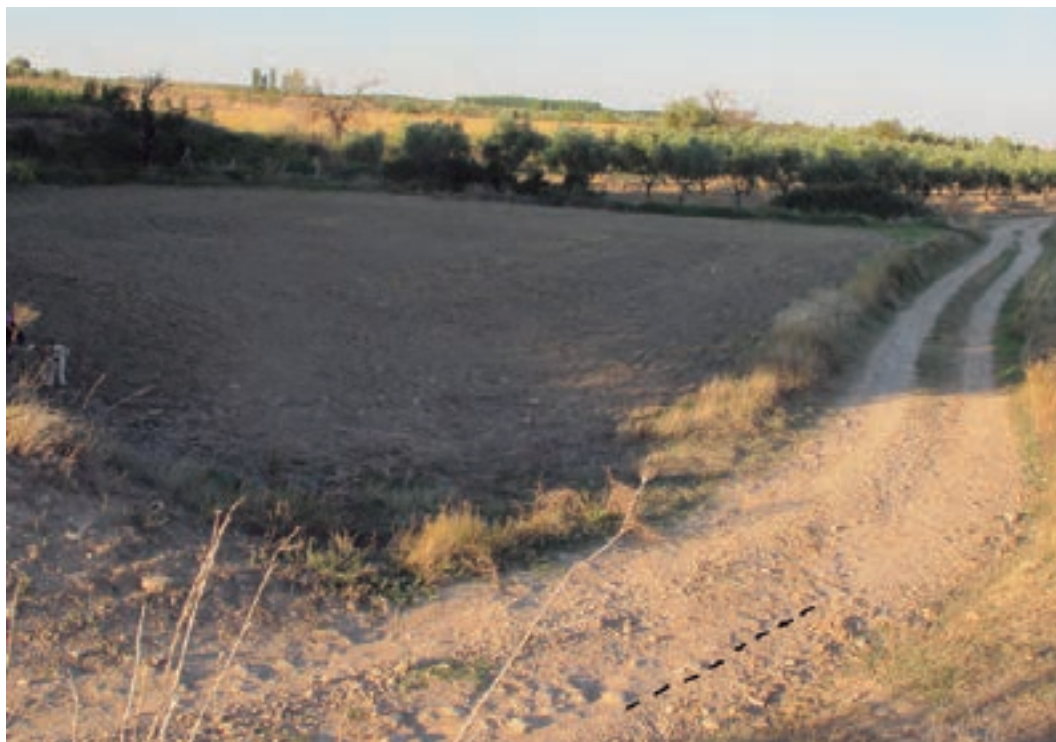
2. Lugar del hallazgo cerca del yacimiento La Torraza II, se ha señalado el posible muro que se intuye en el camino.

el Lombo VII el más próximo, a una distancia de 440 metros. 8