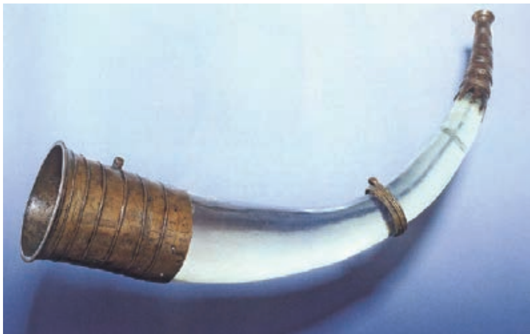
3. Trompa de Wismar, Alemania. Archäologische Landesmuseum Mecklenburg-Vorpommern. Joachim SCHWEEN, «Luren Und Irische Hörner...», ob. cit. , fig. 3.

boquilla en la que se insertaría un cuerno de animal. La forma interior de tendencia troncocónica y el borde aserrado que presenta la zona distal a la boquilla así lo sugieren. Este peculiar diseño forma parte del sistema de fijación al cuerno que estaría insertado y sujeto por dos remaches para garantizar que no se desprendiera. Además, los dientes generados por el borde aserrado, abollados hacia adentro, proporcionan un agarre mucho mayor a su superficie. Probablemente se debió de tratar de un cuerno de toro o de vaca al que le cortaron la punta maciza para aprovechar la parte hueca como conducto de resonancia. Su portabilidad queda ratificada por la anilla, soldada a la boquilla de bronce. Debemos suponer que en la zona opuesta, la más ancha del cuerno, llevaría un aro a modo de abrazadera con otra anilla. Entre ambas se sujetaría un cordón de materia vegetal, cadena metálica o más