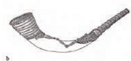
4. Trompa de Barva, Suecia. Swedish Historical Museum, n. inv. 870093: 4a. Ben WAGGONER, Diana PAXSON y Kveldulf GUNDARSSON, Heathen Garb and Gear: Ritual Dress, Tools, and Art for the Practice of Germanic Heathenry , Philadelphia, The Troth , 1987, p. 332. 4b. Cajsa LUND, «The “phenomenal” bronze lurs...», ob. cit. , p. 27, fig. 15.

del Musée des Antiquités Nationales de Saint Germain en Laye (inv. 14451). Fue hallado durante la campaña de excavaciones ordenada por Napoleón III en el bosque de Compiègne, en 1862. 16 Aunque se desconoce el contexto preciso de este hallazgo en cuestión, los materiales