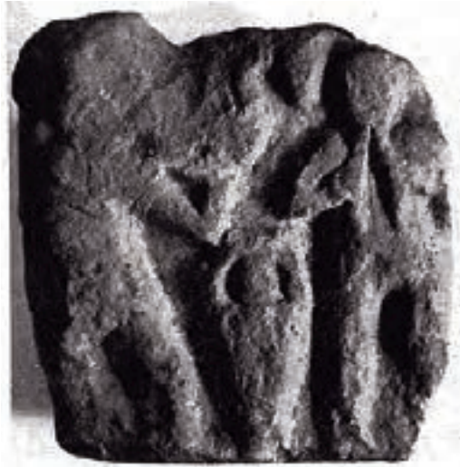
8. Detalle de la caja funeraria de Torredonjimeno (Jaén). Rafael GARCÍA SERRANO, «Dos piezas...», ob. cit. , fig. 1.