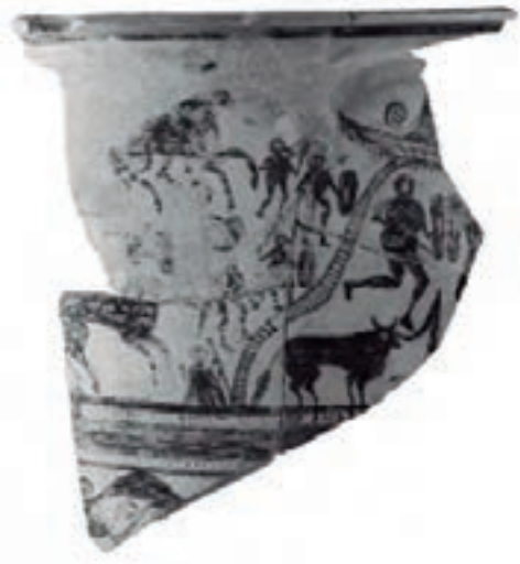
9. Fragmento de cerámica del Castellillo de Alloza. María de las Mercedes FUENTES ALBERO y Consuelo MATA PARREÑO, «Sociedad de...», ob. cit. , fig. 25.

funeraria aparecida en Torredonjimeno (Jaén) [fig. 8], 21 donde se puede apreciar, a pesar de lo degradado del relieve, un músico tocando una especie de cuerno acompañado por un aerófono de doble lengüeta, posiblemente similar al aulós . Su colocación en torno a un ánfora y el hecho de que quizás esté representada una carrera de carros en otra de las caras puede sugerir el uso de estos instrumentos en banquetes o juegos funerarios con consumo de vino. El segundo ejemplar está representado sobre un fragmento de kalathos del poblado ibérico del Castellillo de Alloza (Teruel) [fig. 9]. 22 Datado en torno a los siglos III-II a. C., un músico con un instrumento, que