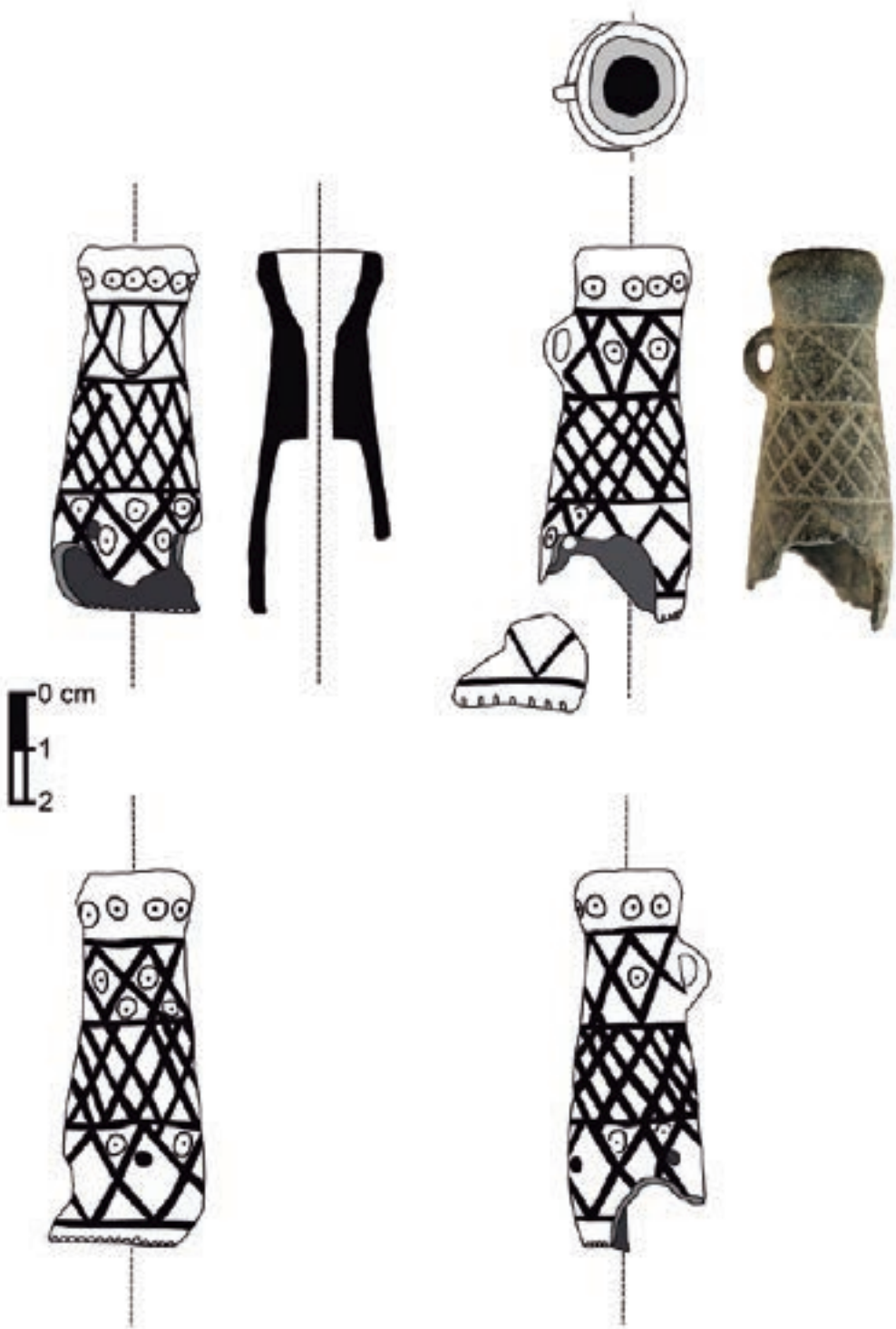
1. Dibujo y fotografía de la pieza estudiada.