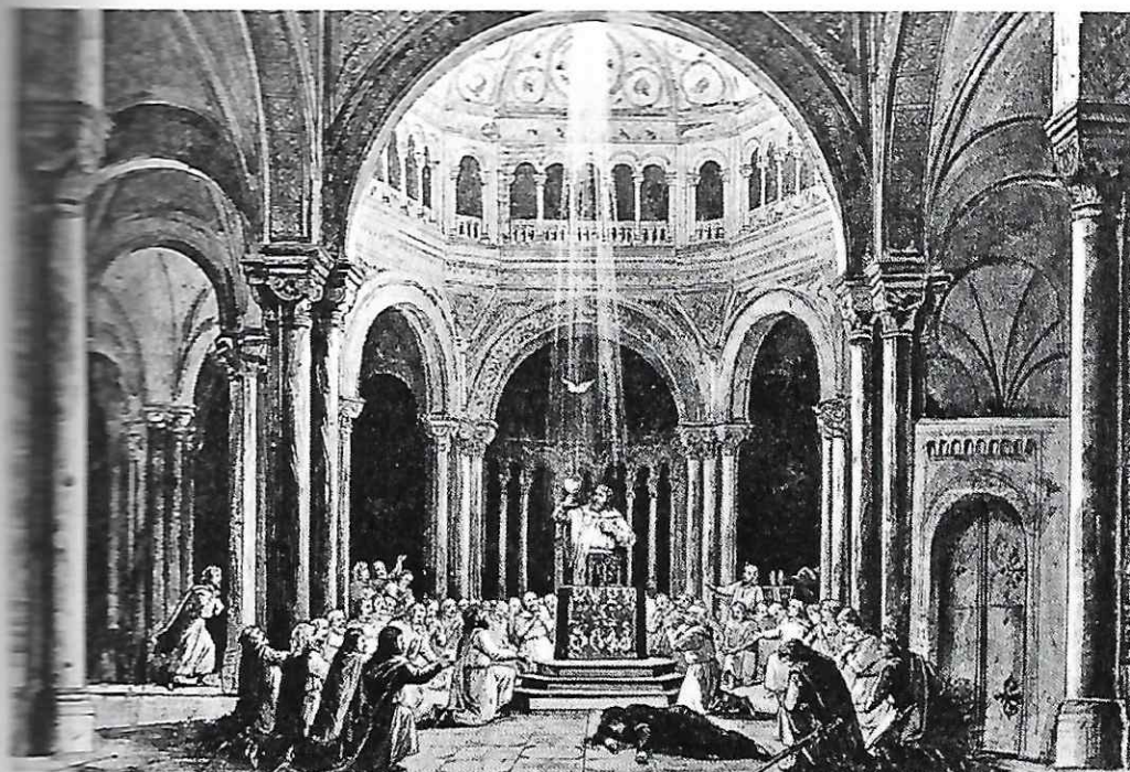
"Parsifal". Escena de Joukowsky y Brückner, Bayreuth Festspielhaus, 1882 (Theatermuseum de Munich)

idades frecuentemente presumidas en una suerte de recreación popularizada: aquello que podía parecer cierto o similar a lo auténtico ante unos espectadores que contemplaban sobre las tablas acciones desarrolladas en espacios inusitados, tan desconocidos para ellos como para los propios escenógrafos. La falta de datos contrastados se suple con la invención, la sujeción a la verdad no es sistemática y en el pensamiento tanto de los decoradores como de su público el elemento simbólico, fruto de una visión estereotipada de la realidad, deviene norma fundamental. Se van acumulando, de esta suerte, criterios interpretativos contemporáneos adheridos a los argumentos históricos según un proceder detectable en el dominio de otras artes: «copiare il vero può essere una buona cosa, ma inventare il vero è meglio, molto meglio» escribirá Verdi en una carta a su amiga la condesa Clarina Maffei 59 .