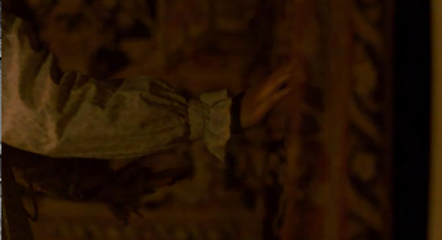
Figuras 9 y 10

que dibujan ese horizonte de satisfacción plena, ese horizonte de puro goce absoluto, goce demoníaco/divino, sobre el que las protagonistas anhelan saber, incluso más allá del hombre amado.