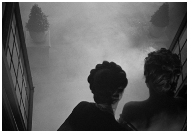
Figuras 11 y 12

Empujadas por esta pasión escópica, por esta pasión de saber sobre un goce secreto del que —sospechan— la Otra sabe, las dos protagonistas cruzan la puerta de la habitación prohibida.