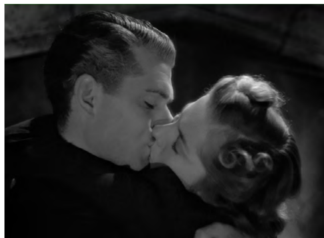
Figuras 5 y 6

tal y como se pone en escena por medio de la fantástica historia que la niña Adèle, hija francesa de Rochester, le cuenta a Jane sobre esa misteriosa mujer-vampiro que habita en el castillo: «Sophie me dijo que había una mujer que paseaba por los pasillos de esta casa de noche. [...] También puede atravesar paredes. Dicen que viene a chuparte la sangre».