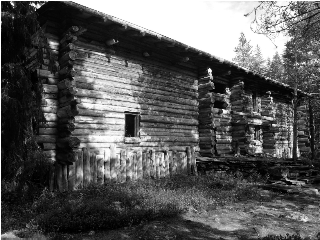
Figura 9. Reima y Raili Pietilä. Museo Särestö, Kaukonen, Kittilä. 1972.