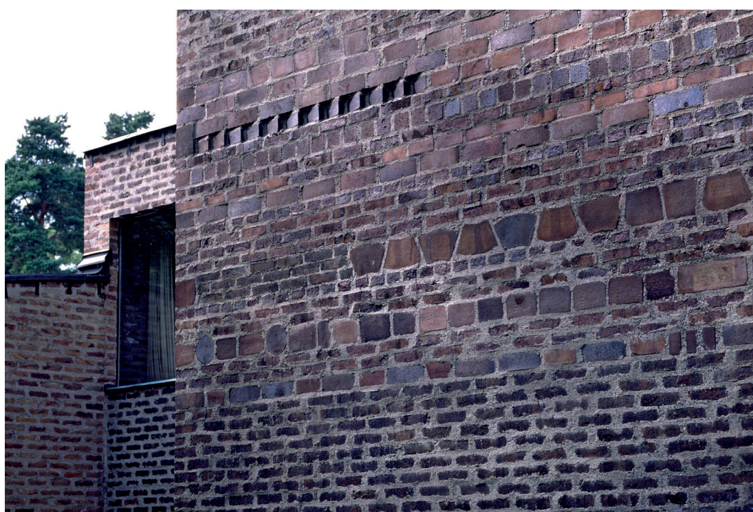
Figura 4. Sigurd Lewerentz. Sankt Markus de Björkhagen. 1955. Detalle.