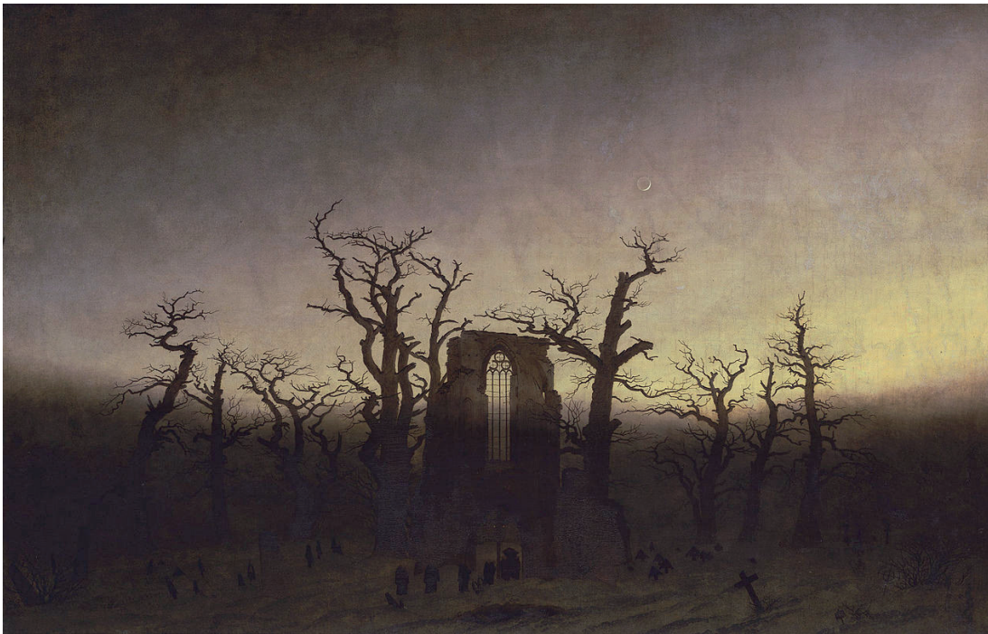
Figura 2. Caspar Friedrich. Abadía en el robledal, 1809