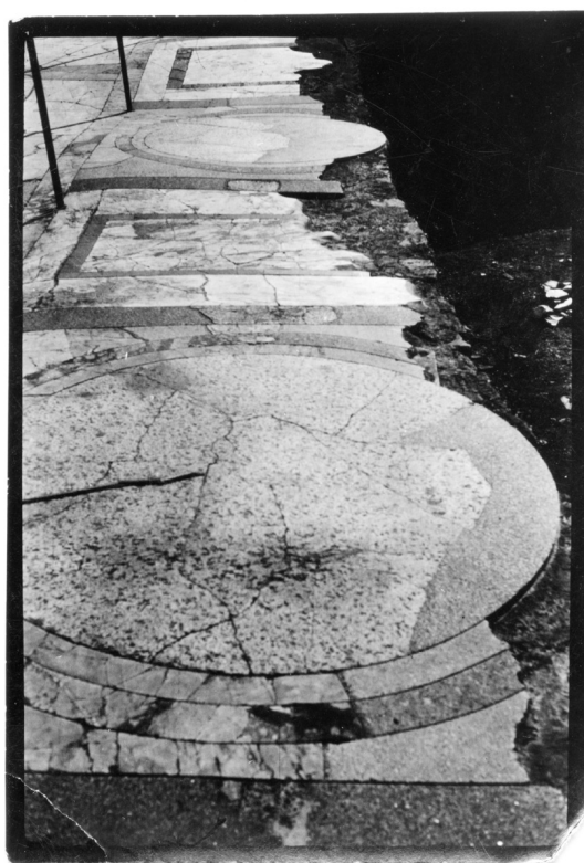
Figure 5. Sigurd Lewerentz. Trip to Italy 1922. Photography.

el muro es la representación no ortodoxa de un lenguaje ortodoxo que tiene su propia coherencia. Es una aproximación a la arquitectura como paradoja de su construcción. Una construcción que parece renunciar a la forma desde un aparente descuido, pero que nos reserva algo oculto que se materializa sin ser completamente revelado. 18 Como expone en este sentido Colin St. John Wilson, recogiendo una sentencia de L. Wittgenstein: "Debes limitarte a decir cosas antiguas, y al mismo tiempo debe resultar algo nuevo."