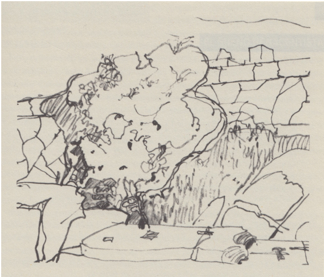
Figura 3. Alvar Aalto. Fragmento del muro de Cíclopes de Delfos. 1953. Apunte.