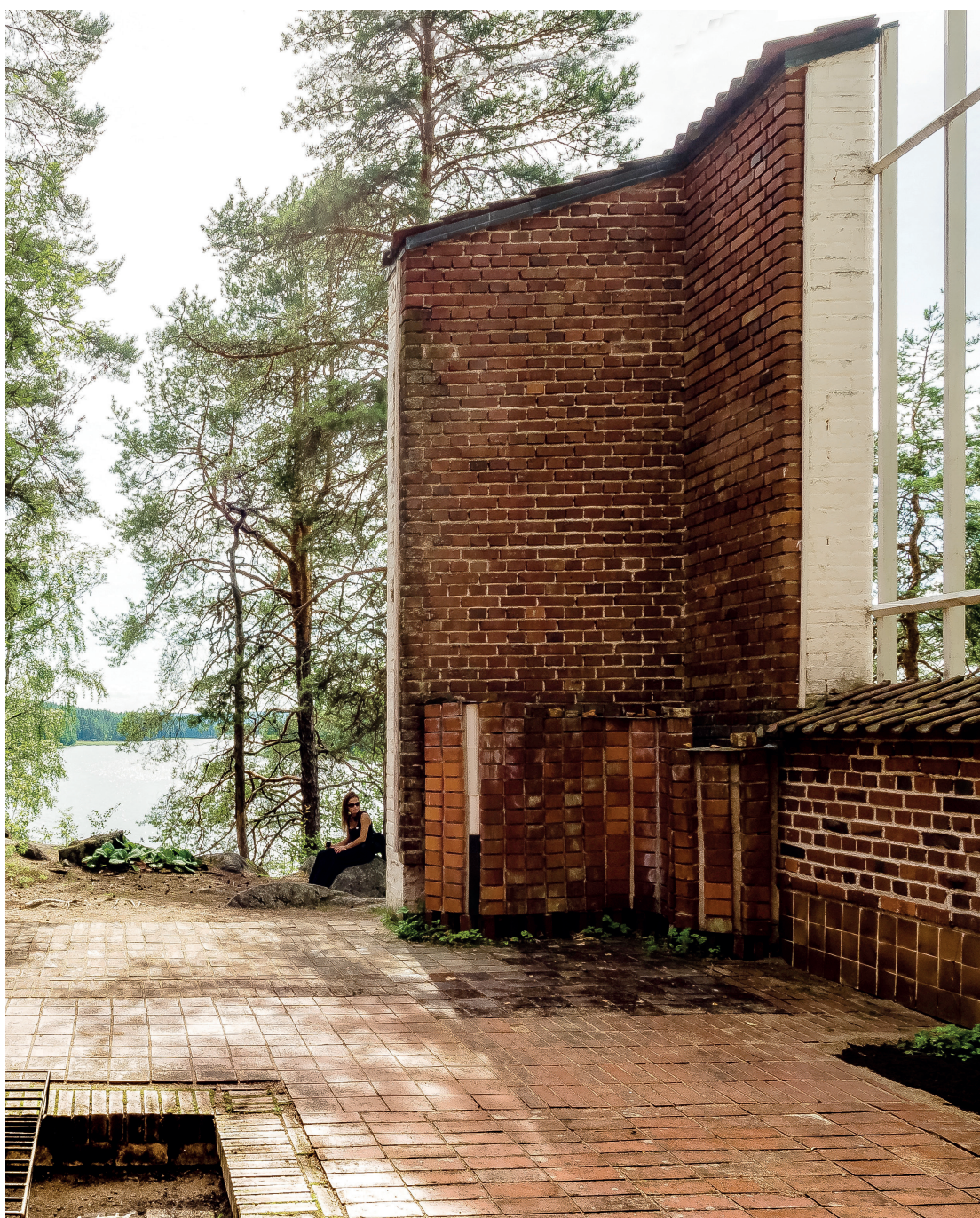
Figura 1. Aalto, Alvar. Casa experimental, Muuratsalo. 1953. Detalle del muro del patio.