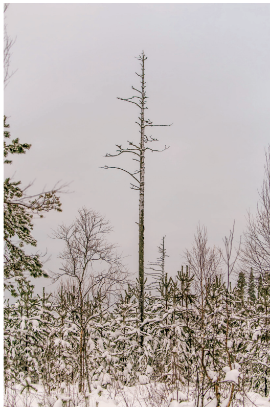
Figure 10. Kelo forest, Finland.

su conformación final, no resulta sencillo adscribir el muro que aparece a ningún momento de la historia de la arquitectura conocido, ni siquiera al de la tradición local. Al igual que ocurre al observar el bosque, estamos ante el rostro de una arquitectura sin edad definida, atemporal, que, aceptando la lógica de lo que la rodea, consigue erigirse como un acontecimiento realmente imperecedero.