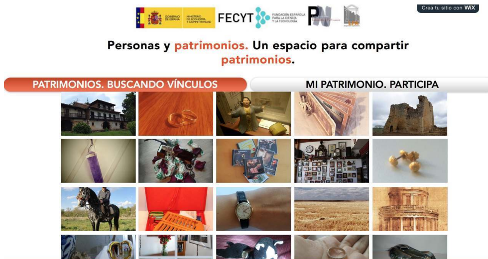
Fig. 1 – Personas y Patrimonios, un espacio para compartir patrimonios, 2016 Fotografías pertenecientes a la página web www.personasypatrimonios.com