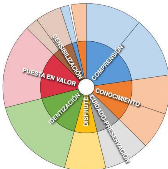
Fig. 2a – Diagrama de sectores comparando los nodos o categorías, 2017 Fuente: Inmaculada Sánchez-Macías, Jesús Cepeda y Olaia Fontal a partir de Nudist*Vivo

emplean más comúnmente las personas para tratar de expresar los vínculos que tienen con un elemento patrimonial. Como se observa a través de los porcentajes en la fig. 3, el nodo de la “identización” (Gómez 2012) es el más abultado, por lo que podemos observar que tendemos a identificarnos con el bien patrimonial que pretendemos enseñar y describir, correspondiendo con la etapa final del proceso de vinculación: