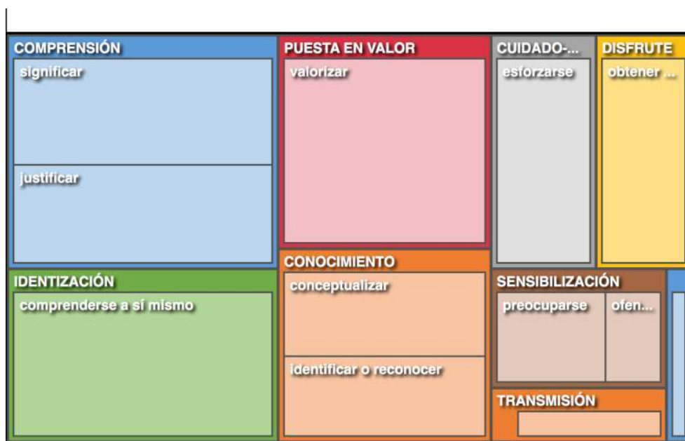
Fig. 2b – Diagrama de sectores comparando los nodos o categorías, 2017