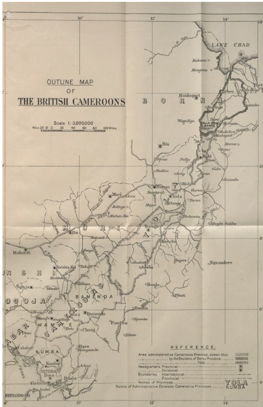
Mapa 3. Camerún británico (1924)