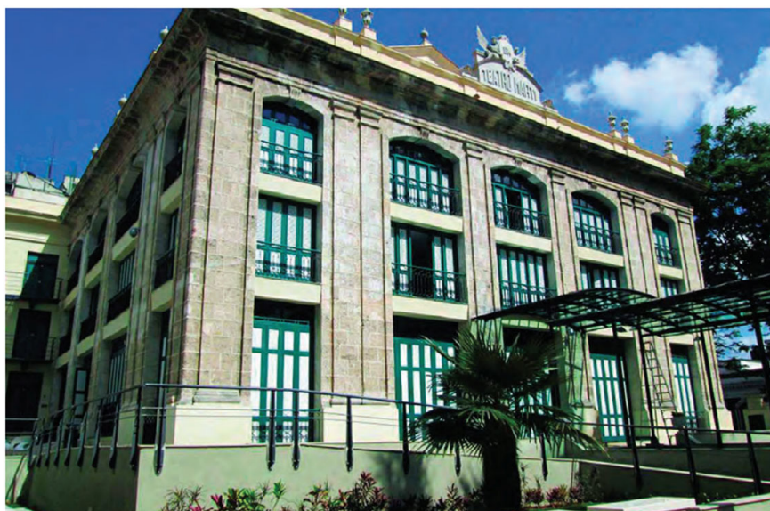
FIGURA 3. Fachada del Teatro Martí (antiguo Irijoa) tras su restauración en 2014.