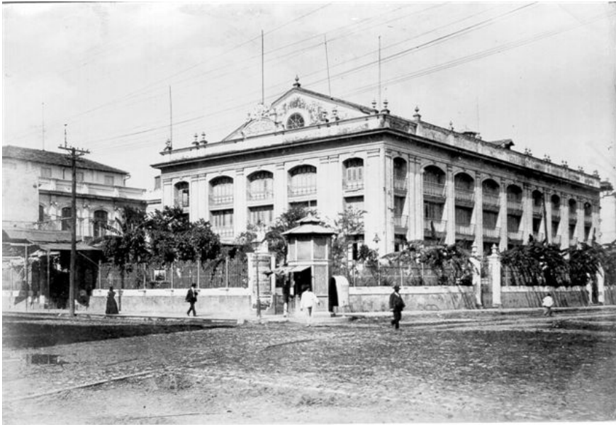
FIGURA 2. Fachada del teatro Martí hacia 1900.