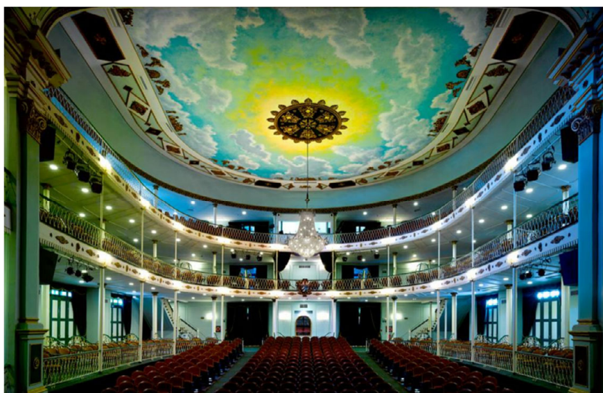
FIGURA 4. Interior del Teatro desde el escenario tras la restauración de 2014.

desarrollo de múltiples actividades vinculadas a su carácter como entorno de celebración social, cualificándolo para albergar expansiones colectivas, lúdicas o no — bailes, piñatas y mascaradas, además de «banquetes, mítines políticos, lucha isleña, esgrima, clases y actividades circenses, entre otros» (González, 2010, p 43)— pero siempre performativas, no ya destinando estancias exprofeso, sino modificando su propia estructura física para tal fin, al ofrecer la posibilidad de transmutar su configuración espacial interior.