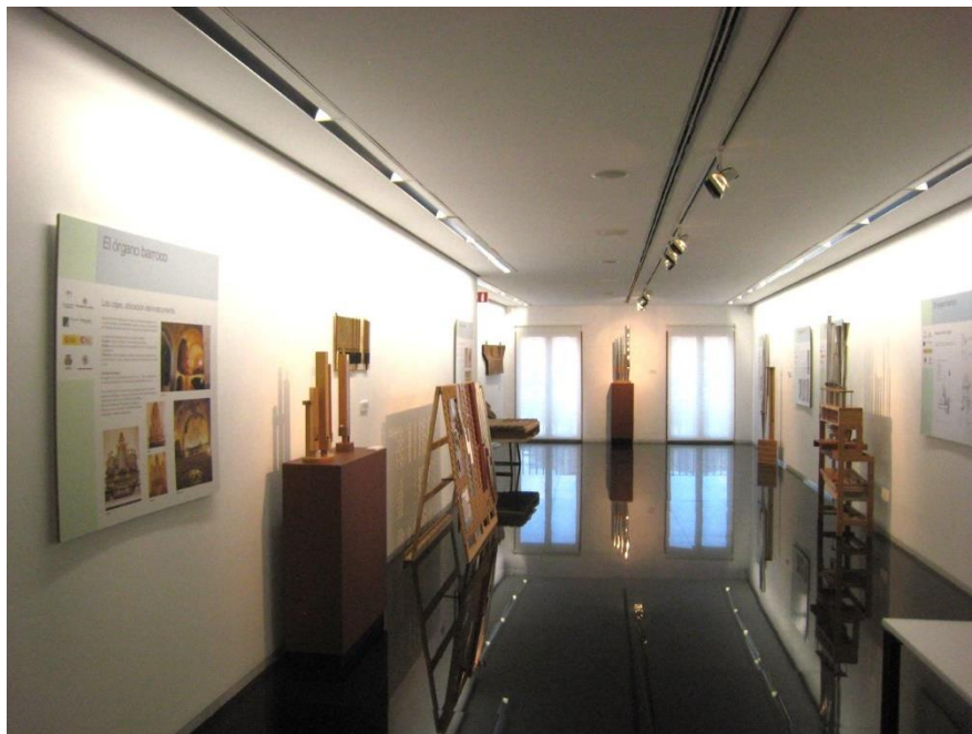
FIGURA 4. Exposición temporal “El órgano barroco en la provincia de Valladolid”, Teatro Zorrilla de Valladolid (2015).