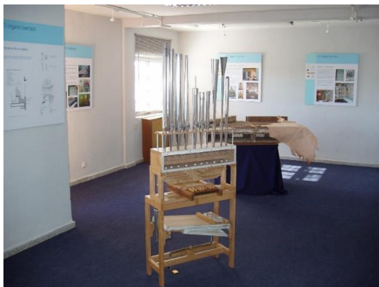
FIGURA 1. Panorámica general de la exposición situada en el CIOBA.

Regional (FEDER), promovió la creación del Centro Iberoamericano del Órgano Barroco (CIOBA), con sede en Medina de Rioseco, cuya gestión estuvo al cargo de los miembros académicos participantes en los convenios, responsables de la supervisión de las restauraciones llevadas a cabo y comentadas en párrafos precedentes. Una de las actividades de dicho Centro fue la creación de una exposición didáctica en el año 2004, establecida en los locales de la sede del CIOBA y que tenía como objetivo difundir el conocimiento sobre el órgano, tanto desde el punto de vista histórico-artístico como técnico-científico. Para ello, se utilizó una variedad de recursos con carácter didáctico, tales como paneles que resumían el proceso de construcción de un órgano en sus elementos más básicos, o bien aludían a las tipologías de cajas de órgano vinculadas al momento histórico-artístico de su implantación, modelos tridimensionales, esquemas y otros apoyos gráficos, piezas, mecanismos y despieces de órganos, etc.