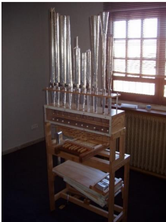
FIGURA 2. Maqueta diseñada y creada expresamente por el Taller de Organería Acitores, S.L. para la exposición del CIOBA.