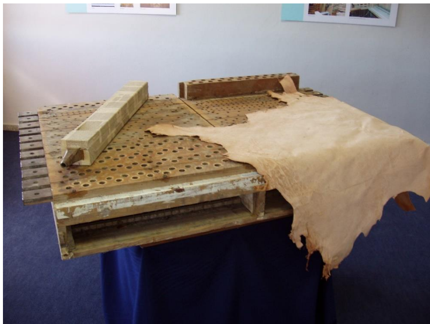
FIGURA 3. Partes de un órgano desmontado (secreto, pieles y tubos). Exposición del CIOBA (Medina de Rioseco).