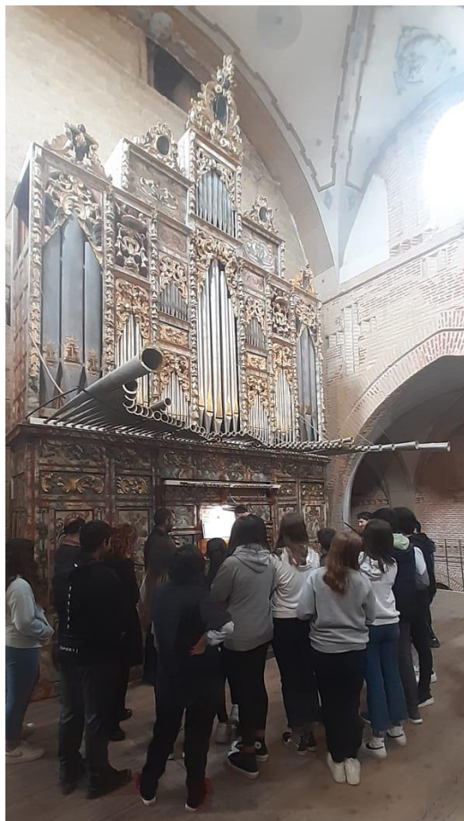
FIGURA 5. Concierto didáctico para alumnos de 2º de la ESO en la Iglesia de San Miguel de Villalón de Campos.

estudiantes, tal como lo demuestran las cartas de agradecimiento dirigidas a la Diputación de Valladolid, entidad principal y patrocinadora de los convenios de colaboración.