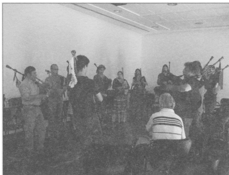
Ilustración 5. Taller de gaita-de-foles organizado por la Associação Gaita-de-Foles y las asociaciones Pé de Xumbo y D'Orfeu. Évora, 3-V-2008.