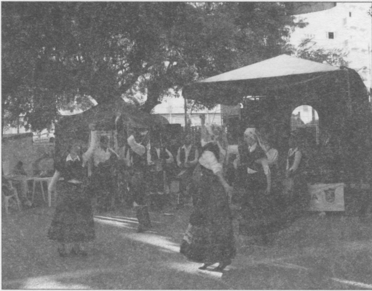
Ilustración 2. Grupo Folclórico Anaquiños da Terra del Centro Galego de Lisboa. Lisboa, 11-VII-2008.