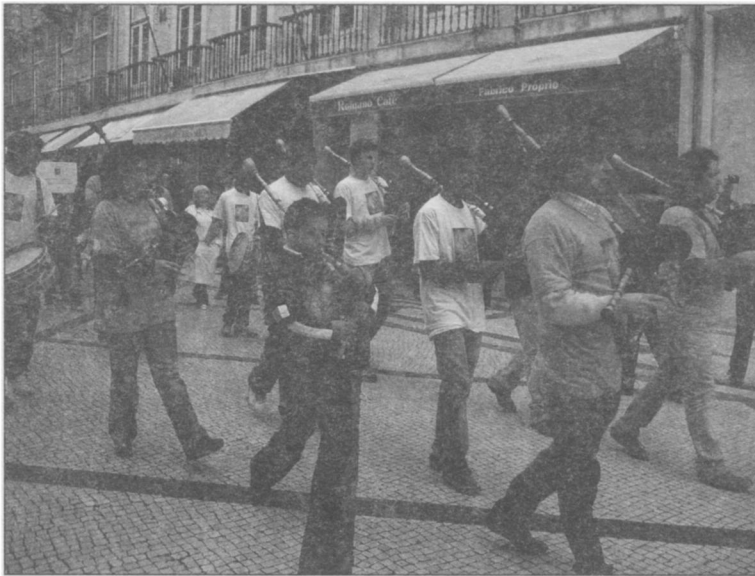
Ilustración 3. Grupo de profesores y alumnos de gaita-de-foles de la Casa Pia de Lisboa. Lisboa, 5-II-2008.