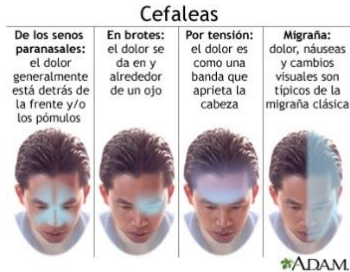
FIGURA 1: ÁREAS DE DOLOR DE LA CEFALEA. (5)

migrañas, no suelen producir náuseas ni vómitos ni empeorar con la luz, olores o la actividad física (5–7).