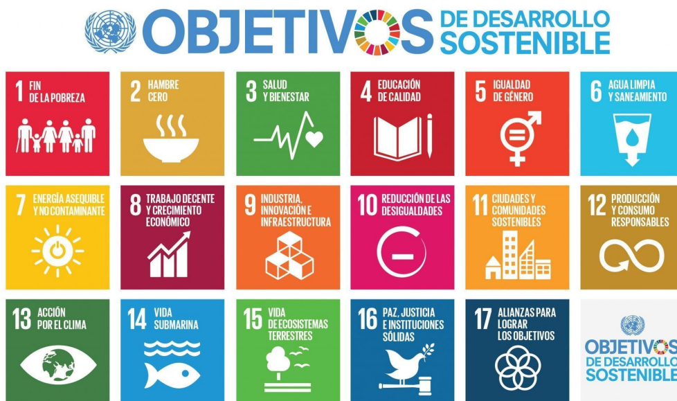
Figura 3: Los Objetivos de Desarrollo Sostenible.

Producido en colaboración con TROLLBACK COMPANY | TheGlobalGoals@trollback.com | +1.212.529.1010 Para cualquier duda sobre la utilización, por favor comuníquese con: @trollbacktroll.org