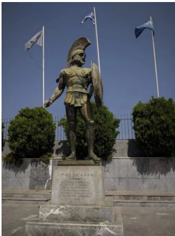
Imagen 4: Estatua de Leónidas