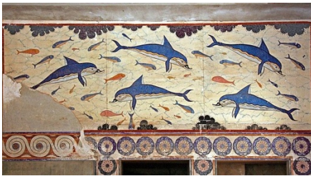
Imágen 1: Fresco de los Delfines, Museo Heraklion