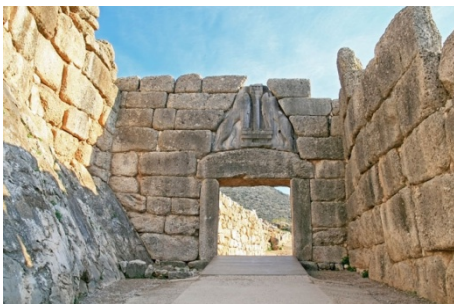
Imagen 2: Puerta de los Leones, Wikipedia