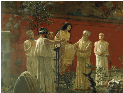
Imagen 5: La Pitia del Oráculo de Delfos