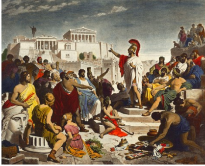
Imagen 3: Discurso fúnebre de Pericles, Wikipedia.