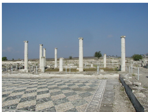
Imagen 8: Sitio arqueológico de Pella