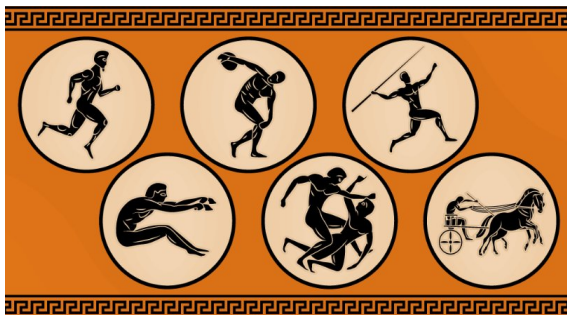
Imagen 6: Disciplinas deportivas de los JJOO