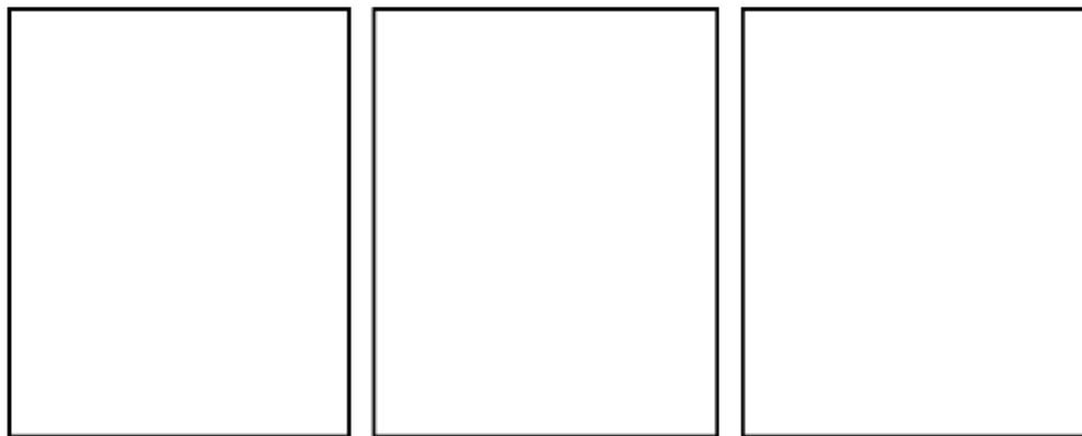
Figura 12. Ficha sesión 7.

Allí hemos visto diferente _____ y _____