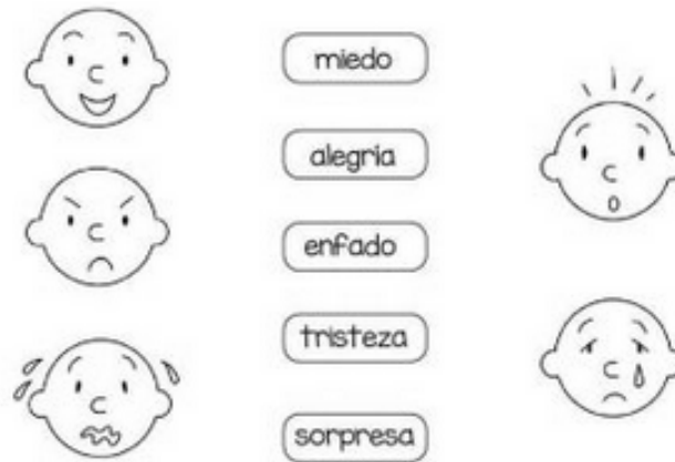
Figura 8. Ficha sesión 3.

Nombre: _____ Fecha: _____ Las _____ son importantes para _____