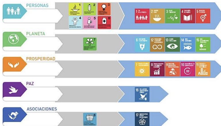
Figura 2. Diferencias entre los ODM y los ODS en base a las 5 “P”.

Sin embargo, los ODM solo abarcaban 3 de ellos: personas, planeta y asociaciones, siendo el eje de las personas el más tratado. Con los ODS se ha buscado tratar más aspectos, reforzando el planeta, y creando dos nuevos ejes que son la prosperidad y la paz.