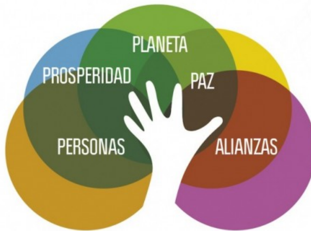
Figura 1. Las 5 “P” del desarrollo sostenible.

Sin embargo, los ODM solo abarcaban 3 de ellos: personas, planeta y asociaciones, siendo el eje de las personas el más tratado. Con los ODS se ha buscado tratar más aspectos, reforzando el planeta, y creando dos nuevos ejes que son la prosperidad y la paz.