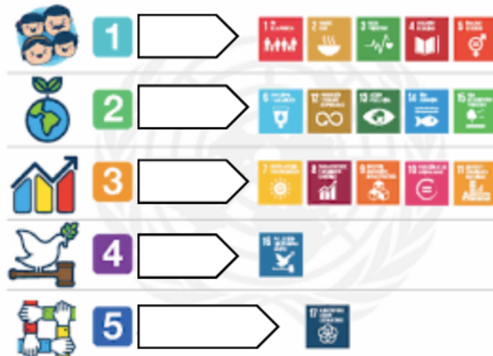
Figura 7. Ficha sesión 2.

Nombre: _____ Fecha: _____ Los _____ se agrupan en _____