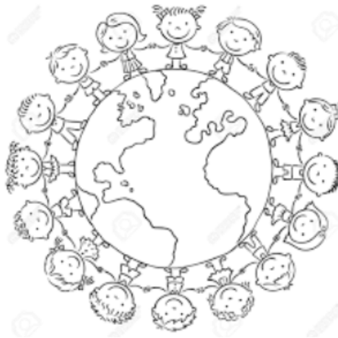
Figura 15. Ficha sesión 13.

Para conseguir _____ debemos estar _____