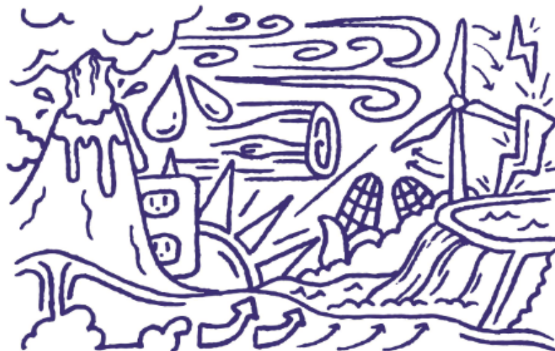
Figura 13. Ficha sesión 9.