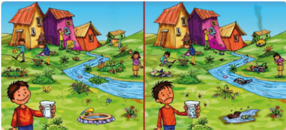
Figura 10. Ficha sesión 6.

Es importante _____ para cuidar el _____