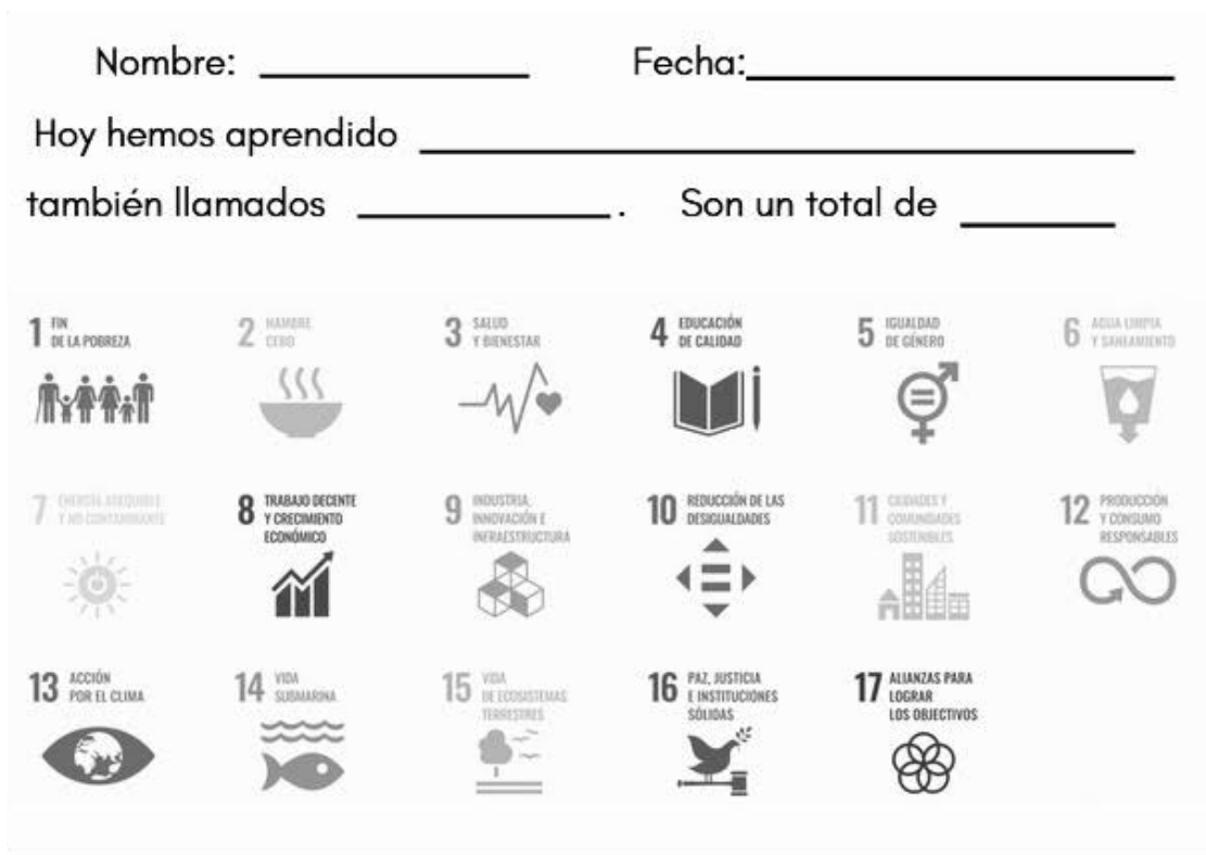
Figura 6. Ficha de la sesión 1.

rellenar la siguiente frase: “Hoy hemos aprendido los Objetivos de Desarrollo Sostenible, también llamados ODS. Son un total de 17”