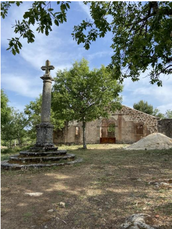
Anexo III: Imagen del cementerio de La Muedra