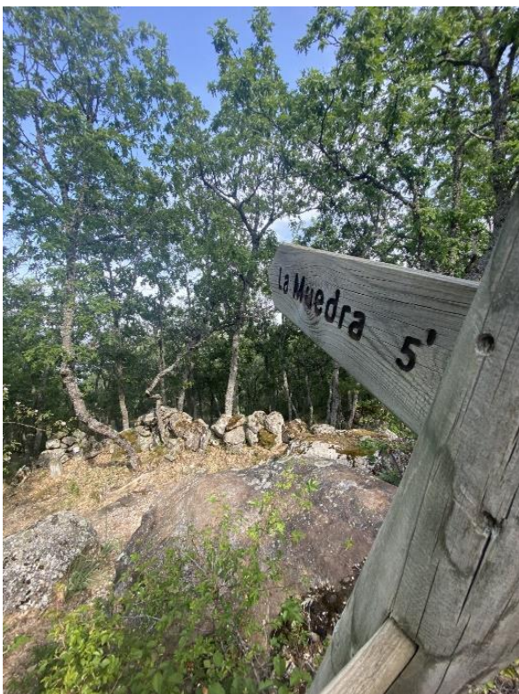
Anexo V: Imagen del cartel que indica la entrada al camino que lleva a La Muedra