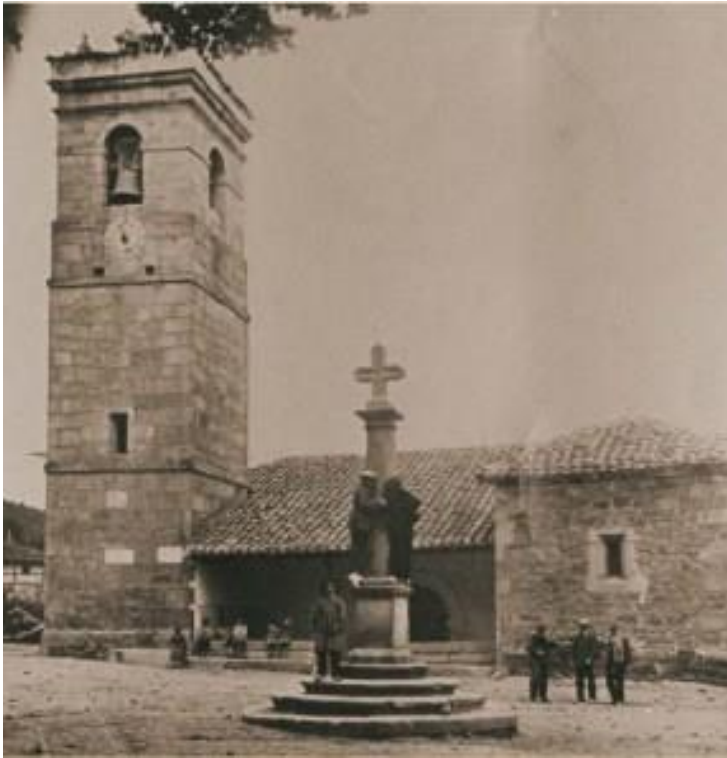
Anexo VI: Imagen de la iglesia de La Muedra antes de la inundación