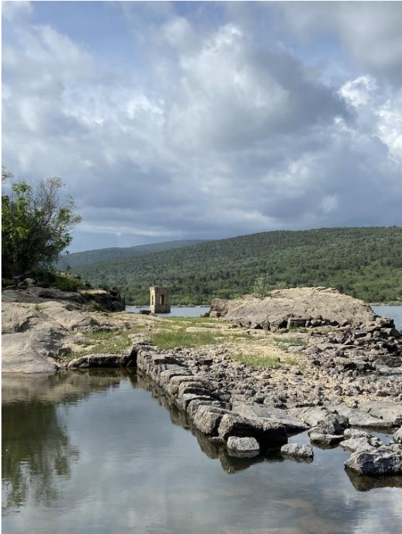
Anexo II: Imagen de los restos de La Muedra