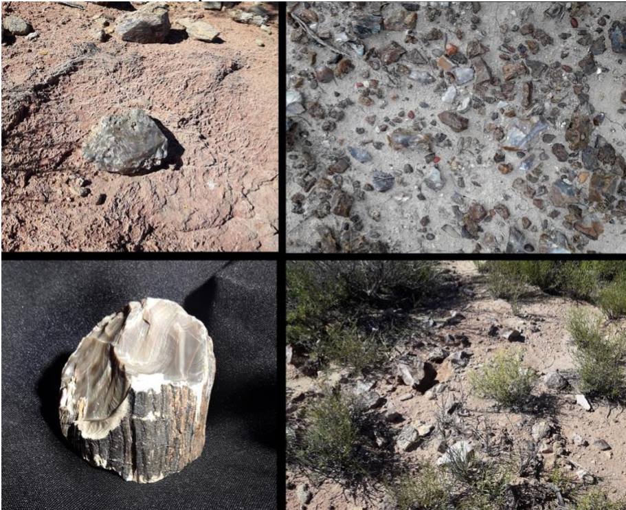
Figura 6. Ejemplos de restos fósiles de troncos utilizados en diferentes yacimientos de la provincia de Río Negro, al sur de la ciudad de General Roca. Abajo a la izquierda se detalla un tronco con evidencias de múltiples impactos para obtener láminas de ópalo.