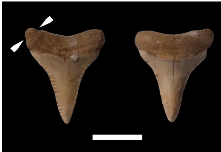
Figura 5. Diente inferior de Tiburón Blanco ( Carcharodon carcharias ) fósil, utilizado como cuenta de collar. Las flechas señalan la modificación hecha en la raíz con la finalidad de atarlo al collar.

Fuente: El ejemplar ha sido publicado por Cione y Bonomo (2003) y procede del Arroyo Nutria Mansa, en los alrededores de Miramar, provincia de Buenos Aires. Fotografías por Mariano Magnussen.