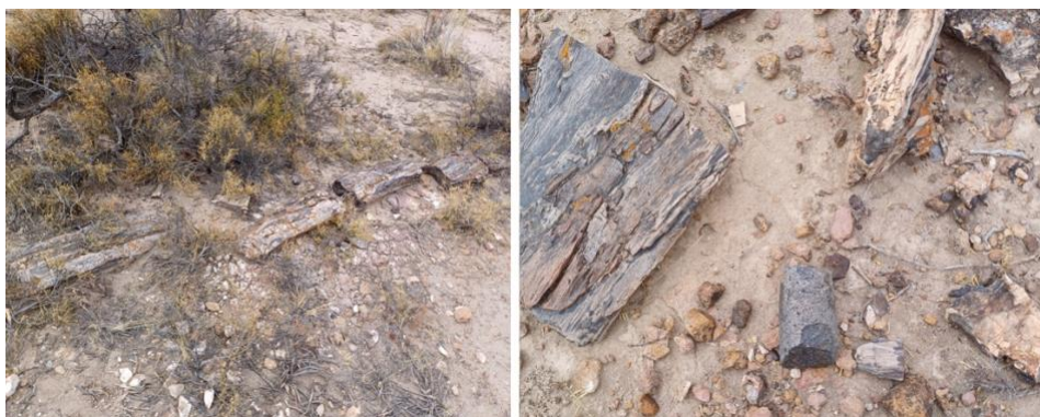
Figura 7. Troncos fósiles en diferentes yacimientos de la provincia de Río Negro, al sur de la ciudad de General Roca. Entremezclados con los troncos se encuentran ocasionalmente instrumentos líticos parciales, como en la foto de la derecha, donde se observa una mano incompleta de mortero. A la izquierda se observan troncos alineados artificialmente.

En territorio patagónico es muy frecuente el hallazgo de troncos fósiles con marcas de haber sido explotados y lascas resultantes de la confección de objetos. Su hallazgo es usual en las mesetas de Río Negro, Chubut y Santa Cruz, sin embargo, no existen referencias etnográficas acerca de la utilización de madera petrificada en Patagonia, ni del posible significado simbólico de los troncos petrificados (Figuras 6 y 7). Tampoco son infrecuentes las puntas de proyectil confeccionadas exclusivamente con ópalo procedente del lascado de madera fósil en las colecciones arqueológicas de Patagonia (Figuras 8 y 9). Como indicamos más arriba, los troncos no fueron los únicos fósiles utilizados para la elaboración de proyectiles y herramientas; restos de cetáceos fósiles tallados, encontrados en la localidad de Punta Casamayor, en la provincia de Santa Cruz, indican