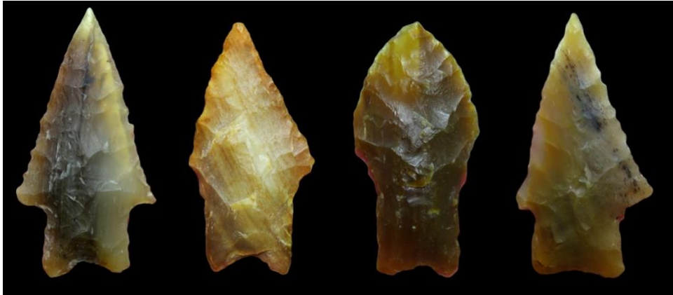
Figura 9. Diversas puntas de proyectil confeccionadas con lascado producto de troncos fósiles procedente de la Patagonia.