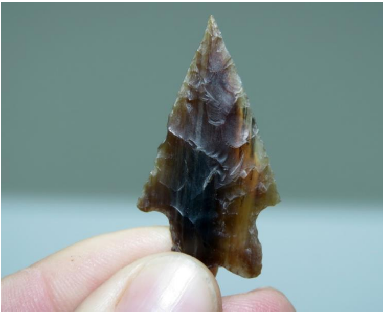
Figura 8. Punta de proyectil confeccionada con lascado producto de troncos fósiles procedente de la Patagonia.