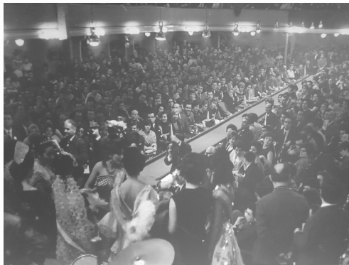
Foto en el actual hall de la entidad del II Concurso nacional de vestidos de Papel en 1967.

Con la reinstauración de la Monarquía, de la mano del régimen franquista reconvertido, llegan los ayuntamientos democráticos. En sus primeros años de gestión muchos ayuntamientos democráticos, particularmente los regentados por alcaldes socialistas, optaron por la municipalización de la cultura popular y la animación comunitaria, en un proceso el éxito del cual, con el tiempo, los analistas de los movimientos asociativos han puesto en tela de juicio 25 .