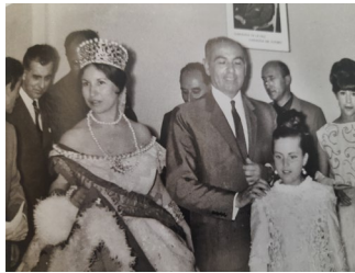
El ministro de Franco José Solís Ruiz agasajado en el teatro de L'Amistat en 1967. Ilustración del libro Mollerussa desapareguda .

Tras la ley de asociaciones de 1964, la asociación objeto de estudio hizo sus deberes y recibió la bendición de sus estatutos de acuerdo con la nueva ley dos años más tarde 21 .