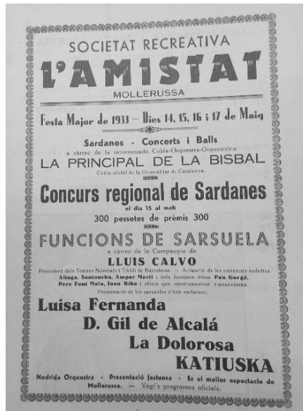
Publicidad de L'Amistat para la Fiesta Mayor de 1923.

Des de la segunda d cada de siglo y la II Rep blica, en L'Amistat se notaban las influencias de las entidades catalanistas 13 . A continuaci n, y tras el golpe fascista de julio de 1936, la entidad fue intervenida y habr a servido por un corto per odo de centro detenci n. A adamos que no queda clara en absoluto la gobernanza de L'Amistat durante la guerra. Alg n investigador insin a que se transform  en Ateneo Popular.