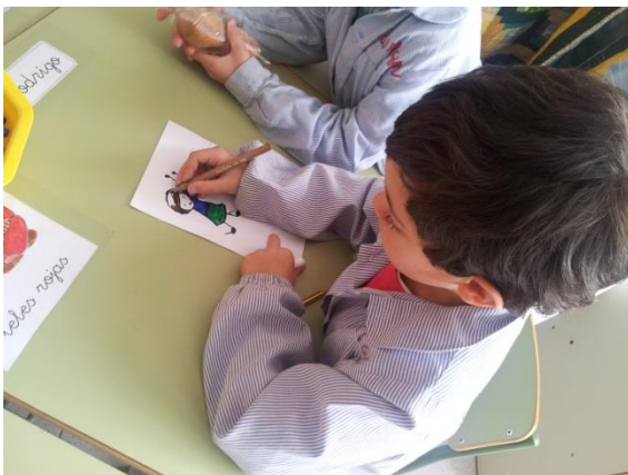
Ilustración 1: alumno pintando el dibujo.