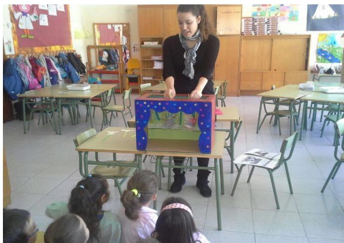
Ilustración 5: contando el cuento con el teatrillo.

Después de trabajar estas preguntas, con la ayuda del teatrillo y de las marionetas se lo dejaremos a los niños y ellos intentarán contar el cuento otra vez, poniendo en práctica el valor de la perseverancia.