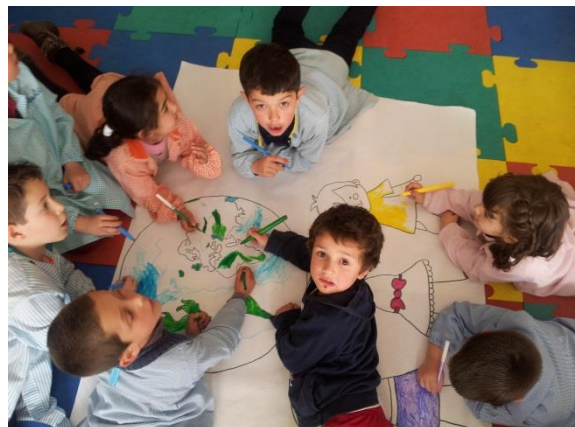
Ilustración 2: pintando el mural.