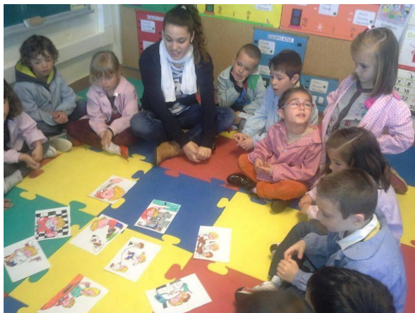
Ilustración 3: observando las secuencias del cuento.

Sesión 3: “Amigos, siempre, amigos” (anexo 4) Este es el título del tercer cuento, a continuación se trabajará el valor de la amistad, se acercarán un poco más al manejo de las TICs motivándoles para crear un cuento interactivo.