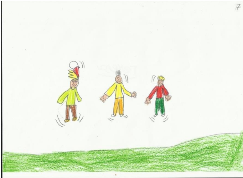
Ilustración 4: dibujo realizado por alumnos de la séptima secuencia.

Una vez realizado el cuento, se acomodará en la pizarra digital y entre todos se va leyendo recordando las características del valor de la amistad, respetando los turnos de palabra.