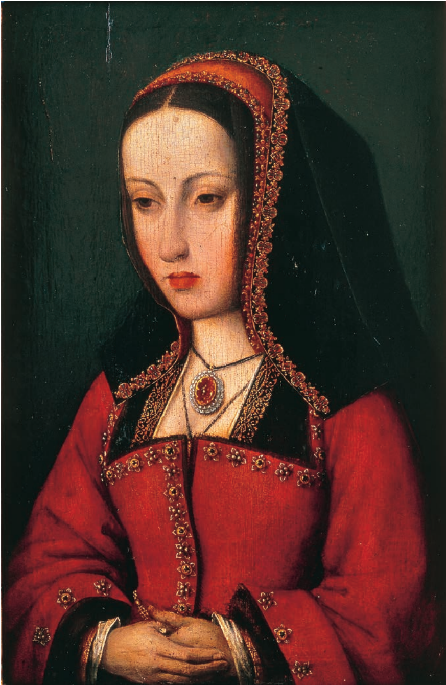
Fig. 3. Juana I. Maestro de la vida de José o de la abadía de Afflighem (atr.). Óleo sobre tabla, 34,7×22,4 cm. Valladolid, Museo Nacional de Escultura.