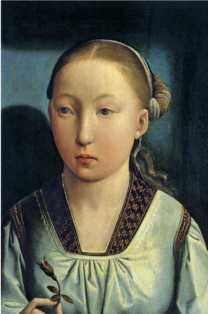
Fig. 7. ¿Catalina de Aragón? Juan de Flandes. Óleo sobre tabla, 32×22 cm. Madrid, Museo Thyssen-Bornemisza. Foto: Dominio público. Wikimedia.org.

un año antes necesitase una cantidad considerablemente inferior, pues Catalina debía desplazarse por mar con una importante armada. No obstante, las partidas destinadas al ajuar fueron muy cuantiosas, y hay objetos de gran valor que no se compraron, sino que salieron directamente del tesoro materno, como «vn confitero grande alto de plata dorado labrado de synzel e maçonerya que tiene en medio del vn esmalte con las armas de Valençia», que pesó más de ocho kilos