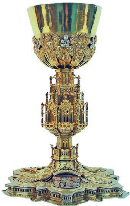
Fig. 5. Cáliz con las armas de Juana I. Bernardino de Porres. c. 1496. Plata dorada y en su color, fundida, cincelada y grabada. Aplicaciones de esmalte rojo y negro en el escudo, 26×17×11 cm. Ampudia (Palencia), Museo de Arte Sacro.

objetos que un considerable elenco de artífices realizó en plata, oro y pedrería. De hecho, no todas las joyas estaban a punto para iniciar el viaje con la reina a Portugal. Su camarera, Aldonza Xuárez, permaneció varios días en Granada recibiendo diversas piezas, y semanas después de que la reina se encontrara con Manuel I llegaron más joyas. Cadenas, collares, cintas de ceñir, ajorcas, copas..., conformaron un tesoro que no solo se fundamentó en piezas de nueva hechura. De algunos personajes como el cardenal-arzobispo de Sevilla, Diego Hurtado de Mendoza, o el duque del Infantado se compraron piezas, y otros como el adelantado de Murcia, Juan Chacón, hicieron donación de algunos objetos. Asimismo, Isabel la Católica ordenó que se tomaran de su tesoro diversas cosas, y lo hizo durante tiempo, pues un año después de haber partido seguía enviando joyas. Al final,