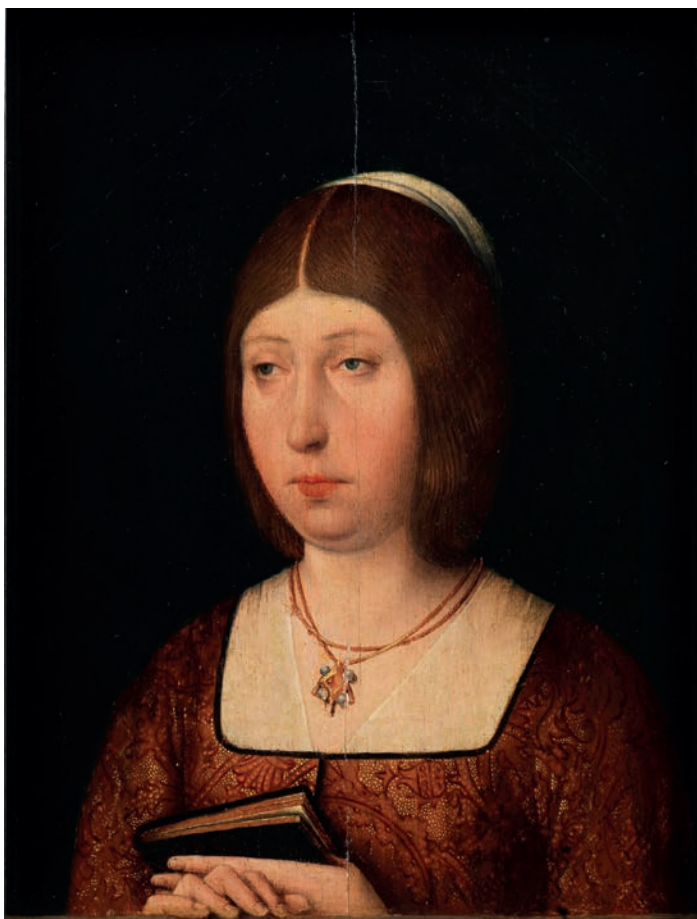
Fig. 1. Isabel la Católica. Anónimo. c. 1490. Óleo sobre tabla, 21 × 13,3 cm. Madrid, Museo Nacional del Prado.

Isabel la Católica mostró su agrado al regreso de su primogénita, pero quiso mantener los lazos con Portugal y ofreció a su segunda hija, Juana, nacida en 1479, como esposa del príncipe Alfonso 3 . Los deseos de la reina no se satisficieron, por la edad de la infanta, que aún no había cumplido cuatro años, y sobre todo porque era la tercera en la línea de sucesión. Al final el matrimonio se celebró entre la primogénita de los Reyes Católicos y el príncipe Alfonso en