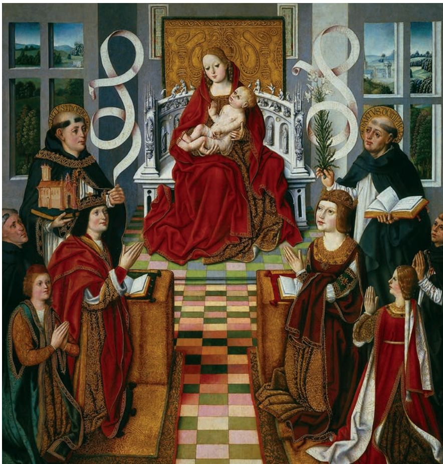
Fig. 2. Virgen de los Reyes Católicos . Maestro de la Virgen de los Reyes Católicos . c. 1491-1493. Técnica mixta sobre tabla, 123×112 cm. Madrid, Museo Nacional del Prado.

procuró solucionar. Apenas dos años después de enviudar, Manuel I volvió a casarse con una infanta española, María, la tercera hija de los Reyes Católicos. Nacida en 1482, había sido propuesta como esposa al rey luso ante la negativa de su hermana mayor a contraer nuevas nupcias 8 , pero la infanta aún era una niña y los portugueses preferían a doña Isabel. La muerte de esta hizo retomar