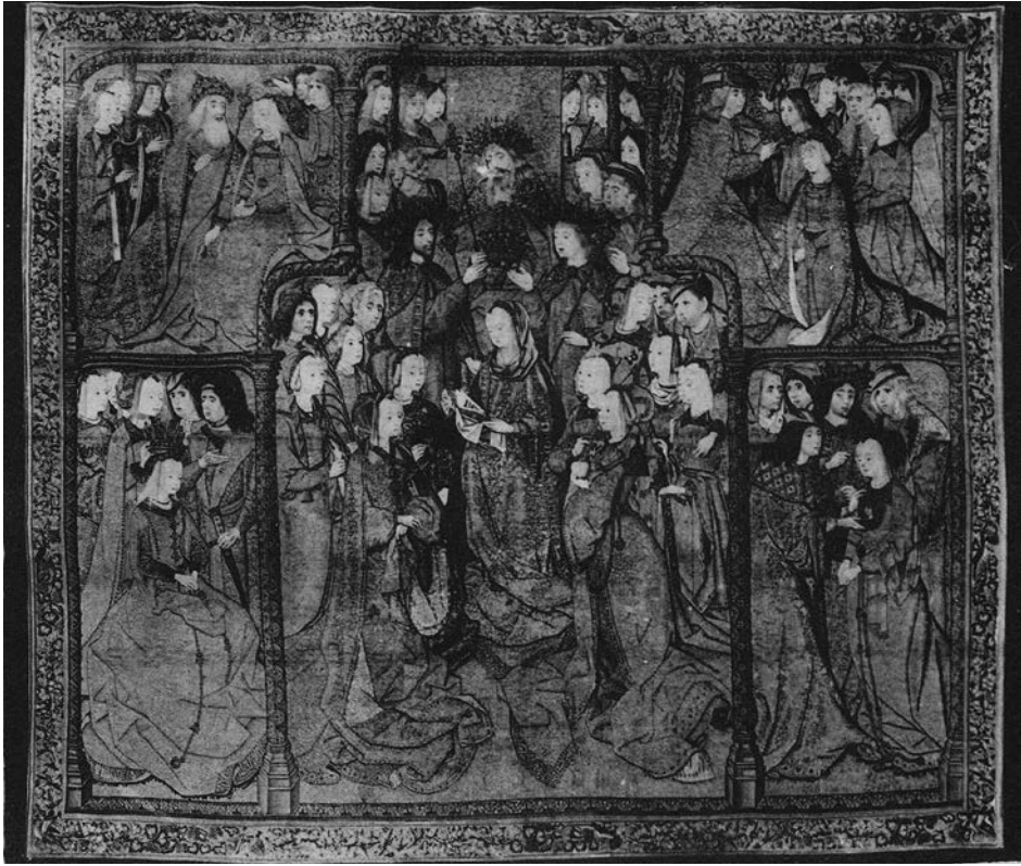
Fig. 4. Coronación de la Virgen. Tapiz de la Serie Triunfo de la Madre de Dios o Paños de oro. c. 1502. (Manufactura de Pieter van Aelst) Oro, plata, seda y lana, 322×375 cm. Patrimonio Nacional, Serie 1.