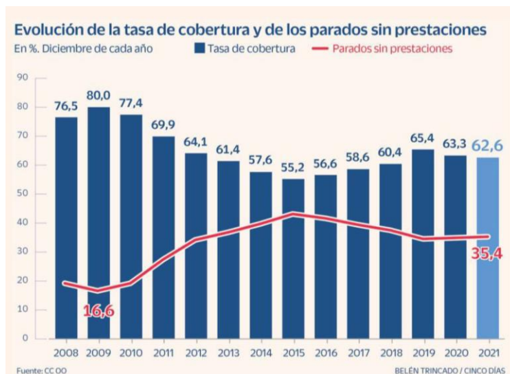
Gráfico realizado en 2021 por el periódico digital Cinco Días . En él se representa la evolución de la tasa de cobertura y de los parados sin prestaciones en España, desde 2008 hasta 2021. 21

la necesidad urgente de construir una protección social universal para los niños. Este informe describe el desolador impacto de la falta de protección social sobre la pobreza infantil, la salud, la educación, la nutrición, el matrimonio infantil y el trabajo infantil.