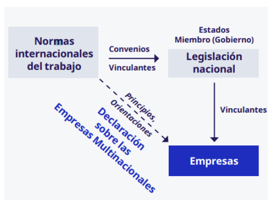
(Gráfico 1: Relación de las normas internacionales del trabajo con las empresas. Nota de la OIT de abril de 2022)

“La Declaración EMN ofrece una orientación clara sobre cómo las empresas, a través de sus operaciones, pueden contribuir a la consecución del trabajo decente. Sus recomendaciones, basadas en las normas internacionales del trabajo, reflejan buenas prácticas para todas las empresas, y además ponen de manifiesto el papel de los gobiernos para incentivar las buenas prácticas empresariales, así como el papel fundamental del diálogo social.”, afirmó Guy Ryder, Director General de la OIT en 2017.