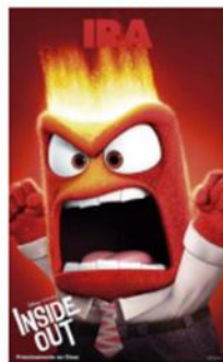
ROL 4 - IRA