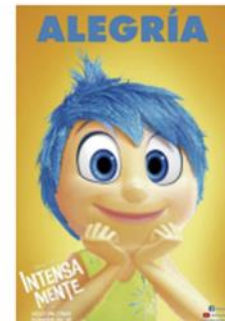
ROL 3 - ALEGRÍA