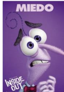
ROL 2 - MIEDO