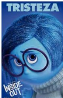
ROL 1 - TRISTEZA