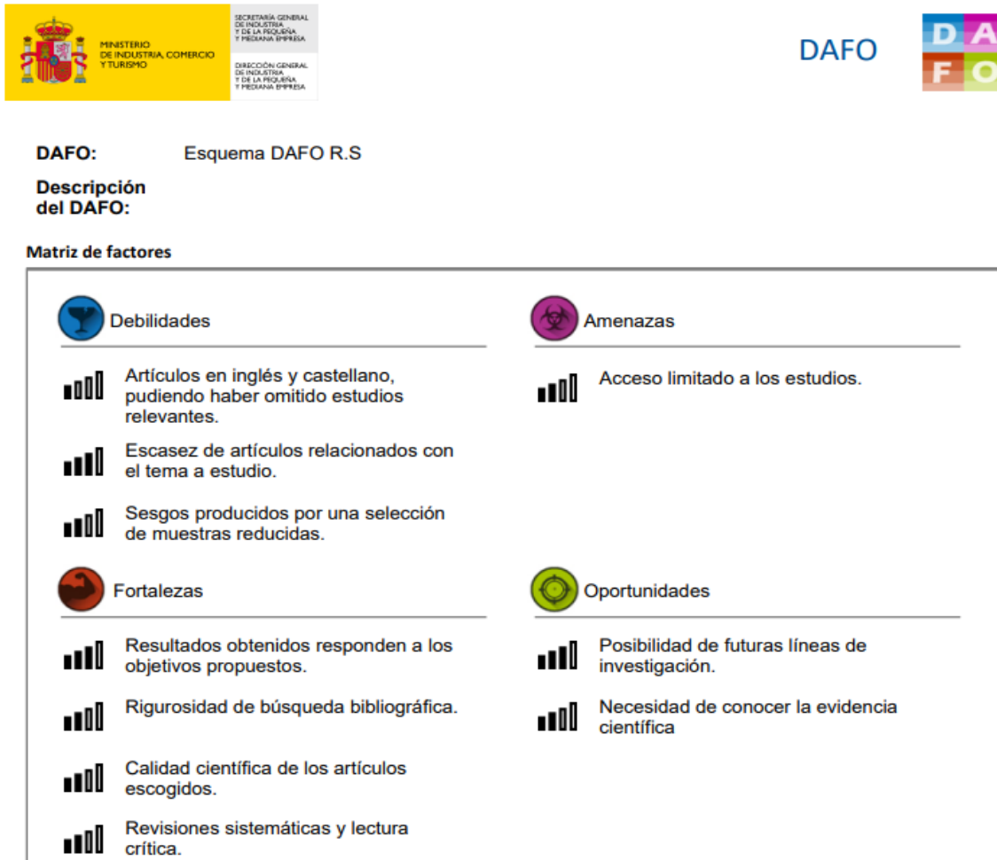
Figura 3: Esquema DAFO. Elaboración propia.