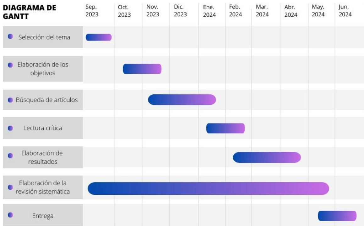
Figura 1: Diagrama de Gantt. Elaboración propia

La revisión sistemática ha sido elaborada durante un periodo de tiempo representado en el siguiente diagrama de Gantt (Figura 1).