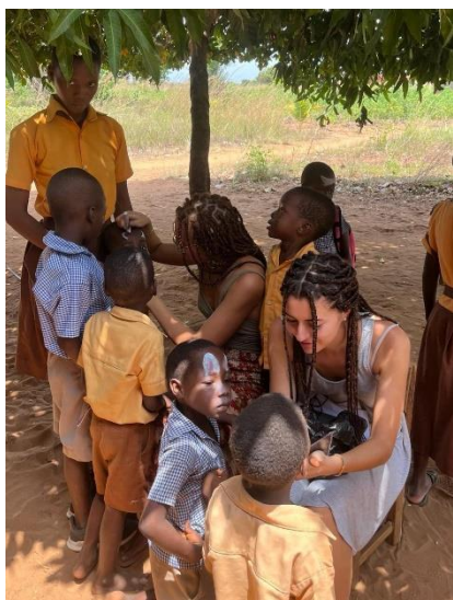
Figura 21. Pintacaras 1