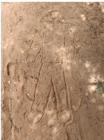
Figura 18. Dibujo cuerpo humano Figura 19. Dibujos de rostro Figura 20. Composición de rostros

En la séptima canción, Head, shoulders, knee and toes , se obtuvieron resultados muy positivos en relación a los objetivos planteados. Los alumnos lograron conocer e identificar las partes de su cuerpo. Esta canción tuvo gran acogida por parte de los alumnos debido a que conocían una versión de la que se les presentó, por lo que fue un contenido muy sencillo de introducir. Respecto a la actividad complementaria, debimos modificarla ya que en un principio estaba planteada para indicar a los niños que debían dibujar una persona con las partes del cuerpo correspondientes, todo ello de manera libre, pero debido a su etapa de desarrollo y el escaso contacto que tienen con el dibujo debimos iniciarlo de una manera guiada hasta conseguir su elaboración de manera más libre.