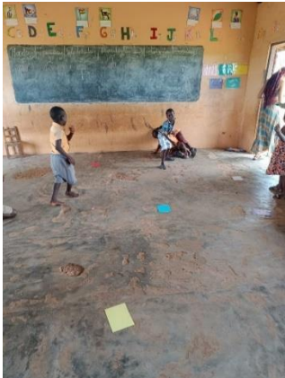
Figura 12. Organización de la actividad