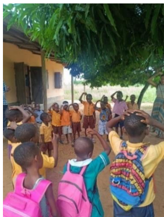
Figura 3. Canción de inicio de la jornada