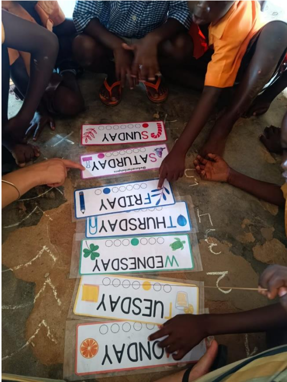
Figura 27. Días de la semana