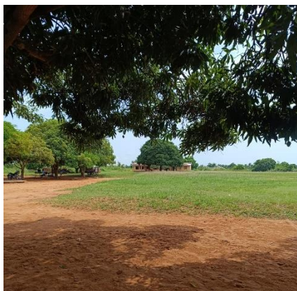
Figura 1. Colegio Atsame-Heluvi