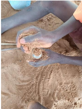
Figura 5. Creación de instrumentos