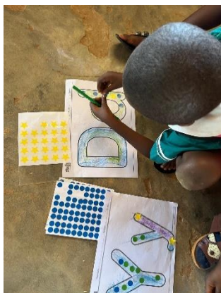
Figura 7. Decoración de letras Figura 8. Proceso de la actividad Figura 9. Resultado

En la segunda canción, Alphabet , se lograron los objetivos previstos, logrando la asociación de fonema-grafema por parte de los alumnos, así como la asociación entre minúsculas y mayúsculas, gracias a la actividad desarrollada. A través del movimiento de los brazos asociado a la canción y de la música, se fomentó el interés y la participación del alumnado en el aprendizaje de las letras. Por otro lado, mediante la actividad complementaria los alumnos pudieron desarrollar su creatividad de manera libre, explorando con materiales que habitualmente no tienen a su alcance. Además, el desarrollo de esta actividad nos permitió contar con un nuevo recurso en clase, pudiendo hacer uso de él en distintos momentos.