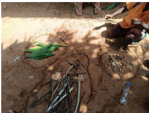
Figura 10. Selección de elementos naturales