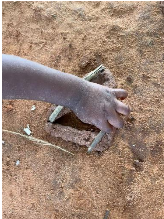
Figura 15. Ejecutando