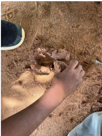
Figura 14. Amasando