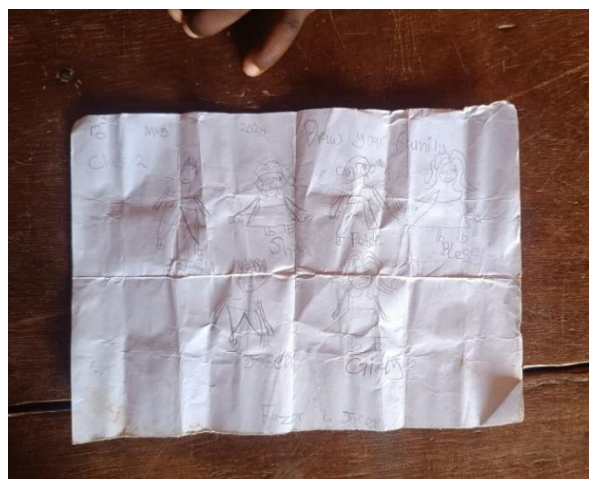
Figura 2. Dibujo de una familia

Por medio de la sexta canción, "Family", los alumnos fueron capaces de reconocer a los miembros de la familia, disfrutando de la realización de actividades musicales. Este contenido fue complicado de introducir en el aula debido a que la estructura familiar en Ghana, concretamente en las aldeas de Atsiame y Heluvi, de donde son los alumnos, destaca por ser compleja y variar de familia en familia. Aun así, al centrarnos únicamente en las personas más cercanas a los niños, es decir, hermanos, padres y abuelos, logramos que los alumnos comprendieran este contenido. Además, en la actividad complementaria, al dejarles libertad para dibujar a su familia, se pudo observar cómo cada alumno plasmó a sus familiares más cercanos, sin incluir necesariamente figuras esenciales en familias europeas, como el padre o la madre, pudiendo compartir algunos de los dibujos una vez finalizados. Sin olvidar que, a través del cuento con marionetas creadas con materiales de desecho y del entorno, resaltamos a los niños la importancia de cuidar el entorno y de dar una segunda vida a los plásticos que nos rodean.