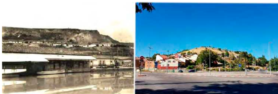
Fig. 2 Dos vistas del emplazamiento, antigua y actual; desde la dársena del canal y desde el encuentro de carreteras

- Articular el aprendizaje de modo individual y de forma colectiva (Pérez, Villalobos, López, 2019), identificando tareas en cada uno de esos modos de trabajo diferentes contribuye a activar el aprendizaje dentro y fuera del aula en una línea coherente que ayude a discernir la adquisición de conocimientos fuera del aula en la mejor eficacia para su progreso en la asignatura. Se trata de convertir al alumno en protagonista de su propio aprendizaje (Rizzo et al, 2015). La facilidad con la que se puede acceder a cualquier fuente de conocimiento en todo el mundo a través de internet hace que esta metodología sea más necesaria.