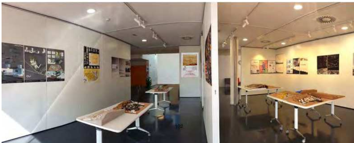
Fig. 5 Exposición de los trabajos, maquetas y proyectos en el centro cívico del barrio y presentación ante los vecinos.

Se realizaron los ejercicios de las asignaturas de Proyectos II y III en el mismo territorio con el fin de aprovechar la implicación del estudiante con la zona de actuación a lo largo de un curso académico completo, resolviendo los problemas generados por las infraestructuras ya obsoletas o inexistentes, así como la relación entre la ciudad y el territorio. El desarrollo de la asignatura de Proyectos II tiene un planteamiento más paisajístico con inclusión de propuestas de carácter público que se localizan en la ladera este, mientras que la asignatura de Proyectos III se desarrollará en el contacto entre la población y su medio natural con intervenciones de carácter residencial en la ladera sur.