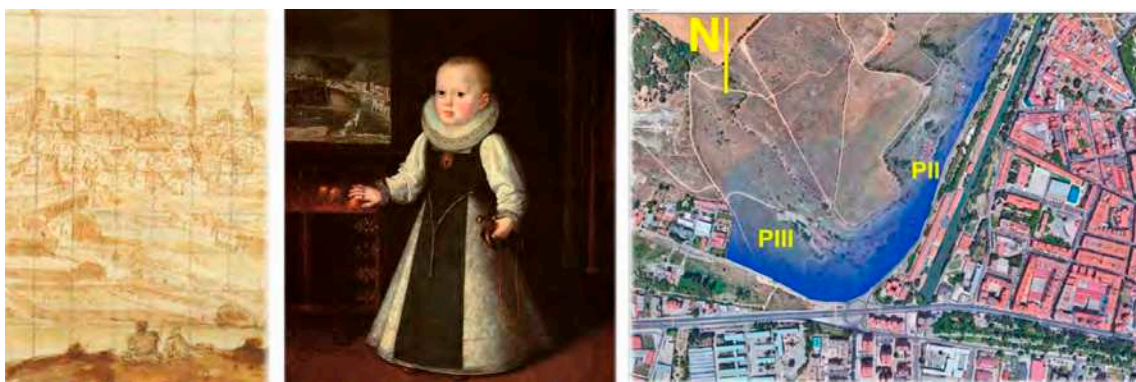
Fig. 1 A). Grabado, fragmento: dos personajes subido en La cuesta de la Maruquesa contemplan la ciudad. B). Vista del lugar de trabajo a través de la ventana de la infanta. C). Plano de situación con la localización de cada semestre

Es un primer e importante paso para transferir al estudiante la importancia de su propia responsabilidad sobre el proyecto, para que sea capaz de trascender la habitual condición de mera práctica escolar en la Escuela. Sus proyectos son ya verdaderas acciones para transformar la realidad, y, en consecuencia, la experiencia de proyectar no es una simulación, sino que forma parte de su experiencia vital. El deseo de transformar la realidad (Piñón, 2006) en todo proyecto surge, en este caso, del encuentro dialéctico con un barrio concreto de la ciudad.