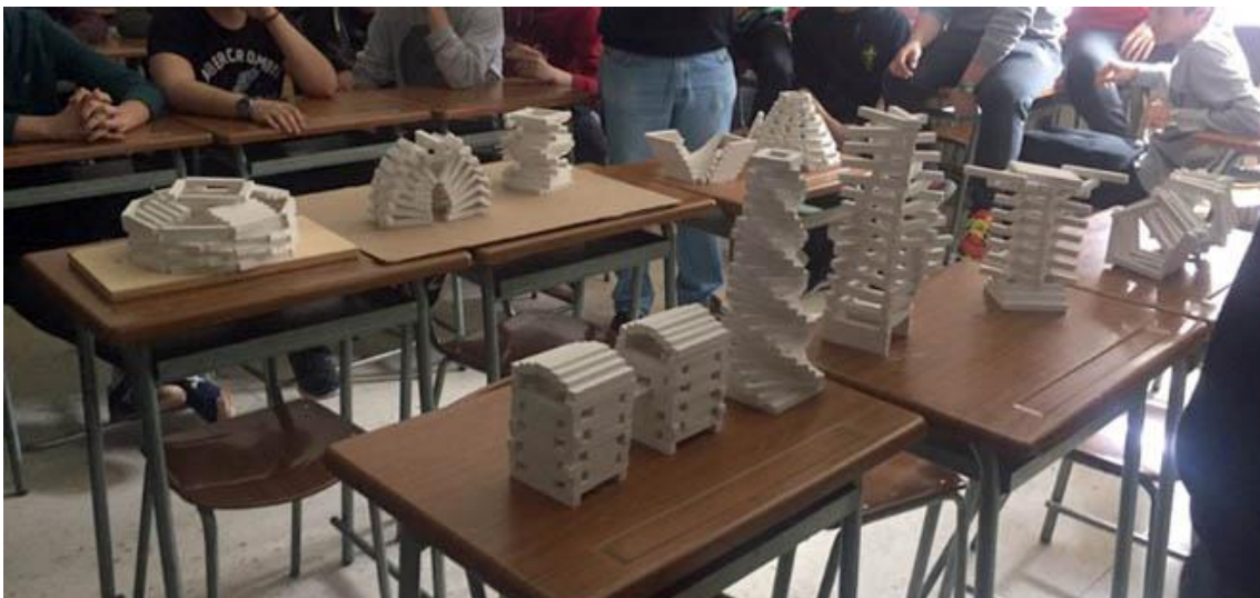
Fig. 7 Algunas de las maquetas realizadas por los equipos. Colegio Maristas La Inmaculada, Valladolid. (Marzo 2017)

Una última fase restaba para completar este proceso; debían fotografiar e iluminar con sus móviles una imagen exterior y otra interior, algo que se les había anunciado al principio. El juego de luces y sombras de su propia maqueta les generaba siempre sorpresa y emoción. Y debían seleccionar, un último esfuerzo de autoevaluación, qué imagen de todas las posibles presentaban. Les obligaba a definir sus intenciones formales y visuales, a explorar un modo de mirar intencionado (Berger, 1972), a practicar el encuadre. Educados en la cultura visual contemporánea y el cine, sabemos el potencial que tiene orientar la mirada y encuadrar una percepción determinada de la realidad que constituye siempre una opción poética; el cine ha experimentado sobre ello desde sus mismos inicios. En Sueño y silencio (2012), el director Jaime Rosales juega con la distinción entre puesta en escena, el espacio donde representan los actores que, a veces, suponemos pero no vemos en su totalidad, y la puesta en cuadro, el espacio fílmico que percibimos en pantalla (Alonso 2013). Estas prácticas sobre el encuadre, sobre el enfoque de la imagen, ayuda a cultivar y educar la mirada.