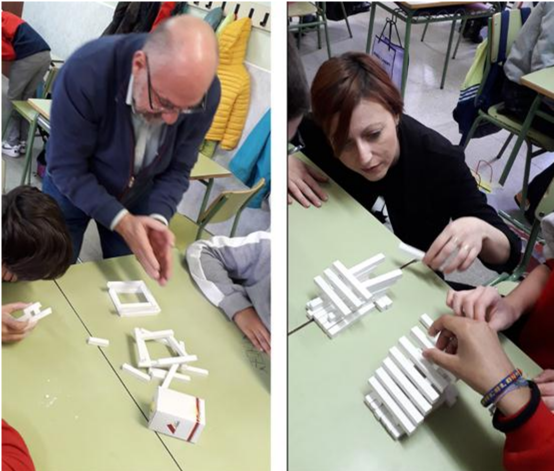
Fig. 2 Experimentación en equipo con orientación del profesor. Colegio Nuestra Señora del Carmen, Valladolid. (Marzo 2019)

La formación de equipos de dos o tres estudiantes estimula el trabajo colaborativo. El intercambio de ideas, el debate entre ellos y la ayuda en la resolución. En su fase última, cuando deben realizar las fotografías interior y exterior de su maqueta, uno ilumina con su móvil mientras el otro toma las fotografías y le orienta en la incidencia de la luz 4 .