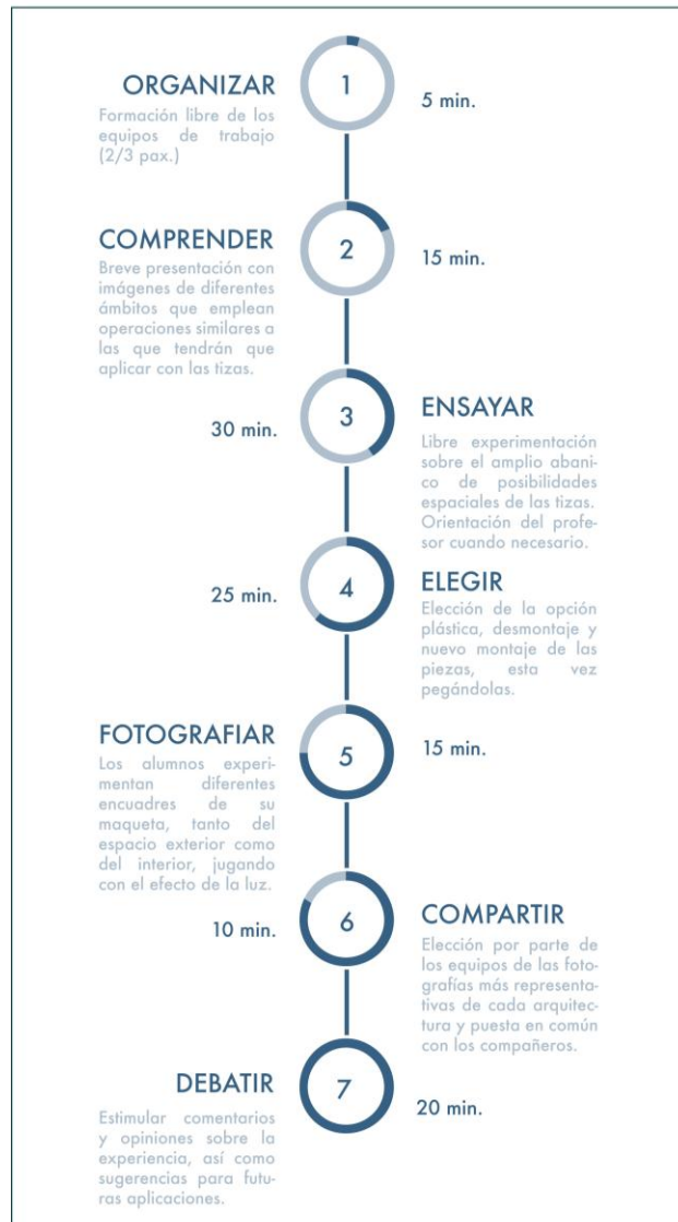
Gráfico 1. Timetable de la actividad