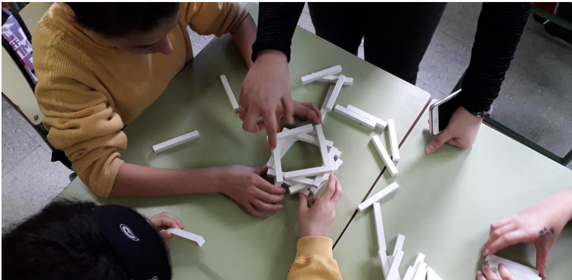
Fig. 2 Experimentación en equipo con orientación del profesor. Colegio Nuestra Señora del Carmen, Valladolid. (Marzo 2019)

Con la ayuda y la orientación del profesor, los estudiantes experimentarán libremente para descubrir las posibilidades que tiene el juego con las tizas para que vayan descubriendo diferentes opciones e inclinándose por la suya. El profesor estará atento a animarles en una de sus opciones y afianzarles en esa línea. Los estudiantes montarán y desmontarán libremente, creando un juego de volúmenes con sencillas operaciones de adición, apilamientos, puentes, entrelazados, etc. que no requieran ninguna otra manipulación más que el corte y pegado.