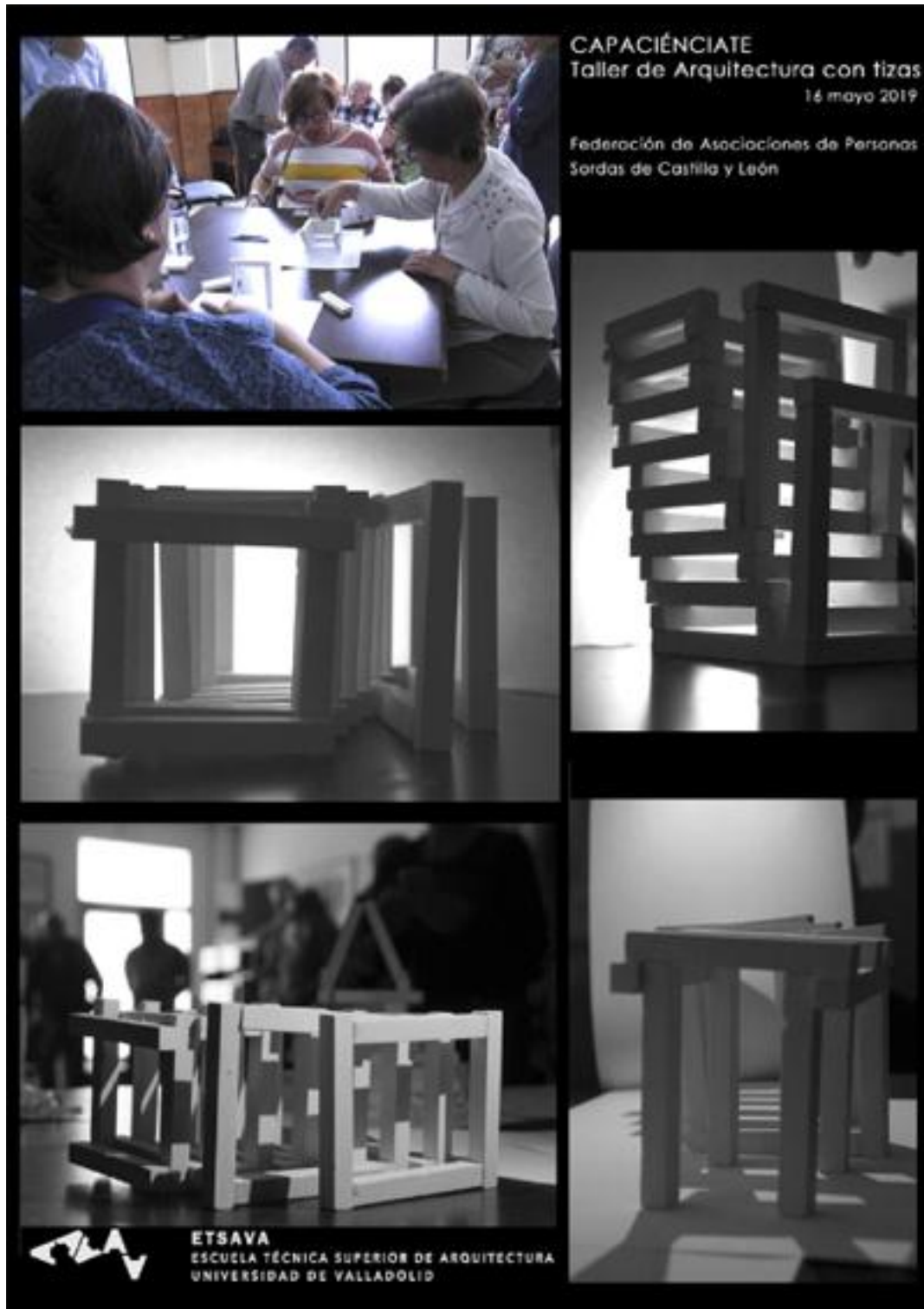
Fig. 2 Cartel. Capaciénciate. Taller de Arquitectura con Tizas. Federación de Asociación de Personas sordas de Castilla y León. Valladolid. (Mayo 2019)

Su procedimiento metodológico, muy riguroso y bien documentado, se ha convertido en referente de investigaciones por la base científica de su trabajo, hasta llegar a ser utilizado como herramienta metodológica para iniciar el aprendizaje proyectual en la Escuela Técnica Superior de Arquitectura de Madrid (Juárez Chicote, 2014). Desde luego, la seriación del