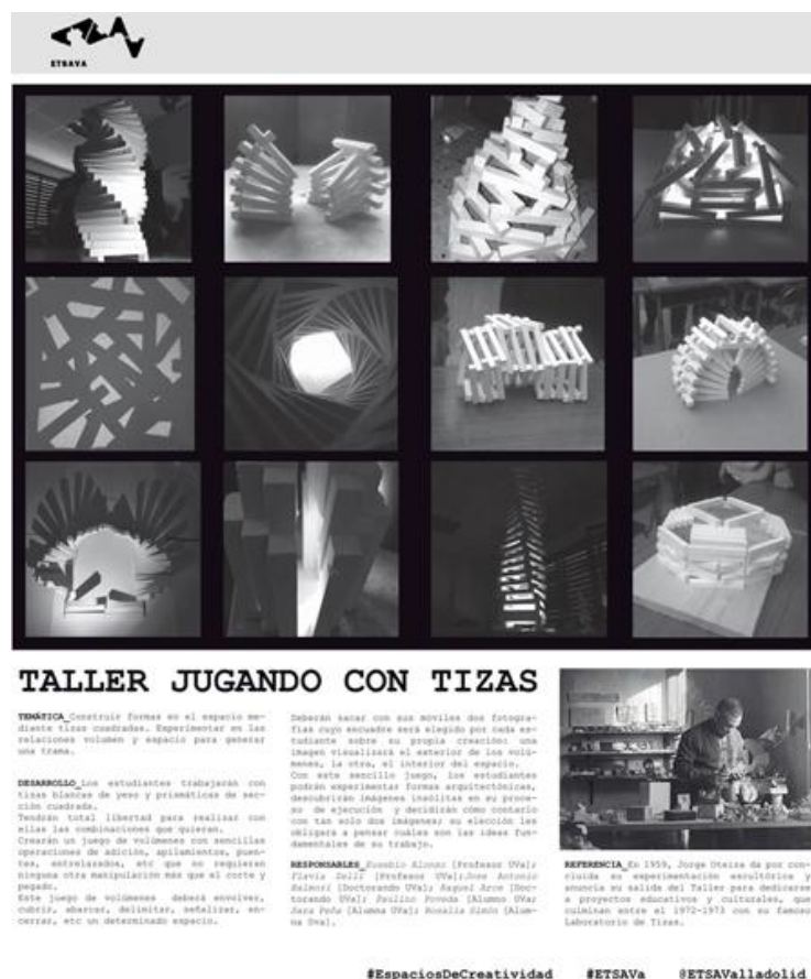
Fig. 1 Cartel. II Feria Espacios de Ingenio Campus la Yutera. Palencia. (Abril 2017)

En este proceso, juega un papel clave la emoción, cuya presencia determina la entidad lo aprendido: tanto el juego como los procesos creativos son emoción, luego ambos representan un claro motor del aprendizaje (Sentieri Omarrementería 2017). Como educadores, no podemos pasar por alto dicha potencialidad: al contrario, tenemos que explotarla al máximo para conseguir acercar los niños a la arquitectura, disciplina en la que no podemos perder de vista la frescura propia de la creatividad infantil, como explicaremos más adelante.