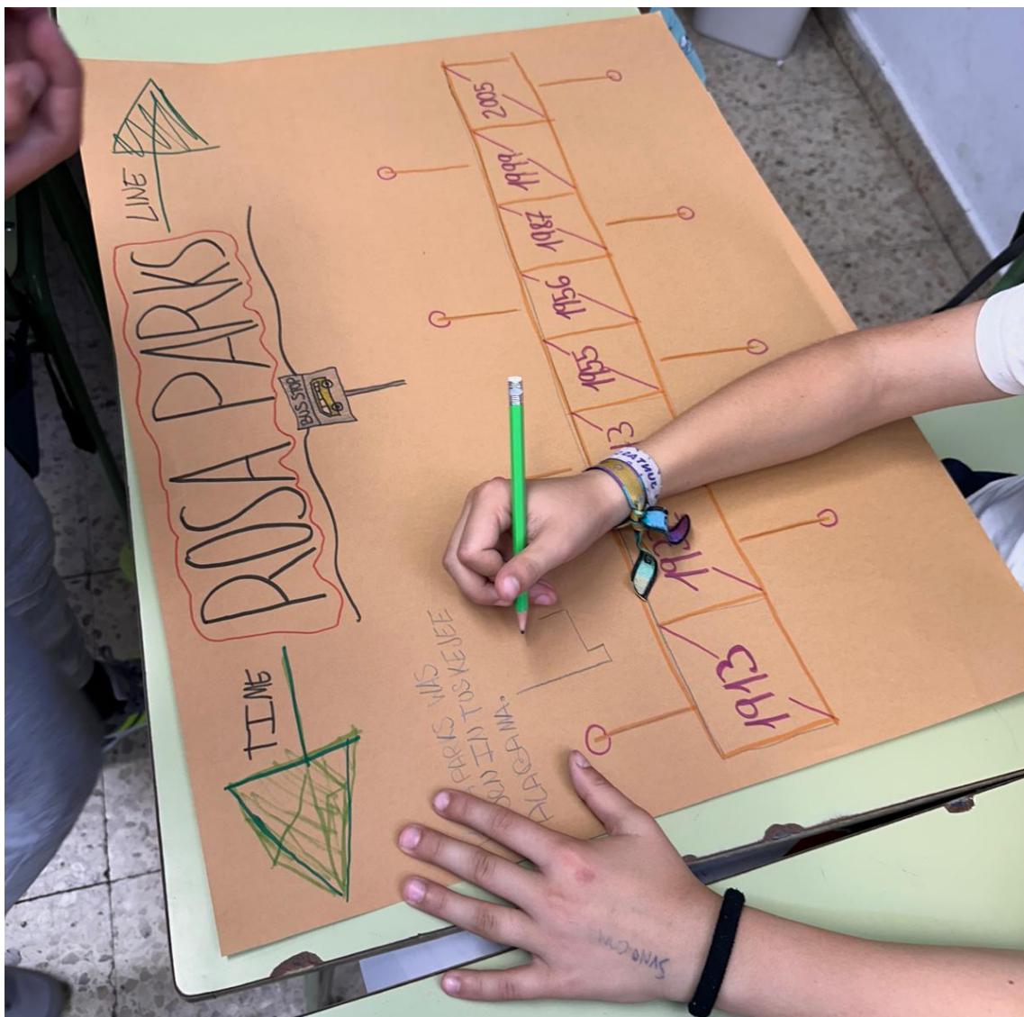
Figura 9: Grupo realizando la línea del tiempo.