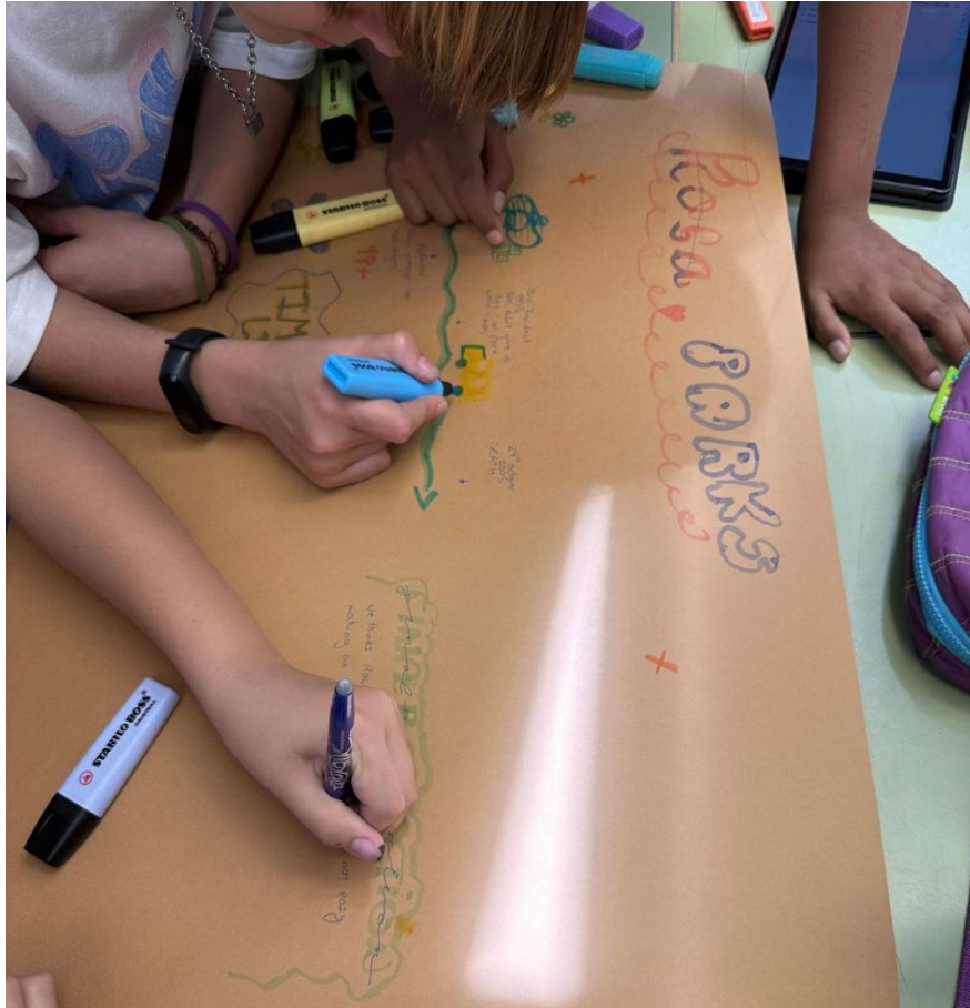
Figura 12: Grupo realizando la línea del tiempo.