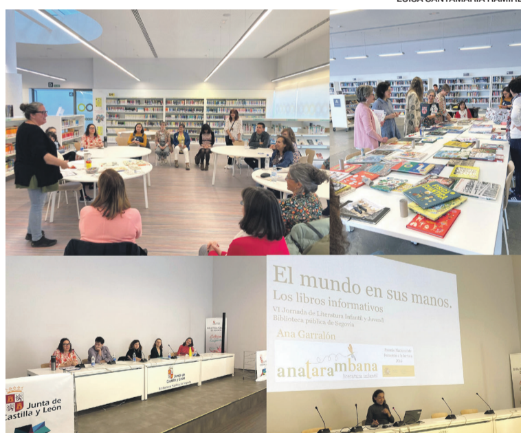
VI Jornada de Literatura Infantil y Juvenil. Biblioteca Pública de Segovia.

Por sexto año consecutivo, la Biblioteca Pública de Segovia ha organizado la Jornada de Literatura Infantil y Juvenil, con el compromiso de visibilizar la importancia de la lectura en los más jóvenes y proporcionar herramientas a los mediadores para realizar una selección cuidada de obras que poner a su disposición.