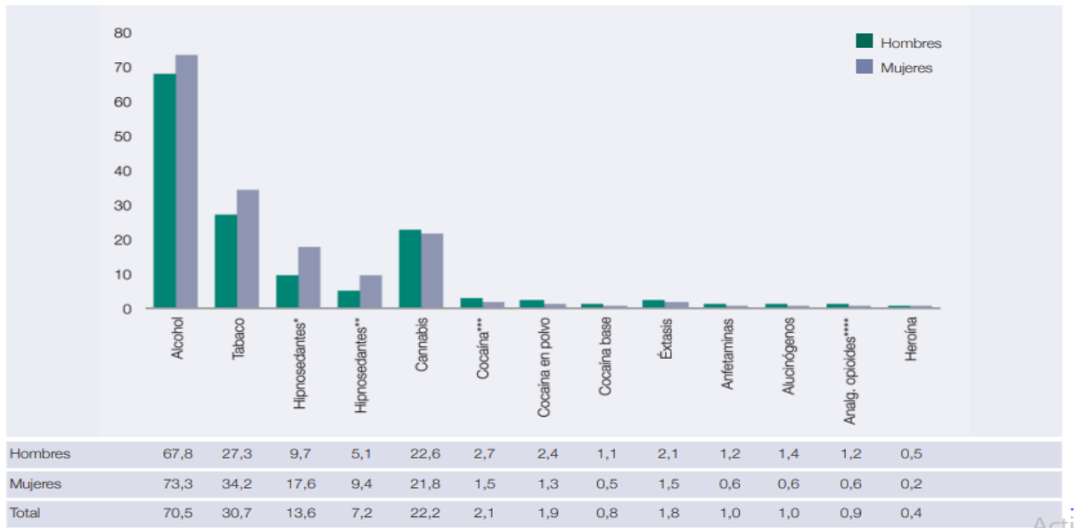
Tabla I: Prevalencia de consumo.

Siendo la droga más prevalente el alcohol, seguida del tabaco y el cannabis, también conocido como marihuana.