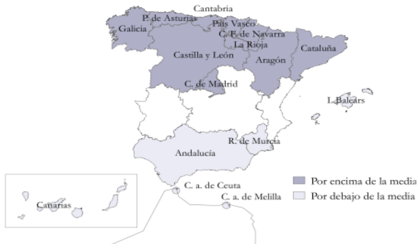
Mapa 1. Distribución relativa del Índice de Desarrollo Educativo. España 1

1 Castilla-La Mancha, la Comunitat Valenciana y Extremadura no participaron individualmente en PISA 2009