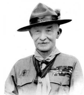
Figura 1: Retrato de Baden Powell

De acuerdo a De Beaumont, M. (2001), El lobo que nunca duerme , libro que analiza la biografía de nuestro protagonista concluimos que Lord Baden Powell nace el 22 de febrero de 1867 en Londres (Inglaterra). Hijo de una familia adinerada, en la que su padre era un prestigioso profesor de Oxford y su madre hija del condecorado almirante inglés W.T.Smyth, rápidamente empezó a relacionarse con el mundo de la exploración y las excursiones en compañía de algunos de sus familiares, sobretodo de sus hermanos, con los que realizaba muchas acampadas por los bosques ingleses cuando tan sólo era un niño. Así es como poco a poco y ya desde muy