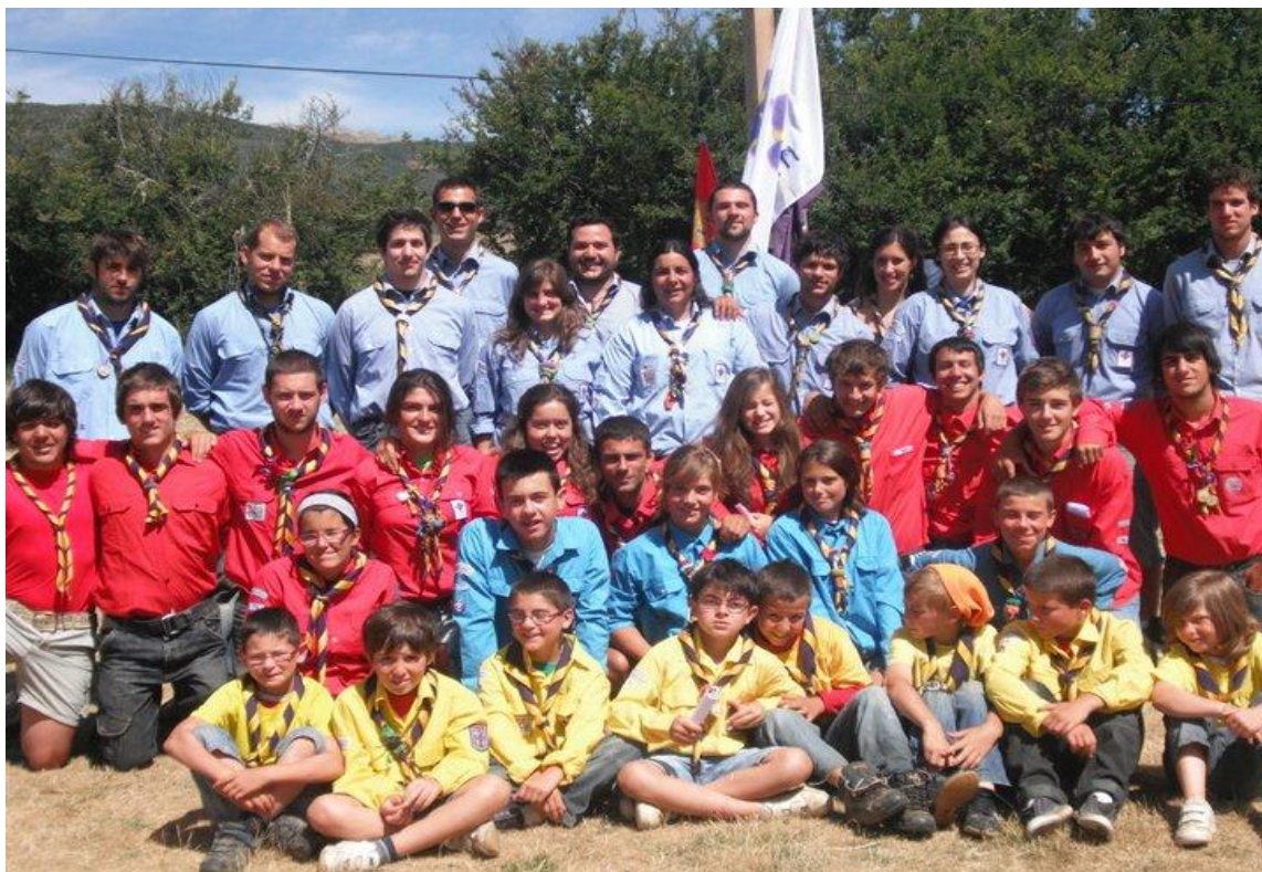
Figura 6: Organización scout