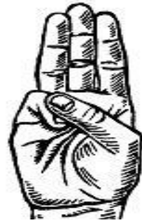
Figura 9: Saludo scout

Todos estos son los símbolos más característicos de los scouts y los que les hace diferenciarse de otras agrupaciones o asociaciones juveniles, y como hemos podido comprobar tienen sus propios significados.