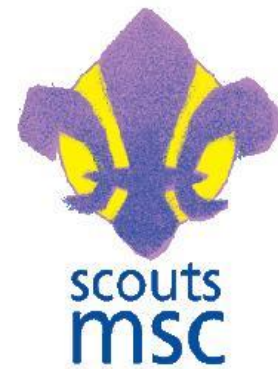
Figura 4: escudo movimiento scout católico

Otro de los movimientos que vamos a analizar en este trabajo de fin de grado es el movimiento scout católico, al ser también un elemento que forma parte de la Federación de escultismo de España. En este caso, el movimiento scout católico tendrá otra metodología o manera de intentar educar a los jóvenes en la consecución de sus objetivos, pero con las ideas de Baden Powell como telón de fondo de su proyecto. Al igual que con anterioridad hemos hecho con la asociación de scouts de España, vamos a hablar de una serie de apartados o aspectos clave que conforman este movimiento scout.