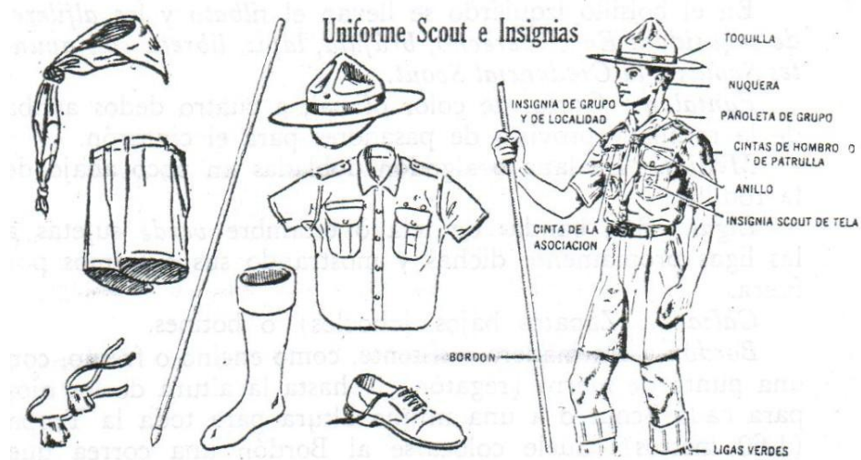
Figura 7: Uniforme scout

Considero los zapatos más apropiados que las botas porque proporcionan más ventilación a los pies y disminuyen el peligro de enfriamiento de las extremidades inferiores ocasionadas por las medias, en caso de que estas por cualquier acción se hayan humedecido.