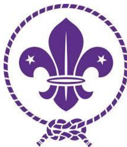
Figura 8: Flor de Lis