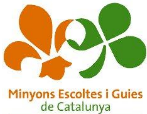
Figura 5: escudo Minyons escoltes u guies de Catalunya

En primer lugar y de acuerdo a la Página web de los Minyons Escoltes. Misión, visión y valores se puede decir que los Muchachos Scouts y guías de Cataluña constituyen una organización sin ánimo de lucro cuya misión es ayudar en la educación de niños y jóvenes siguiendo, como en los movimientos anteriormente estudiados, el método guía y la promesa scout, colaborando en la educación de los jóvenes y creando seres responsables y comprometidos con la sociedad del presente y del futuro. Aquí se incorpora una palabra clave que forma parte de la esencia de este movimiento y que en los anteriores no se