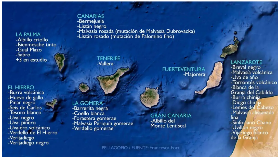
Imagen 2. Mapa de las variedades de uva exclusivas de Canarias y de sus islas. Libro 'Acerca del Canary Wine'. Archivo: PELLAGOFIO. Fuente: Francesca Fort.