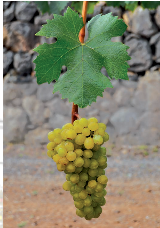
Imagen 8. Verdello de El Hierro.