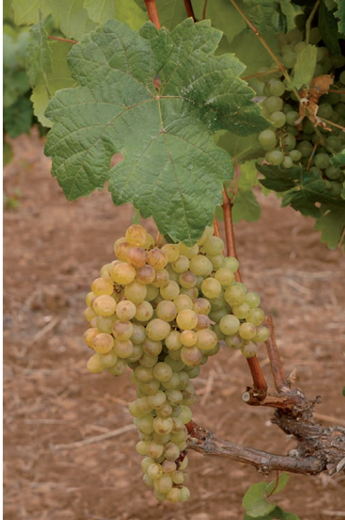
Imagen 7. Verijadiego Blanco.