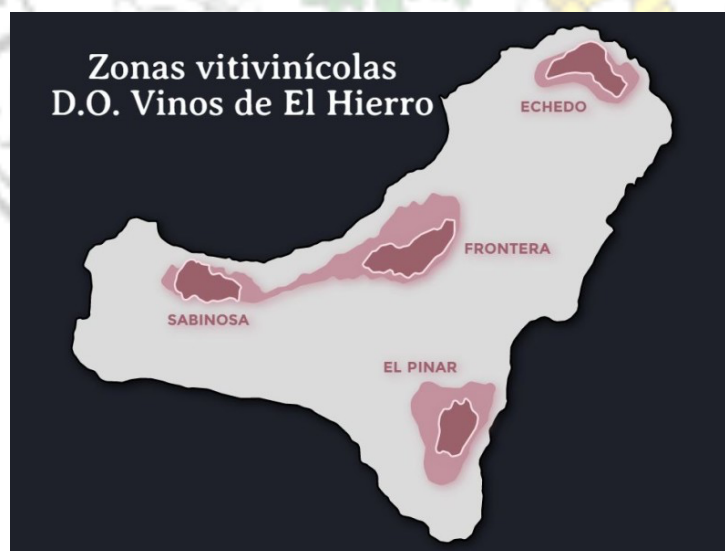
Imagen 1. Mapa zonas vitivinícolas de El Hierro.

Las plantaciones de viña se distribuyen en las tres zonas vitícolas de la isla: El Golfo (Frontera y Sabinosa), El Pinar y Echedo. Las plantaciones están a una altitud entre los 200 y 900 metros sobre el nivel del mar con una gran variación de microclimas dentro de cada zona donde hay variedades de uvas que están adaptadas a una zona en concreto y por lo tanto no se desarrolla óptimamente en otra zona, como por ejemplo es el caso del Verijadiego Blanco, variedad muy sensible al calor y por lo tanto se da muy bien en la zona norte de la isla y en la cumbre de El Golfo (DO El Hierro, s.f.).