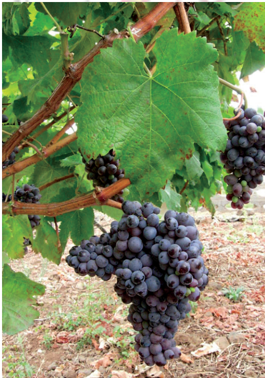
Imagen 9. Verijadiego Negro.