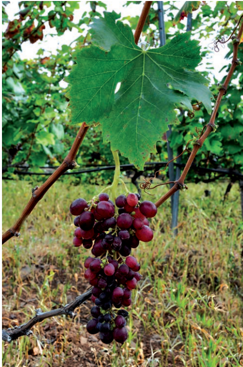
Imagen 3. Bermajuela rosada.