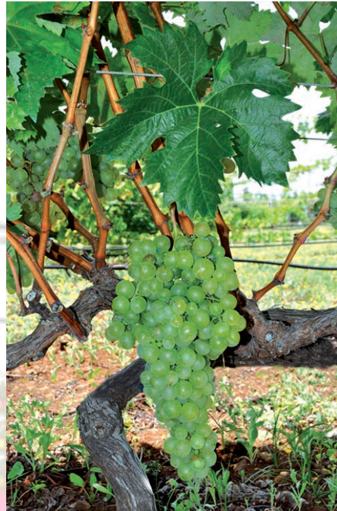
Imagen 4. Burra volcánica.