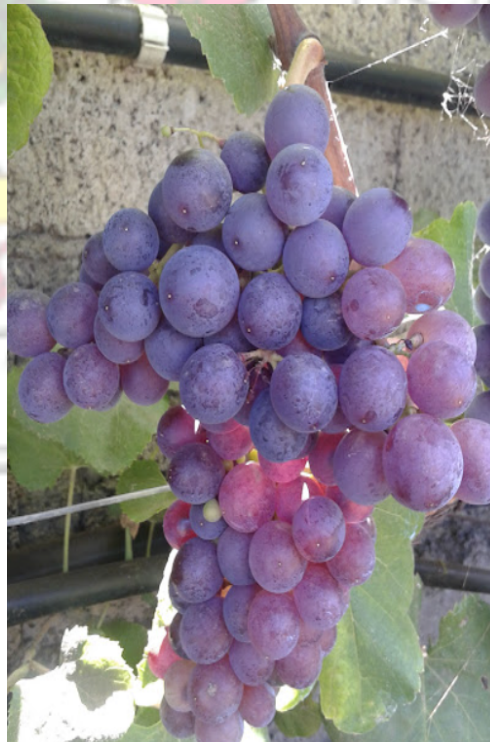
Imagen 6. Negramoll rosada.