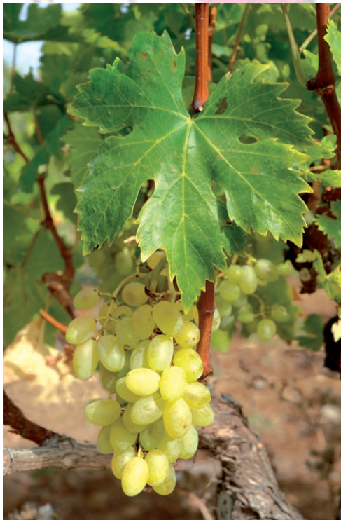
Imagen 5. Huevo gallo.