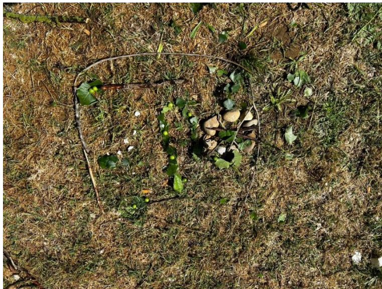
Figura 12. Obra diseñadas por los alumnos. Elaboración propia.

“Paisaje de llanura”: Han representado una hoguera, al lado hay una sombrilla y un camino con árboles.