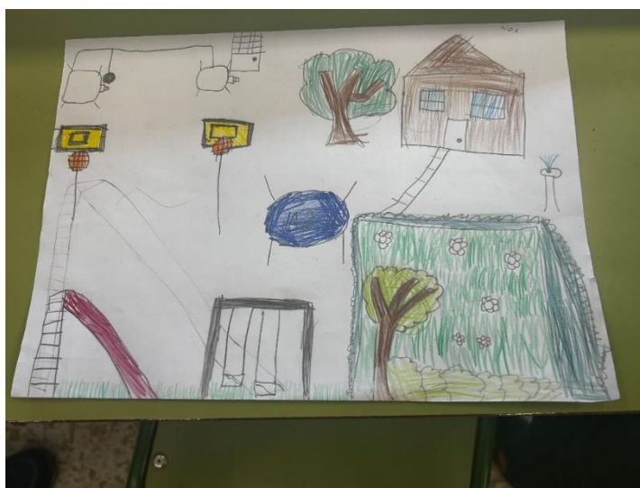
Figuras 1 y 2. Realización de la actividad de creación de su patio ideal. Elaboración propia.