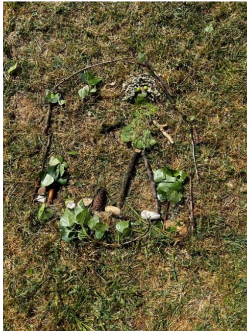
Figura 10. Obra diseñadas por los alumnos. Elaboración propia.

“Barbie naturaleza”: Han representado una muñeca con dos árboles, uno a cada lado.