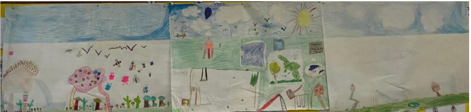
Figuras 3, 4 y 5. Realización del mural para la creación del patio ideal conjunto.