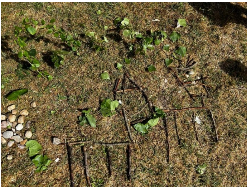
Figura 8. Obra diseñadas por los alumnos. Elaboración propia.

“El gato y el caballo”: Han representado a un gato y un caballo en un bosque con árboles.