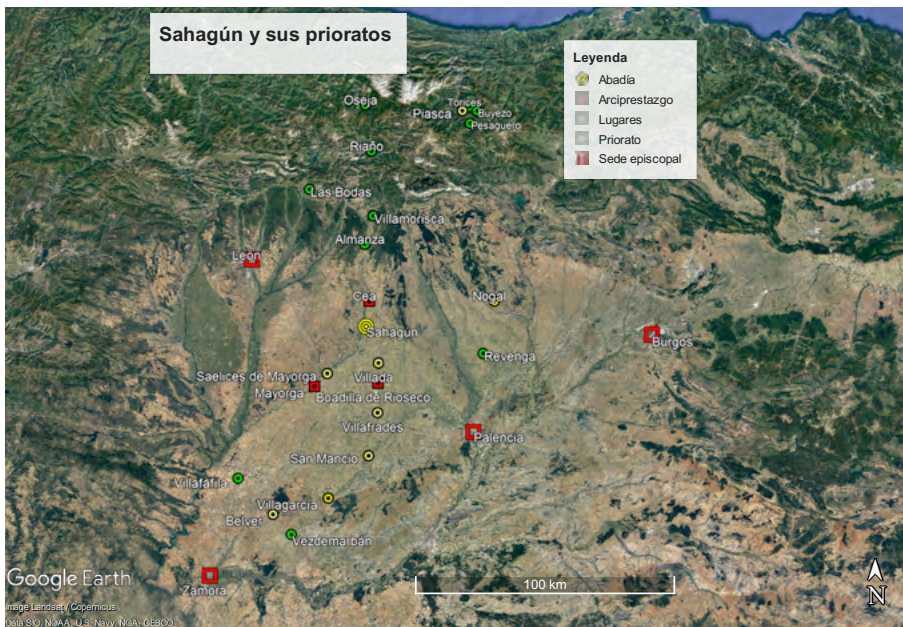
Imagem 1: Mapa de Sahagún y sus prioratos

En la diócesis de Palencia la presencia del monasterio se verificaba a través de sus prioratos de Nogal, Villagarcía, Villanueva de San Mancio y Villafrades. El acuerdo alcanzado entre el obispo de Palencia y el abad de Sahagún en 1341 le reconoce la propiedad de 26 iglesias parroquiales y 18 ermitas, lo que hace un total de 44 9 . No hay fuentes similares para la diócesis de Zamora, donde la documentación del siglo XIV menciona sus iglesias en Villafáfila y Vezdemarbán, además de las de su priorato de Belver de los Montes 10 .