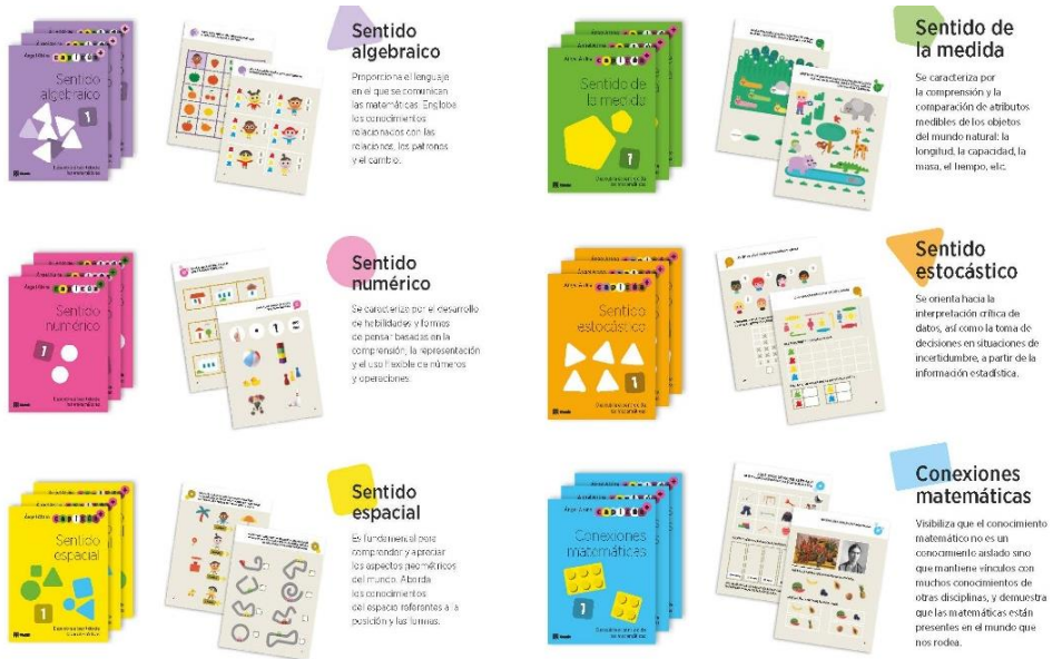
Figura 1. Cuadernos del proyecto Capicúa+

En resumen, los cuadernos son una verdadera joya . Cuadernos, por lo tanto, de imprescindible utilización para los niños y niñas, junto con una propuesta didáctica cuya lectura es imprescindible para los maestros, futuros maestros y para cualquier profesional interesado en educación matemática innovadora. Esta guía, cuyo título es Hoja de ruta para el desarrollo de la competencia matemática infantil , se organiza en los siguientes capítulos: 1) Fundamentos de Capicúa+: El enfoque competencial de las matemáticas en educación infantil; 2) Saberes matemáticos en Capicúa+: Planificación por niveles y página a página; 3) Orientaciones para promover el desarrollo de la competencia matemática en Capicúa+: Itinerarios de enseñanza con ejemplos de contextos reales, materiales manipulativos y juegos, recursos literarios, tecnológicos y gráficos; y 4) Orientaciones para evaluar el desarrollo de la competencia matemática en Capicúa+.