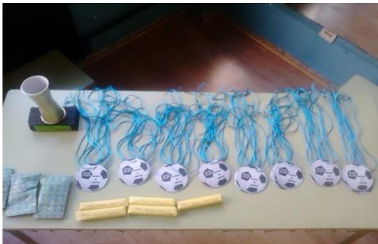
Fotografía 2: trofeo, medallas y regalos.

El obsequio era un detalle por haber conseguido los objetivos que se pedían con esta propuesta. Por su gran participación, esfuerzo y colaboración.